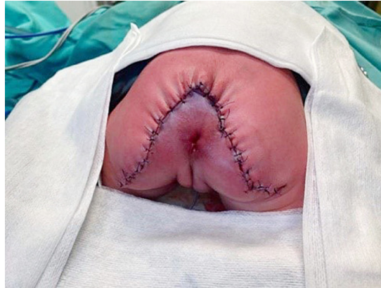
3 pav. Naujagimis, atlikus operaciją (būklė pašalinus didelę kryžkaulio ir uodegikaulio srities teratomą ir atlikus sėdmenų minkštųjų audinių ir sėdmenų plastinę operaciją)

Antrą parą, taikant bendrąją nejautrą, teratoma pašalinta. Pirmiausia, aplink teratomą atliktas V formos odos pjūvis, prie teratomos prieita pasluoksniui. Išdalyti audiniai aplink uodegikaulį, jis pašalintas. Navikas atidalytas nuo tiesiosios žarnos bei kryžkaulio ir pašalintas. Atlikta sėdmenų minkštųjų audinių ir sėdmenų plastinė operacija. Žaizda susiūta pavienėmis siūlėmis. Vaizdas atlikus operaciją pateiktas 3 pav.