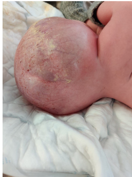
2 pav. Ką tik gimęs naujagimis (kryžkaulio ir uodegikaulio srities darinys – 18×14 cm dydžio; šlapinimosi funkcija nesutrikusi; analinė anga nustumta išorinių lytinių organų link, jos funkcija išlikusi; darinio oda iš dalies makroskopiškai sveika, iš dalies pertempta, paviršius permatomas, matyti platus įvairaus diametro spindžių kraujagyslių tinklas; paviršiaus defektų nėra)