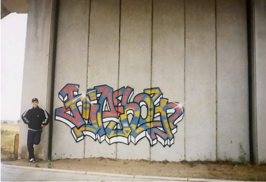
Pav. 11. XX a. dešimtojo dešimtmečio TTP graffiti Lietuvoje: HIP HOP, 1995 m., Kaunas

Latvijoje ir kitose posovietinėse valstybėse subkultūrinio graffiti tradicija išgyveno itin lėtos raidos laikotarpį.