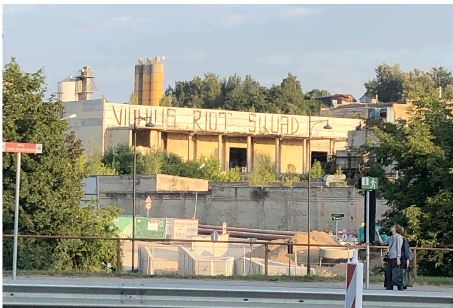
Pav. 30. Linijinės graffiti tėkmės Vilniuje pavyzdys: VILNIUS RIOT SQUAD inskripcija Markučiuose, ant buv. betono gamyklos pastatų, matoma nuo Drujos g., fotografuota 2020 m.

Dalis ypač didelės apimties graffiti darbų, esančių šalia didžiųjų miesto gatvių (o ne užmiestyje prie aplinkelių ir greitkelių) priklauso ir linijinei, ir viešajai tėkmėms. Linijinės tėkmės erdvės logikai projektuojami darbai įprastai yra didelės apimties ir ryškūs, kad būtų matomi iš toli. Jie kuriami apmąstant trajektorijas, pvz., kai graffiti darbas „išnyra“ tam tikrame taške judant transporto priemonėje ir keičiasi kintant stebėtojo perspektyvai; šia prasme tokios subkultūrinio graffiti inskripcijos taip pat gali sukurti „netikėtumo efektą“, būdingą post-graffiti darbams. (Pvz.: Vilnius Riot Squad inskripcija Markučiuose, ant buv. betono gamyklos pastatų Pav. 30).