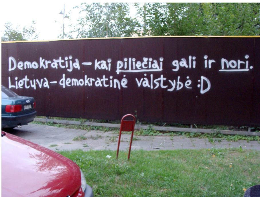
Pav. 22. Politinis graffiti Vilniuje, Gedimino pr., fotografuota 2012 m.

Tačiau vyraujanti politinio graffiti tendencija Vilniuje daugiausiai susijusi su vidaus politikos komentarais (pvz., „Per 20 metų sužlugdė šalį“, „Komunistai vagys“) arba miesto valdymo reikalais ir savivaldybės politikos kritika. Tokioms, vietines aktualijas komentuojančioms, politinio graffiti inskripcijoms parenkamos labai gerai matomos, įprastai kontekstualios „pirmo aukšto“ lokacijos, pavyzdžiui, šalia valdžios institucijų būstinių arba tiesiogiai susijusių su komentuojamomis miesto ar bendresnėmis socialinėmis problemomis (korupcija, transporto kamščiais, dviračių takų trūkumu, pilietiniu pasyvumu ir pan.) (Pav. 22).