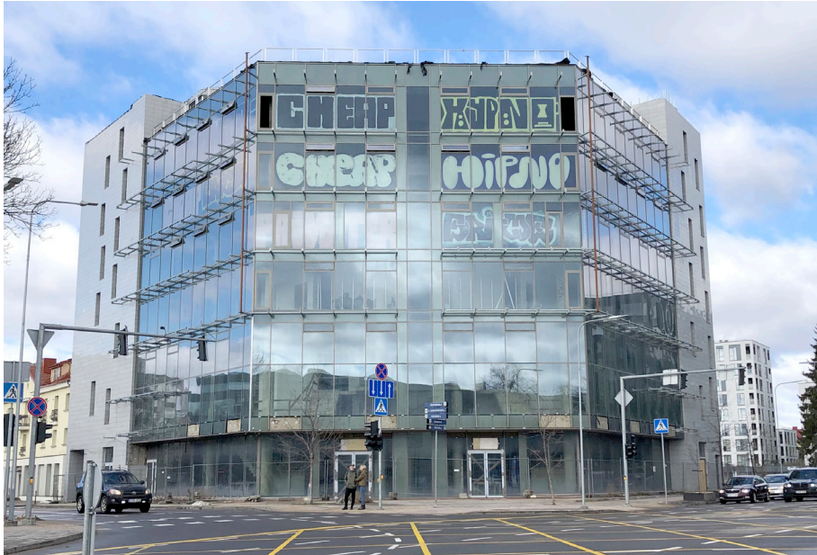
Pav. 25. Apleistos reprezentacinės graffiti erdvės Vilniuje pavyzdys: „Maskvos namai“ Rinktinės g., fotografuota 2020 m.

Jie daro labai gerai. (...) išsirenka tokias vietas, kur būna „wow, eik tu sau kaip čia kietai“. Jie neina taip kad šiaip, „į kiemą pasismaukyt“. Jie anksčiau gal tą darė, dabar jiems to nebereikia. Jie yra dabar pasiekę tą savo fame ir jiems to užtenka. (Inf_1)