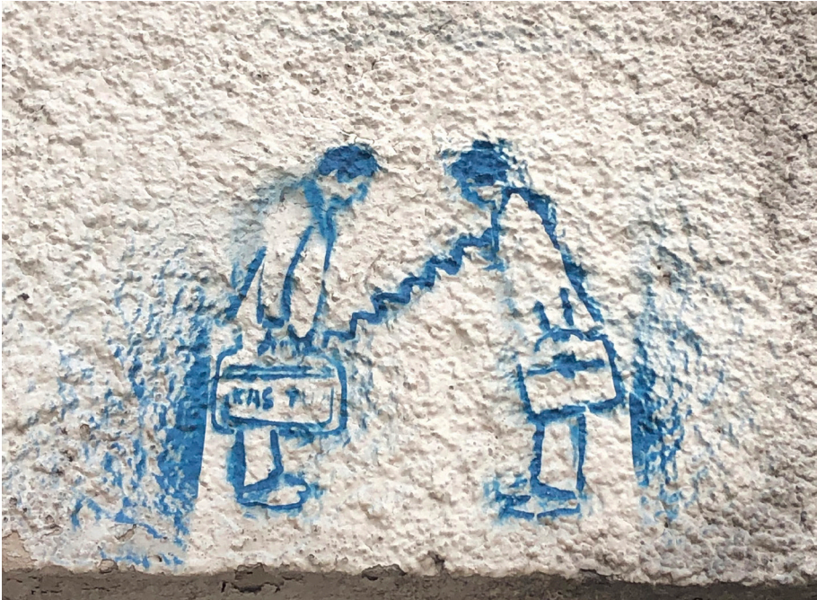
Pav. 14. Trafaretinis punk post-graffiti, Vilniuje Rūdninkų g., 2002 m., fotografuota 2021 m.

„Vajėzau, graffiti miega, šimtu procentų. Niekas absoliučiai nevyksta, niekas netagina, bent jau Senamiesty ir Centre tai tyla visiška.“ (Inf_13)