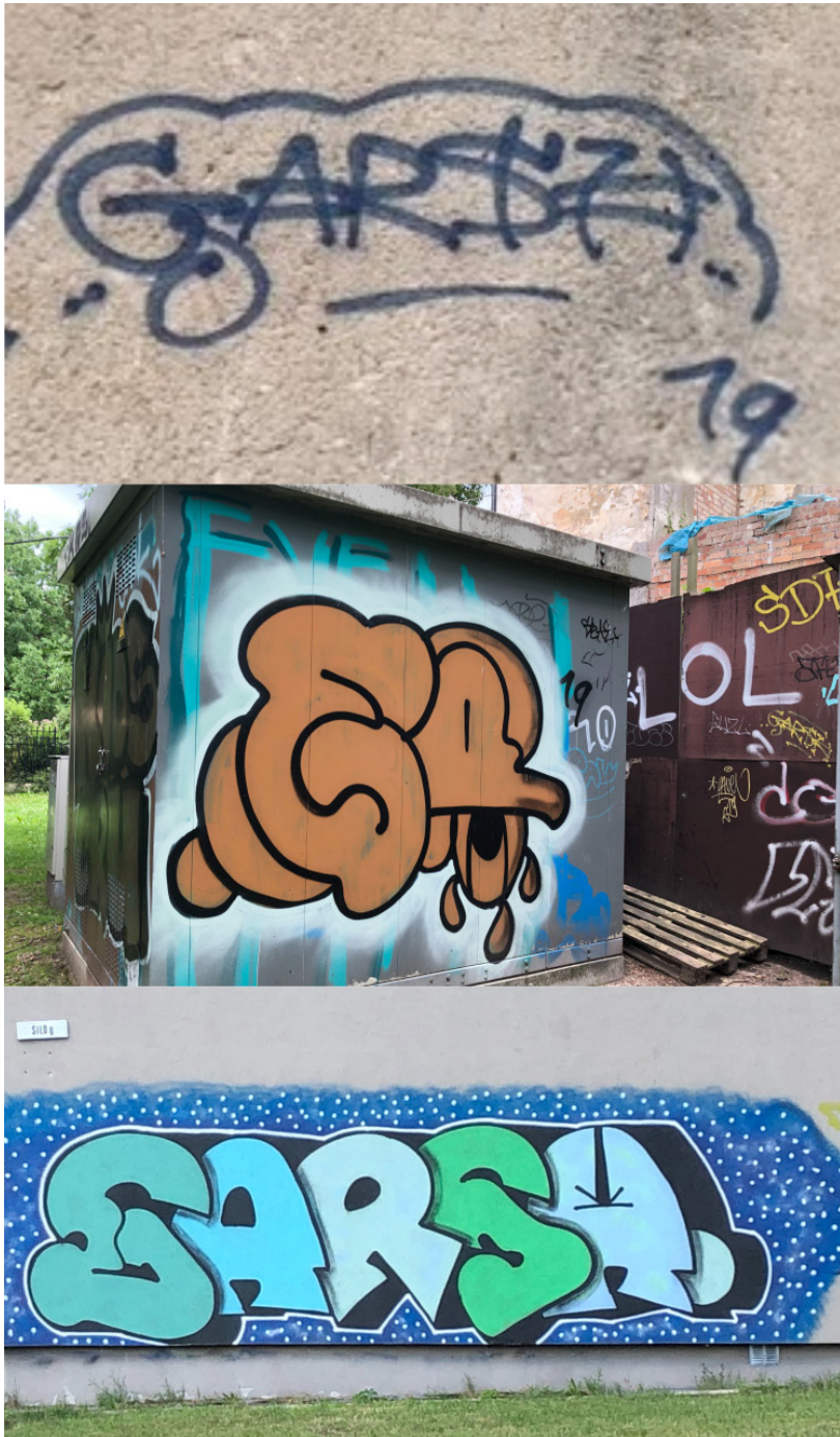
Pav. 2. Pagrindinės subkultūrinio / TTP graffiti formos: tag, throw-up, piece. GARSH, Antakalnis, Centras, Vilnius, fotografuota 2019–2020 m.