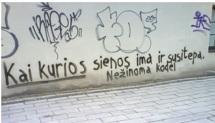
Pav. 1. „Kai kurios sienos ima ir susitepa. Nežinoma kodėl“. 2009 m. Vilnius, Vilniaus g. 22, siena šalia Radvilų rūmų

Vieną 2009 metų naktį Vilniaus centrinėje dalyje ant Vilniaus g. 22 namo sienos šalia Radvilų rūmų dailės muziejaus atsirado užrašas-provokacija didelėmis raiškiomis juodomis raidėmis: „ Kai kurios sienos ima ir susitepa. Nežinoma kodėl“ (Pav. 1). Graffiti inskripcijų neišmokusiam matyti ir skaityti žvilgsniui nesankcionuoti užrašai ar piešiniai miesto erdvėje tokie ir rodosi: besirandantys bet kur, bet kaip, nežinia koku tikslu. Chaotiški, neprasmingi, iracionalūs.