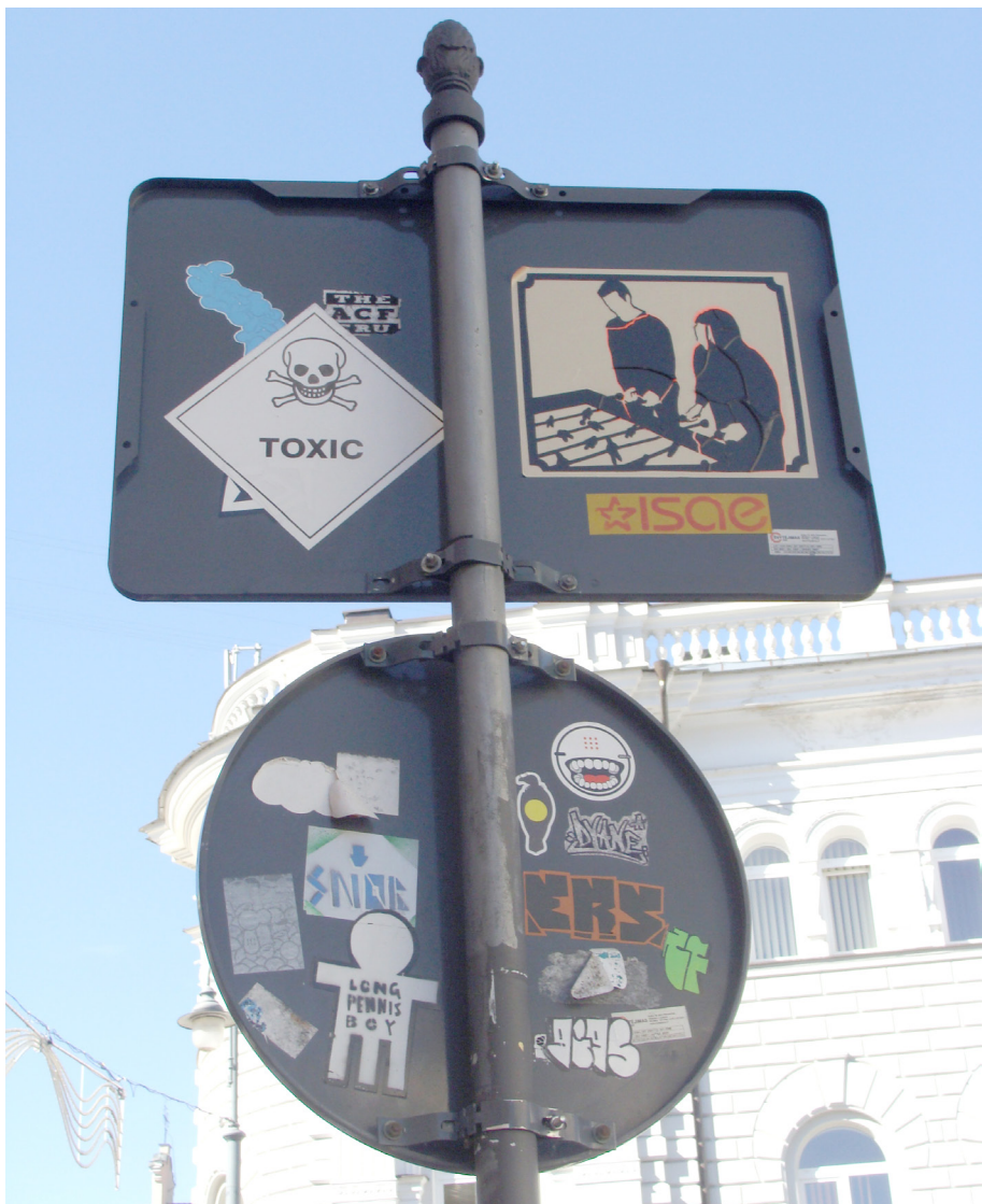
Pav. 23. Kompromisinės graffiti ir post-graffiti erdvės Vilniuje: „blogoji“ kelio ženklų pusė, Gedimino pr., Vilnius, fotografuota 2012 m.

(kaip, pavyzdžiui, reprezentacinės erdvės), bet yra kur kas labiau pastebimos, atviresnės įvairioms auditorijoms nei anomaliosios tėkmės erdvės.