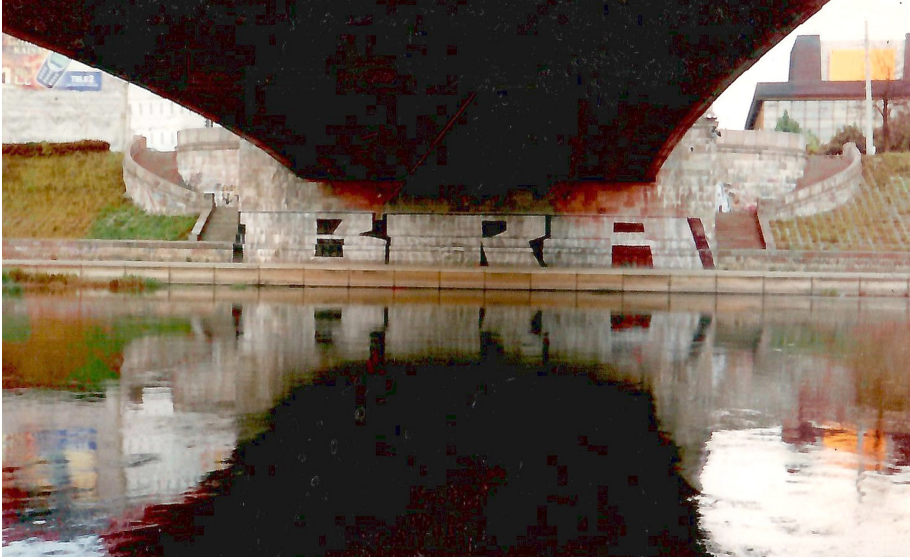
Pav. 31. Linijinės graffiti tėkmės Vilniuje pavyzdys: BRA darbas po Žaliuoju tiltu, apie 2000–2002 m.

Dar viena istoriškai svarbi linijinės tėkmės reprezentacinė graffiti erdvė Vilniuje – Žaliojo tiltas, po kuriuo reikšmingi, išpūdingo dydžio graffiti ir post-graffiti darbai periodiškai atsiranda nuo XX. 10-ojo dešimtmečio pirmos pusės (Pav. 31):