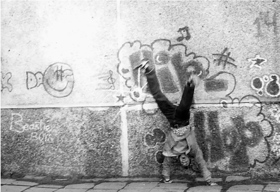
Pav. 10. Ankstyvasis subkultūrinis graffiti Lietuvoje, apie 1987–89 m., Kaunas

mas tradicijos perėmimo paviršutiniškumas ir besiformuojantis vietinės scenos periferiškumas. Vilniaus graffiti periferiškumą sąlygoja išorinės (istorinė, ekonominė, technologinė izoliacija nuo Vakarų Europos, ypač iki 2000 m.) ir vidinės priežastys (miestų ir graffiti bendruomenių mažumas), o apibūdina tokie veiksniai kaip imitacijos pagrindu perimamas ir neišplėtotas TTP kanonas, nekuriama originali vietinė graffiti kanono interpretacija, erdvinis nuosaikumas. Taip pat gana mažas skaičius aukščiausio statuso, tarptautinio pripažinimo piešėjų (king'ų) skirtingose piešėjų kartose.