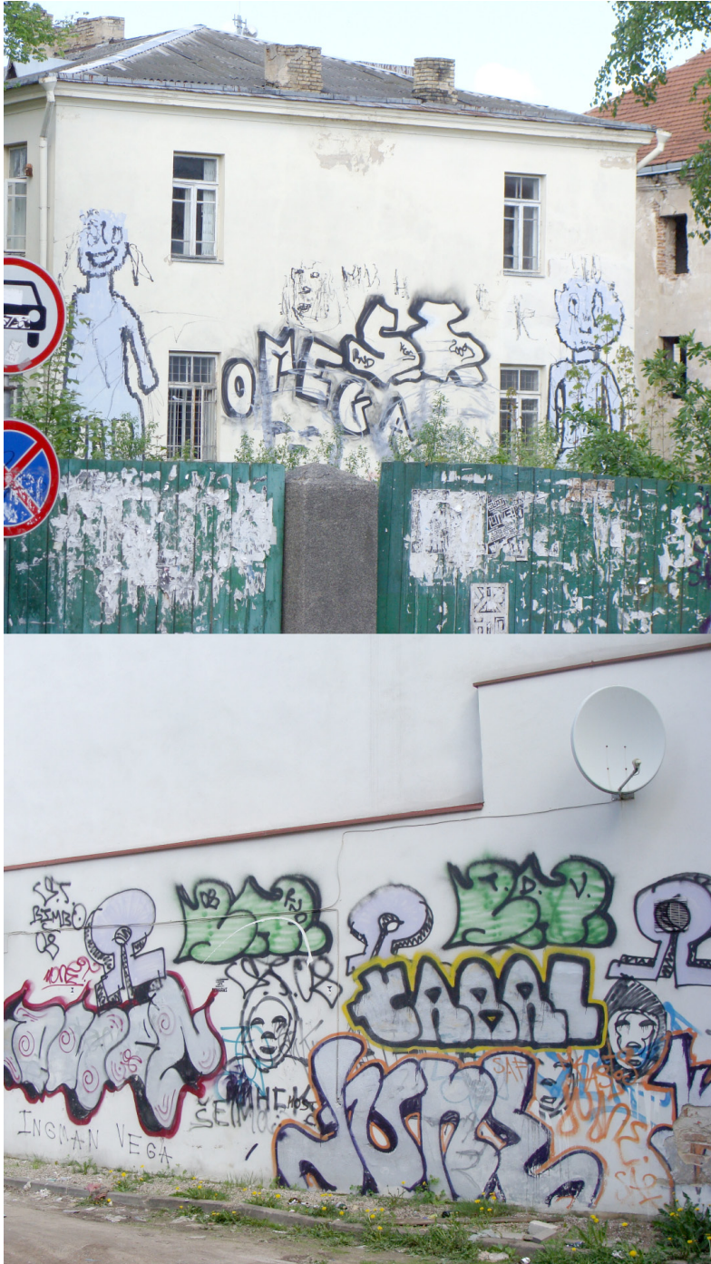
Pav. 13. Graffiti Vokiečių g. centrinėje Vilniaus dalyje Aukso amžiaus laikotarpiu, fotografuota 2010 m.