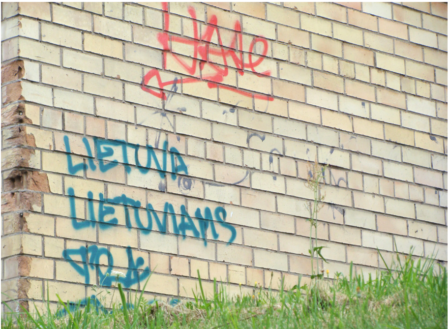
Pav. 4. Politinio graffiti pavyzdys, Saulėtekis, Vilnius, fotografuota 2012 m.