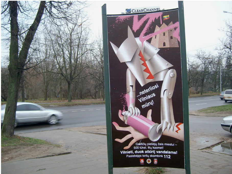
Pav. 15. Vilniaus anti-graffiti kampanijos plakatas, Žirmūnai, Vilnius, fotografuota 2010 m.

piešėjų persekiojimas ir sekimas, inskripcijos imtos gana sistemingai valyti arba perdažyti, ypač centrinėse Vilniaus dalyse, imtos riboti legalios graffiti sienos, legalioje graffiti scenoje pamažu išsivyrėja didelės apimties neo-freskos, o TTP graffiti stilistika aktyviai ignoruojama. Šio laikotarpio pokyčius, susijusius su asmeniniu saugumu, išaugusiu pavojumi piešti graffiti, lygindami su sąlygine laisve piešti graffiti iki 2010 m., reflektuoja ir tyrimo dalyviai: