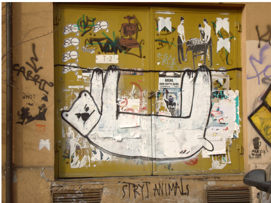
Pav. 6. Post-graffiti pavyzdžiai: tarafretai, plakatai, lipdukai, piešiniai. Šv. Brunono Bonifacio g., Vilnius, fotografuota 2009 m.