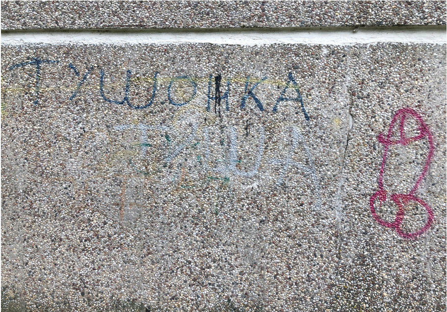
Pav. 3. Liaudiškojo graffiti pavyzdys, Justiniškės, Vilnius, fotografuota 2021 m.