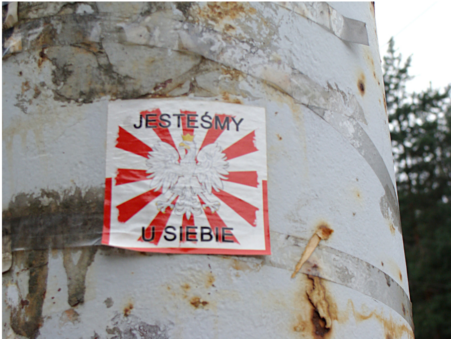
Pav. 21. Nacionalistinis Lenkijos sporto sirgalių post-graffiti Vilniuje, fotografuota 2012 m.

Pastarieji pastebimi ne tik stadionų, traukinių ir autobusų stočių aplinkoje, bet ir turistiniuose Vilniaus Senamiesčio maršrutuose, ypač aplink Aušros vartus. Šiose ir kitose, tiesiogiai su futbolu nesiejamose miesto dalyse, Lenkijos klubų futbolo fanų inskripcijos įgyja ir politinio graffiti požymių kaip komentarai ar simboliai, postuluojuantys nacionalistines idėjas – tokie kaip „Wilno jest Polskie“, „Jesteśmy u siebie w Wilnie“, Lenkijos vėliava ar kita heraldinė simbolika, Armijos Krajovos simbolis – inkaras, supintas iš raidžių P ir W (lenk. kotwica ) (Pav. 21).