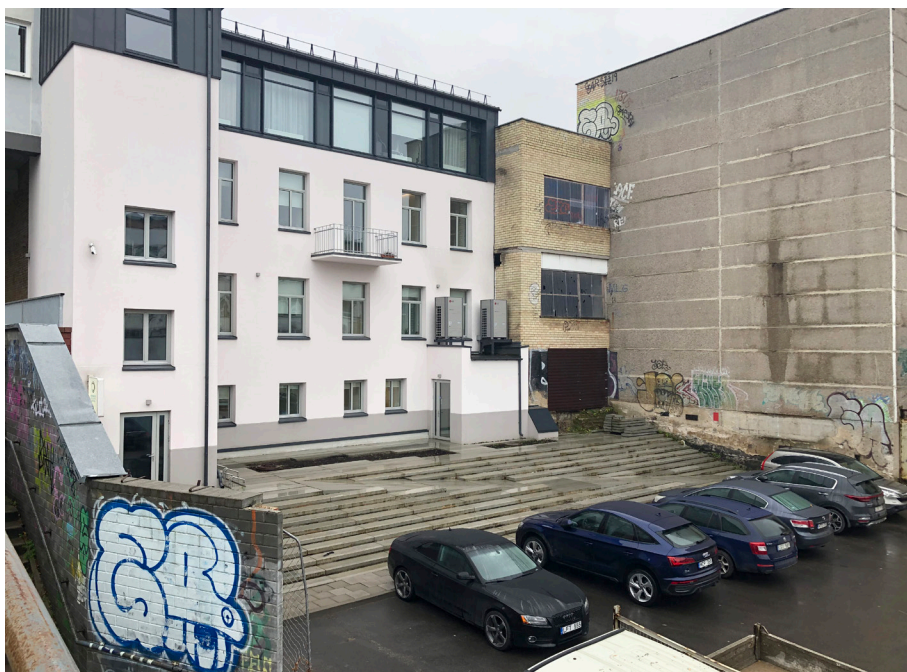
Pav. 19. „Baltos sienos efektas“ Antakalnio g., fotografuota 2021 m.

Vienas ryškesnių „baltos sienos efekto“ atvejų, erdvės stebėjimų metu užfiksuotas 2020–2021 m., yra Antakalnio g. 40 naujai renovuoto ir baltai nudažyto pastato (kuriame įsikūrusi privati medicinos klinika) kiemo pusė. Ji bent metus laiko išliko nepažymėta jokiais graffiti inskripcijomis, piešėjams sąmoningai renkantis aplinkines sienas, jau pažymėtas ilgamečiais graffiti darbais. Taip pat svarbu pažymėti, kad šis pastatas yra itin aktyvios graffiti praktikos teritorijoje (Pav. 19). Toks „baltos sienos efektas“ yra tam tikras Vilniaus graffiti bendruomenės išskirtinumas ir jos graffiti erdvės suvokimo nuosaikumo požymis, nes kitose graffiti aplinkose, atvirkščiai, visiškai švari siena (angl. virgin wall ) įprastai laikoma iššūkiu ir itin patrauklia graffiti žymėjimui erdve.