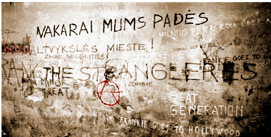
Pav. 5. Subkultūrų graffiti pavyzdys. Sienos, esančios Vilniuje, kieme šalia kavinės „Ledainė“, M. Gorkio g. (dabar Pilies g.), populiaros įvairių neformalių jaunimo grupuočių susibūrimo vietos, fragmentas, 1988 m.