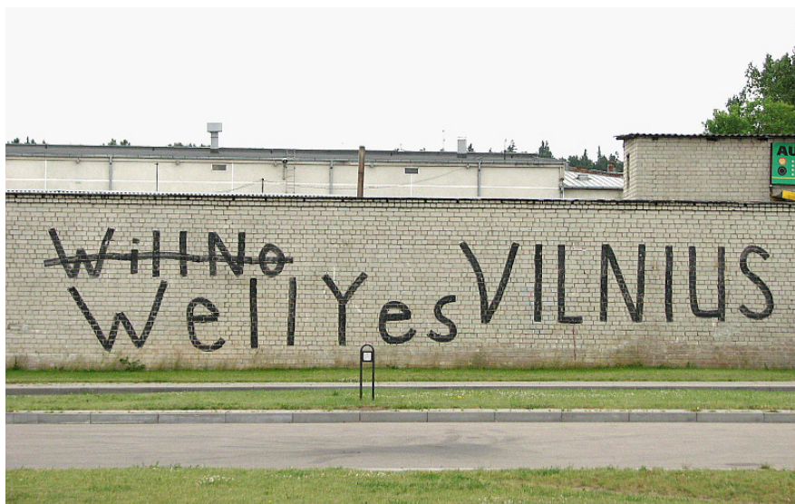
Pav. 18. Vilnius, Zietelos g., Vilkpėdė (užrašas matomas nuo Tūkstantmečio g.), 2012 m.