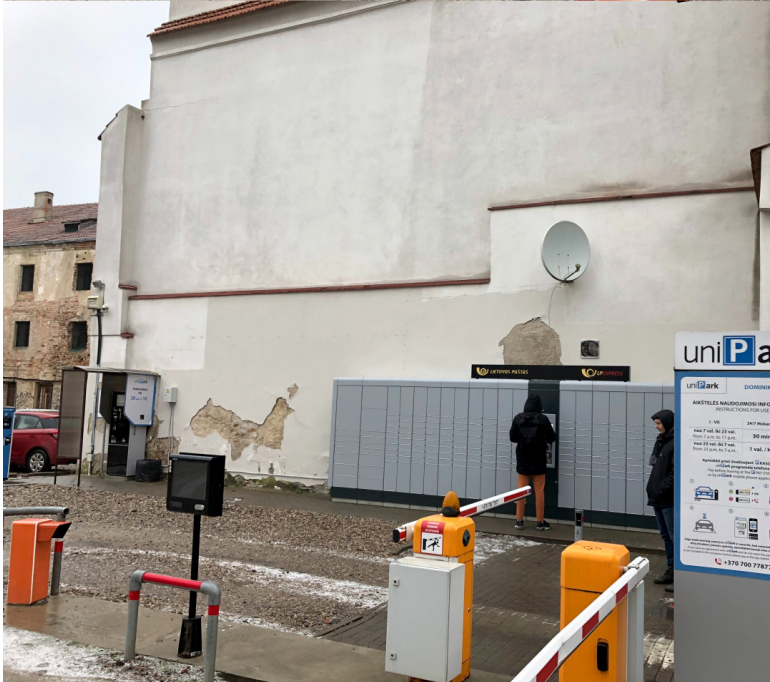
Pav. 16. Graffiti Vokiečių g. centrinėje Vilniaus dalyje Atoslūgio laikotarpiu, fotografuota 2020 m.