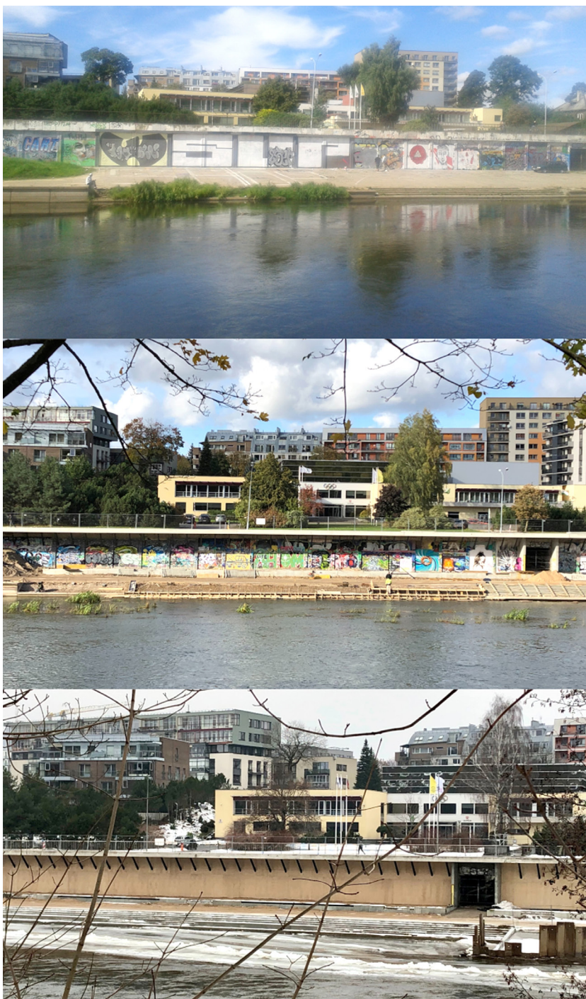
Pav. 27. Olimpiečių prieplaukos siena 2013 m. vasarą, 2020 m. vasarą ir 2021 m. žiemą.