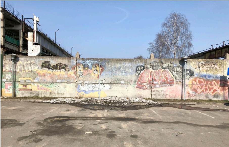
Pav. 29. „Eikos“ siena Savanorių pr., 1998 m., fotografuota 2020 m.

Ir mes labai didžiavomės tuo dalyku, kad turėjom, va, tokią sieną. Nors ji buvo legaliai padaryta, viskas pagal susitarimą.“ (Inf_23)