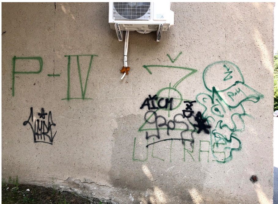
Pav. 20. Futbolo fanų graffiti Vilniuje, pakeliui į „Žalgirio“ sporto bazę Žolyno g., Vilniuje, fotografuota 2021 m.

Vilniuje tokiomis subkultūrinės sporto sirgalių erdvsės konstravimo pavyzdžiais gali būti Žolyno g. žalia „Ž“ raide pažymėti 23 apšvietimo stulpai, vedantys „Žalgirio“ treniruočių bazės link bei futbolo klubų atributika nužymėti stulpai pakeliui į „Vėtros“ stadioną Liepkalnyje (Pav. 20). Velikonja (2020: 143) kaip vizituojančių futbolo fanų graffiti būdingas erdves mini ne tik tiesiogiai su sportine veikla susijusias, bet ir logistines (atvykimo, išvykimo, sustojimo) lokacijas – tokias kaip tarptautinės traukinių, autobusų stotys, viešojo transporto stotelės bei degalinės. Aplink šias Vilniaus erdves iš tiesų pastebimi atvykstančių sporto komandų sirgalių graffiti darbai; matomiausi užsienio futbolo klubų fanų, ypač – atvykstančių iš Lenkijos – užrašai bei post-graffiti darbai (lipdukai, trafaretai).