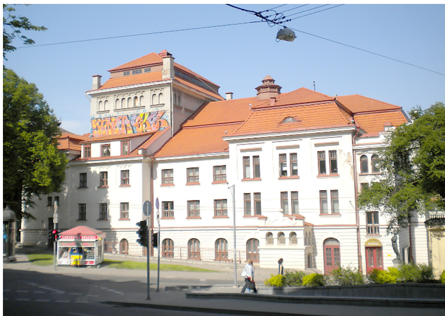
Pav. 24. Reprezentacinės graffiti erdvės Vilniuje pavyzdys: S.T. Ir SKEL / SPUT aukštuminiai darbai, J. Basanavičiaus g., fotografuota 2012 m.

Piešimas reprezentacinėse erdvėse tiesiogiai susijęs su piešėjo statusu subkultūroje – tie, kas piešia matomiausiose ir rizikingiausiose lokacijose, įprastai turi daugumos bendruomenės narių pripažįstamą fame ir king statusą arba aktyviai jo siekia: