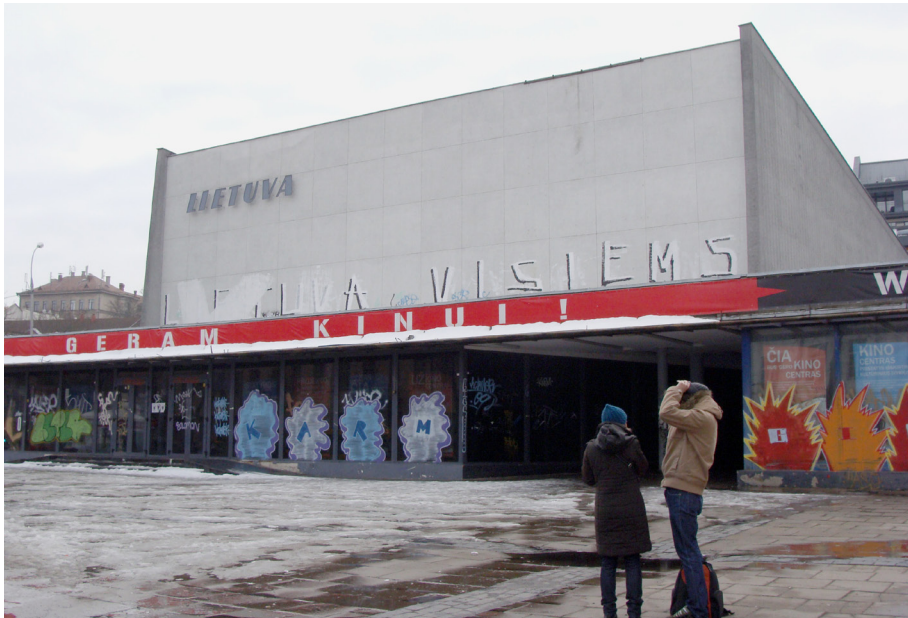
Pav. 26. Kino teatras „Lietuva“ Pylimo g., reprezentacinė Vilniaus graffiti erdvė, fotografuota 2010 m.