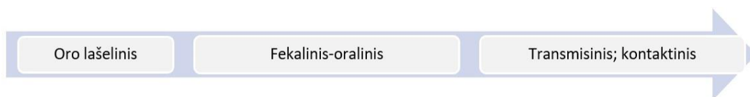
2 pav. Infekcijos plitimo būdai

Infekcijos plitimas. Infekcijai plisti būtina nepertraukiama grandinė, t. y. infekcijos šaltinis (sukėlėjai aplinkoje), infekcijos plitimo kelias ir imlus recipientas (2 pav.).