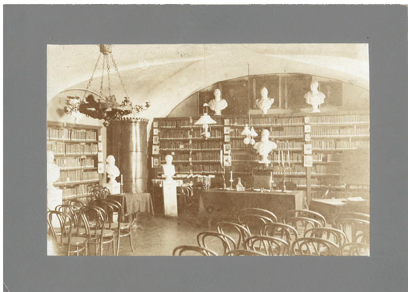
1 PAV. Draugijos biblioteka. XIX a. pab.

binetinio formato), medicinos daktaro Adomo Adamovičiaus (antroje šios nuotraukos pusėje įrašyta: „Societati Med. Vlnensi dono obtulit Wł. Zahorski 1897“) ir 2 Ipolito Jundzilo (kabinetinio ir vizitinio formato).