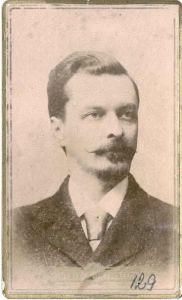
7 PAV. Vladislav Zahorski – (1858–1927). Fotogr. Vl. Zahorskis? Vilniuje

Gimęs Švenčionyse 25 tremtinio šeimoje: tėvas taip pat buvo gydytojas, ištremtas į Uralo sritį. Vl. Zahorskis medicinos mokslus baigė Maskvos