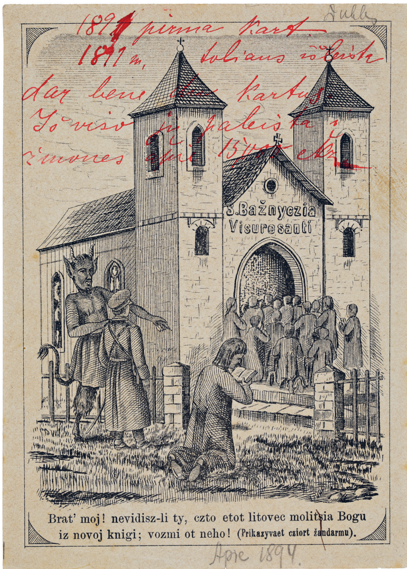
2 ILIISTR. Aversas: Brat' moj! nevidisz-li ty, czto etot litovec molitsia Bogu / iz novoj knigi; vozmi ot neho! (Prikazyvaet cziort žandarmu). – Reversas: [Angrabaitis, Juozas?]. Bažnyčia V[ieszpaties] J[ėzaus] Kristaus visuresanti. Szitoji Bažnyčia, kurią maskolei parsekioja yra Lietuvoje. [Tilžė: J. Angrabaičio leid., M. Jankaus spaustuvė], [1891]. [2] p. – Egz.: Vilniaus universiteto biblioteka, signatūra: LR 4503. – 95 × 135 mm.