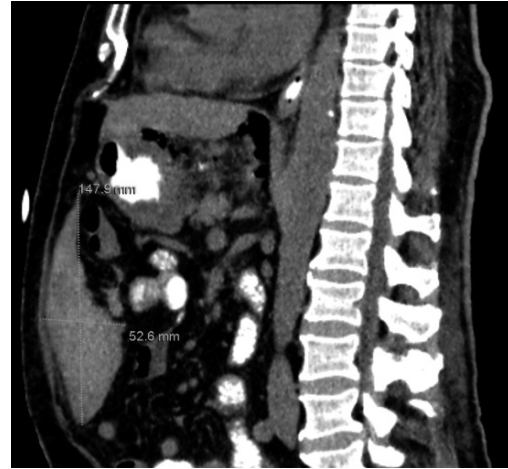
2 pav. Kompiuterinės tomografijos vaizdas: epigastriumo srityje matomas prigludantis prie priekinės pilvo sienos, hipoechogeninis, heterogeninis, su pertvaromis bei hiperechogeniniais intarpais 14,8 cm ilgio ir 5,3 cm pločio darinys, būdingas hematoma