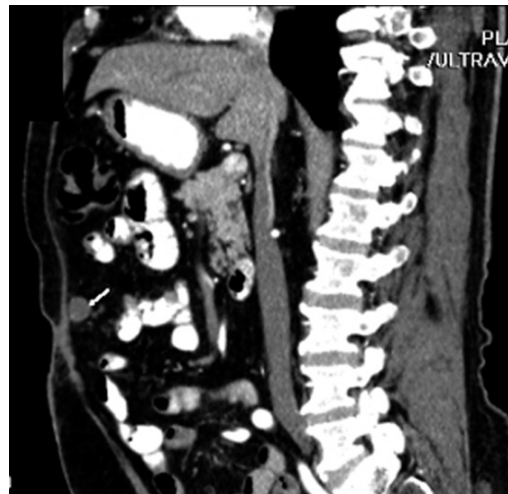
4 pav. Kompiuterinės tomografijos vaizdas: būklė po pilvo sienos hematomos ir bursa omentalis pūlinio drenavimo. Rodykle pažymėta organizuota sanaupta ties priekine pilvo siena

sienos hematoma drenuota 12 Fr drenu, kontroliuojant procedūrą ultragarsu. Bursa omentalis pūlinys drenuotas endoskopinės procedūros metu per užpakalinę skrandžio sieną į jo ertmę įkišus du 7 Fr drenus. Normalizavosi temperatūra, kraujo tyrimų rodikliai, pacientas pradėjo normaliai valgyti. Geros būklės išrašytas į namus 35-ą hospitalizacijos dieną. Stebėtas ambulatoriškai, kom-