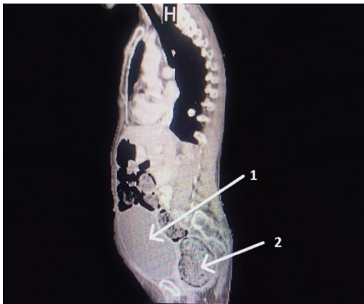
Paveikslas 1. 1 – perpildyta šlapimo pūslė; 2 – 10 cm skersmens tiesioji žarna.

žarnyno peristaltika. Įtariant žarnyno obstrukciją ir ūmią chirurginę patologiją, pacientę skubios pagalvos skyriuje konsultavo gydytojas chirurgas. Atlikus apžvalginę pilvo rentgenogramą, laisvo oro po diafragmos kupolais stebėta nebuvo. Rektalinio – digitalinio tyrimo metu čiupėsi išplėsta tiesiosios žarnos ampulė, kuri buvo pilna molio konsistencijos išmatų, kurios kiek pavyko pašalintos ranka.