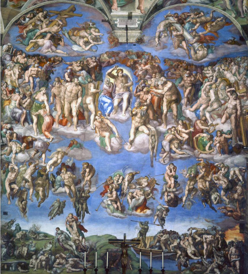
Fig. 5: Michelangelo Buonarroti, Paskutinis teismas , freska, 1536–1541, Vatikanas: Šv. Siksto koplyčia.