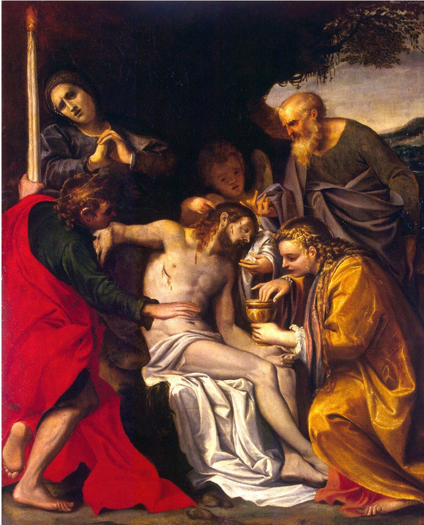
Fig. 1: Agostino Carracci, Kristaus apraudojimas , aliejus ant drobès, ~1586, Sankt Peterburgas: Ermitažas.