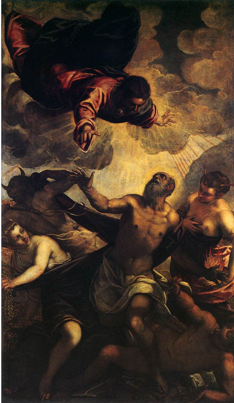
Fig. 4: Jacopo Tintoretto, Šv. Antano gundymas , aliejus ant drobès, 1577, Venecija: San Trovaso.