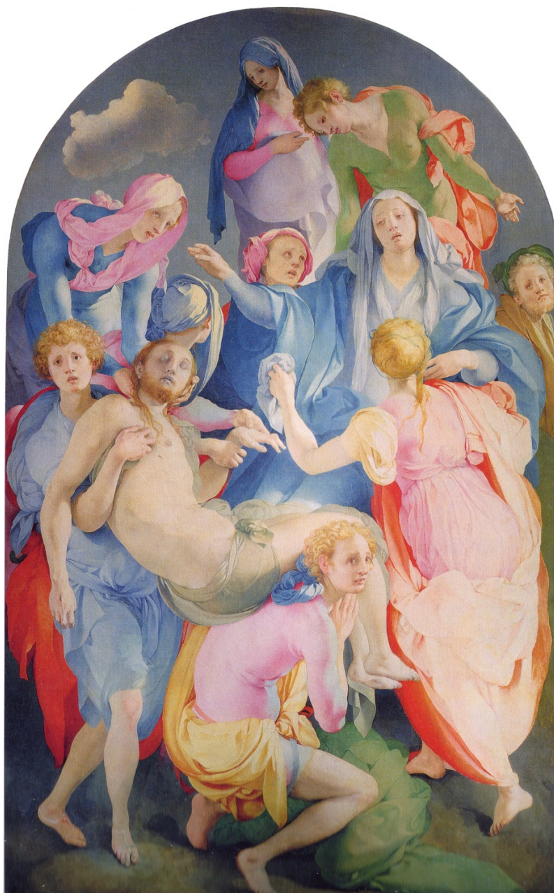
Fig. 6: Jacopo Pontormo, Nuėmimas nuo kryžiaus , aliejus ant medžio, 1525–1528, Florencija: Santa Felicita.