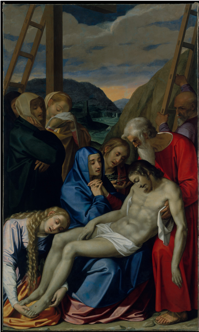
Fig. 2: Scipione Pulzonès (Il Gaetano), Apraudojimas , aliejus ant drobès, 1593, Niujorkas: The Metropolitan Museum of Art.