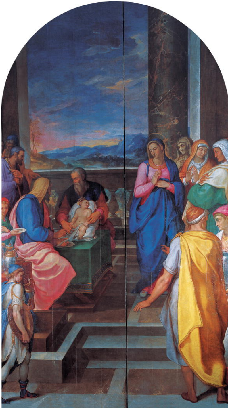
Fig. 3: Girolamo Muziano, Kristaus apipjaustymas , aliejus ant medžio, 1587–1589, Roma: Il Gesù.