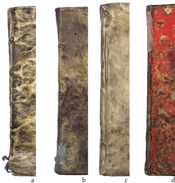
5 PAV. Pergamentinių viršelių jungties būdai: a – perverti ryšių ir kaptalų šerdžių galai; b – perverti tik ryšių galai; c – perverti tik kaptalų šerdžių galai; d – neperverti nei ryšių, nei kaptalų šerdžių galai