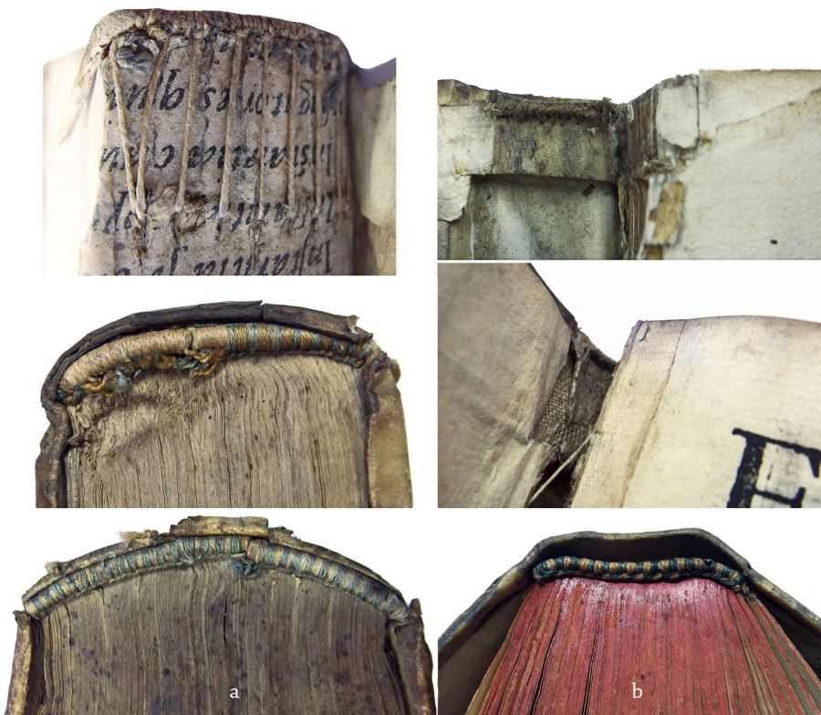
3 PAV. Kaptalų tipai: a – į bloką įpinti kaptalai (viduryje – antrinio kaptalo atvejis); b – prie bloko priklijuoti kaptalai

būdų jas pagreitinti 67 . Vis dėlto siuvant didelio formato knygos lankus naudoti net 4 ar 5 siuvimo procesą sulėtinantys virviniai ryšiai. Viena vertus, visų septynių knygų bloko kraštai apipjauti paliekant vadinamųjų „įrodymų“, žyminčių, kad knygrišys darbą atliko kokybiškai ir spaudinio paraštes sumažino ne daugiau, nei reikia 68 . Kita vertus, šių knygų bloko kraštai – be dekoro. Didesnei daliai įrišų būdingas ne priklijuotas, o laikui imlesnis į bloką įpintas kaptalas 69 (žr. 3a pav.).