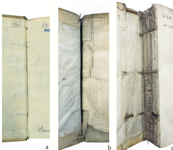
4 PAV. Bloko jungties su viršeliu variantai: a – perverti pergamentiniai ryšiai; b – virviniai ryšiai nupjautais galais ir skersinių bloko nugarėlę tvirtinančių juostelių galai; c – nupjauti virvinių ryšių galai