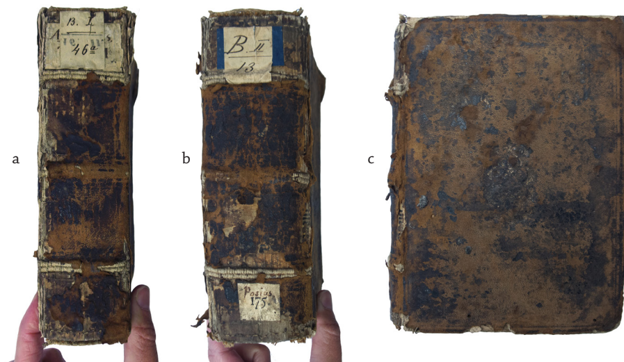
1 PAV. Identiški odiniai įrišai. a – BAV 32.7.8 (t. 8) nugarėlė; b–c – BAV 70.5.18 nugarėlė ir viršutinis kietviršis.

Pastaba: visose iliustracijose panaudoti Vilniaus universiteto bibliotekoje saugomų dokumentų vaizdai ar jų fragmentai.