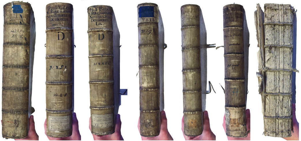
2 PAV. Kietųjų pergamentinių įrišų nugarėlės su suformuotais ryšiais

lieka apsauginę funkciją. Nepaisant šių dirbinių išorinio paprastumo, jų konstrukcijos pasižymi tam tikra įvairove. Nagrinėtus Vilniaus jėzuitų akademijos bibliotekos rinkinio pergamentinius įrišus galima skirstyti į du pagrindinius tipus: įrišus suformuotais ryšiais ir įrišus pervertais viršeliais. Pastarieji, savo ruožtu, gali būti skirstomi į kietuosius, puskiečius ir minkštuosius.