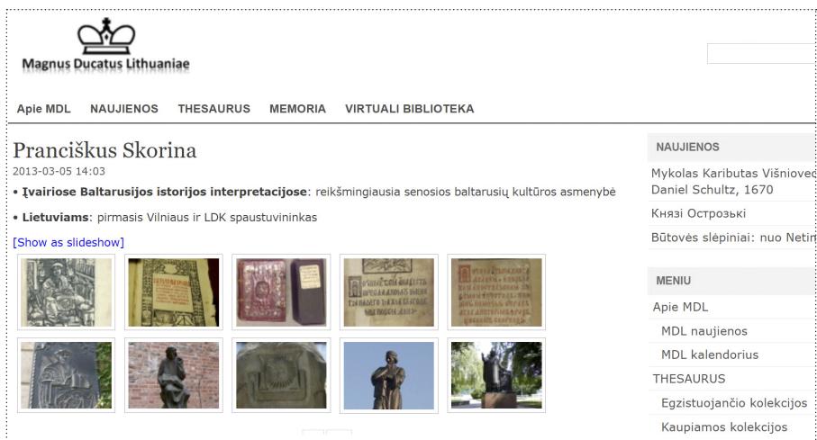
5 PAV. Projekto „Magnus Ducatus Lithuaniae“ ekrano nuotrauka

visuomenės istorinę savimone, pamatyti joje galimai slypinčius stereotipus, pateikiamos P. Skorinos interpretacijos Baltarusijos ir Lietuvos istorijos naratyvuose, išryškinant jo suvokimą kaip baltarusių kultūros asmenybę ir pirmąjį Vilniaus ir LDK spaustuvinką. O alternatyviems naratyvams P. Skorina yra „ne tik polockietis, ne tik Vilniaus, bet ir LDK kultūros fenomenas Prahoje“ 42 . Istorinės atminties akademijos ir Vilniaus universiteto Istorijos fakulteto projekto „Magnus Ducatus Lithuaniae“, kuris glaudžiai siejasi su anksčiau minėtu projektu, svetainėje 43 taip pat galime rasti istorinės kultūros tyrinėtojų siūlomų P. Skorinos suvokimo interpretacijų (žr. 5 pav.).