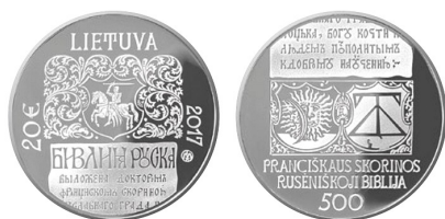
20 eurų moneta, skirta Pranciškaus Skorinos „RuseŅiskosios Biblijos“ 500-mečiui

Monetos briaunoje: PRAHA 1517 Monetos dailininkas Rolandas Rimkūnas