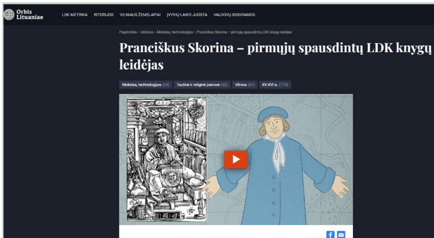
6 PAV. Svetainės „Orbis Lituaniae“ ekrano nuotrauka