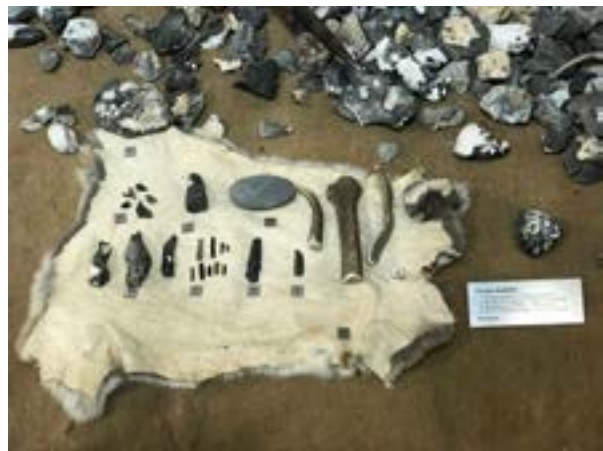
12 iliustracija. Panevėžio krašto tyros muziejaus ekspozicija, artefaktų integravimas į rekonstruotą aplinką. 2022.