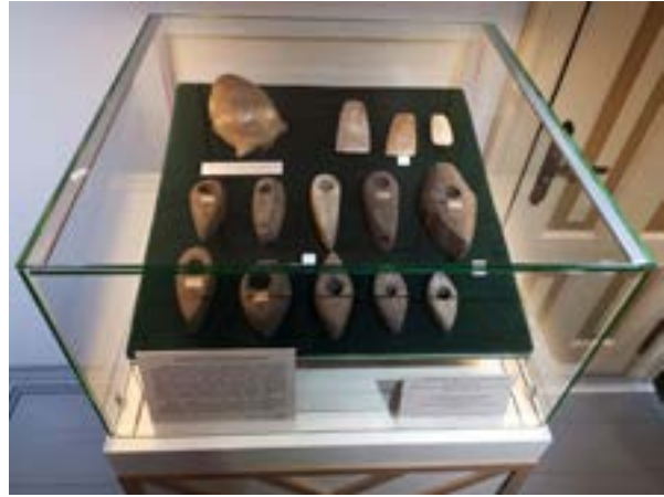
6 iliustracija. Šilutės Hugo Šojaus muziejus. Akmens amžiaus ekspozicijos dalis. 2021.