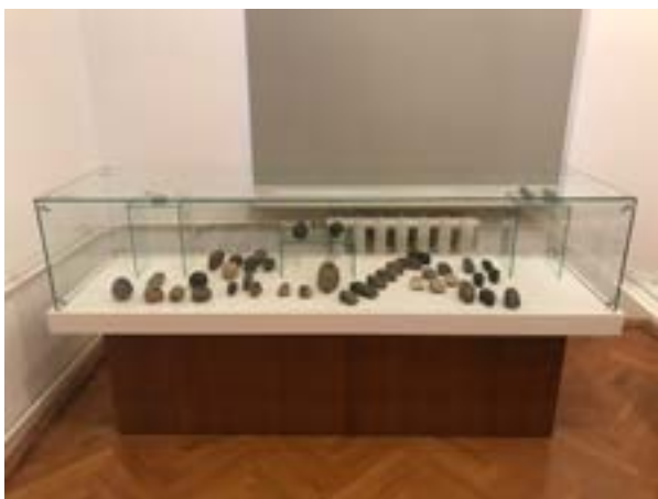
3 iliustracija. Kėdainių krašto muziejus. Akmens amžiaus ekspozicijos dalis. 2021.

Kitas aptariamų ekspozicijų bruožas – konstruojamas neutralus santykis su praeitimi. Praeities artefaktai nėra interpretuojami ar vertinami, o ekspozicijų turinys daugiausia paremtas tradicinėmis akademinėmis žiniomis. Pastebėta, kad akmens amžius beveik visose ekspozicijose pristatomas identišškai, o pagrindiniai šio laikotarpio eksponatai – kirvukai ir titnago dirbiniai (žr. 3, 4, 5, 6 iliustracijas).