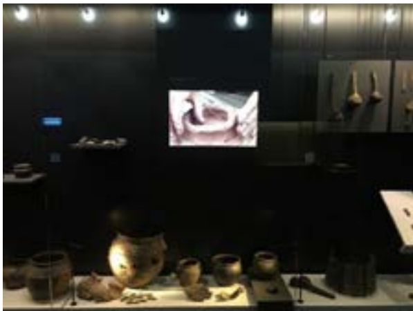
9 iliustracija. Kernavės archeologinės vietovės muziejus, vaizdo medžiagos pritaikymas. 2022.

Ukmergės krašto tyros muziejaus ekspozicija yra viena iš nedaugelio, kuriose atskleidžiami laidojimo papročių skirtumai. Tam pasitelkiami rekonstruoti griautiniai ir degintiniai kapai. Aptariant laidojimo papročius plačiau analizuojama įkapių reikšmė (kitose ekspozicijose tai nepabrėžta, pateikta kaip savaimė suprantamas dalykas). Išskiriami ne tik laidosenos, bet ir įkapių skirtumai (galima palyginti vyro, moters ir net žirgo įkapes).