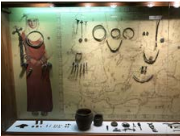
7 iliustracija. MLIM ekspozicija, žmogaus grafinio vaizdavimo pavyzdys. 2022.