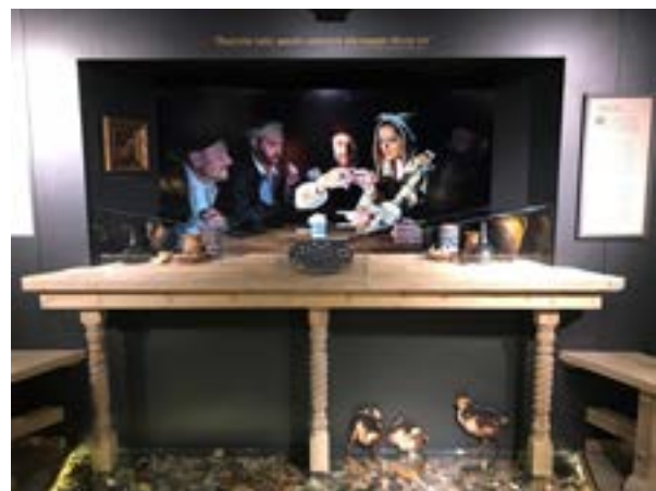
15 iliustracija. Klaipėdos ekspozicija „Kurtina“. Rekonstruota užeiga. 2022.