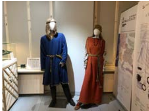
8 iliustracija. Šilutės Hugo Šojaus muziejaus ekspozicija, geležies amžiaus žmonių rekonstrukcijos. 2021.