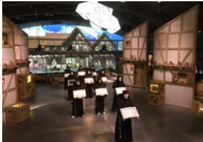
13 iliustracija. Klaipėdos ekspozicija „Kurtina“, antros salės dizainas. 2022.

Trečiai tirtų archeologijos ekspozicijų grupei priskiriamos vadinamosios naujosios koncepcijos ekspozicijos. Jos atitinka naujosios koncepcijos muziejaus ypatybes (orientuojamasi į pažinimo procesą; informaciją siekiama pateikti taip, kad būtų suprantama visiems; atspindimi kasdienio gyvenimo ypatumai; pasakojama ne tik apie praeitį, bet iš dalies ir apie dabartį) ir yra pagrįstos pagrindiniais archeologinio paveldo eksponavimo principais (dėmesys kontekstui, materialinių liekanų analizei ir praeities individui). Iš 30-ies šiame tyrime analizuojamų archeologijos ekspozicijų naujosios koncepcijos grupei galima priskirti tik vieną – archeologijos ekspoziciją „Kurtina“. Ji atidaryta 2021 m. rugpjūčio 1 d. kaip Mažosios Lietuvos istorijos muziejaus padalinys, atsiradus poreikiui pristatyti viduramžių ir naujųjų laikų Klaipėdos istoriją. Naujosios ekspozicijos erdvė išties didelė – 1500 kv. m įkurtos dvi salės 57 . „Kurtinos“ ekspozicijos naujumą pirmiausia atspindi estetinė eksponavimo prieiga. Skirtingas abiejų salių dizainas ir apšvietimas sukuria tarsi persikėlimo iš vieno laikotarpio į kitą jausmą. Pirma salė išsiskiria šviesiais, pasteliniiais atspalviais. Antra – visai kitokia, joje dominuoja tamsios spalvos, ekspozicija imituoja XVI a. pradžios – XVIII a. pabaigos Klaipėdos miestą (žr. 13 iliustraciją). Žinoma, tokį reprezentatyvumą lėmė ir galimybė didelėse patalpose įrengti visiškai naują ekspoziciją.