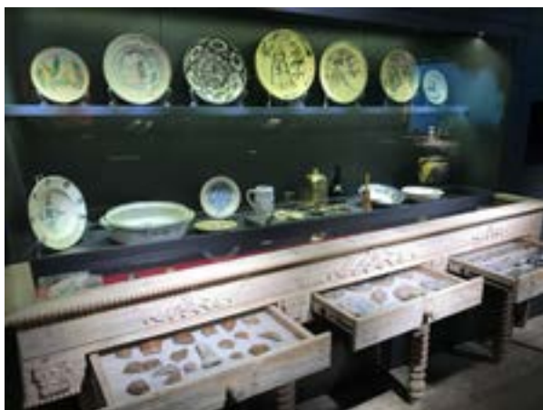
14 iliustracija. Klaipėdos ekspozicija „Kurtina“. Indaujoje eksponuojami artefaktai. 2022.

Tradicinio eksponavimo palei sienas čia atsakyta. Artefaktai išdėstyti ne tik įprastose vitrinose, bet ir įkomponuoti į pirmines aplinkas. Pavyzdžiui, serviravimo indai tvarkingai sudėti medinėje indaujoje (žr. 14 iliustraciją). Užeigos kasdienybę atspindinys artefaktai (bokalai, pypkės, lėkštės) eksponuojami ant stalo, o kitoje jo pusėje sėdi hologramos būdu atkurti užeigos lankytojai. Grindyse po stalu įmontuotoje dar vienoje vitrinoje – archeologiniai radiniai: keramikos ir stiklo šukės, monetos, gyvulių kaulai ir kt. (žr. 15 iliustraciją). Tokia eksponavimo prieiga ne tik atspindi to meto požiūrį į tvarką, bet ir nebyliai liudija, kad archeologų randamos materialinės liekanos yra tik praeities žmonių išmesti ar netyčia prarasti daiktai.