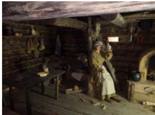
10 iliustracija. Kernavės archeologinės vietovės muziejus, viduramžių būsto rekonstrukcija. 2022.