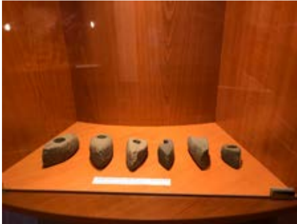
5 iliustracija. Tauragės krašto muziejaus Archeologijos bokštas. Akmens amžiaus ekspozicijos dalis. 2022.