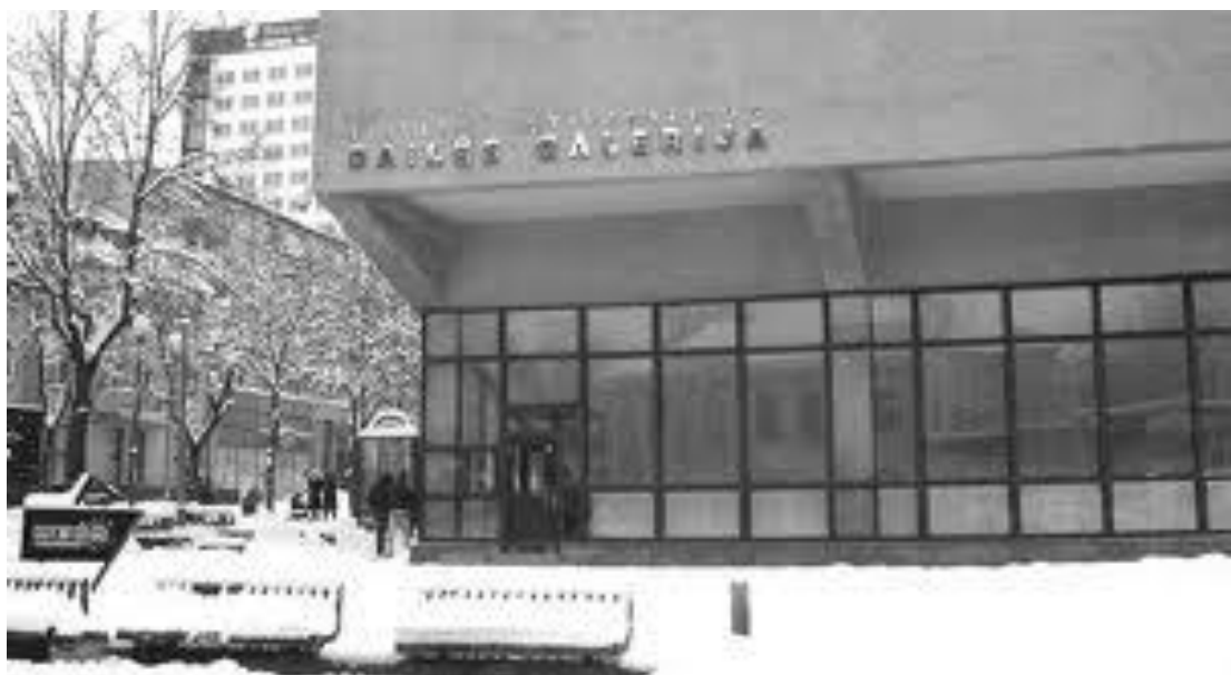
10 paveikslas. Šiaulių universiteto dailės galerija