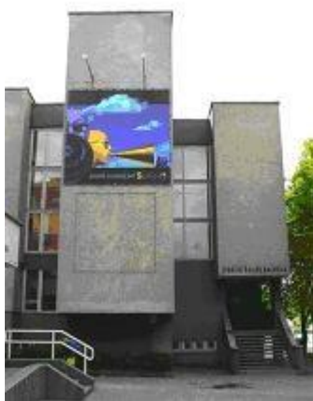
8 paveikslas. Šiaulių dailės galerija

Šiaulių Dailės galerija (8 pav.) neabejotinai yra vienas didžiausių ir svarbiausių vaizduojamojo meno centrų Šiaurės Lietuvoje. Čia rengiamos ne tik miesto ir šalies dailininkų, bet ir užsienio menininkų vaizduojamojo meno parodos. Galerijoje taip pat vykdomos ir įvairios edukacinės programos, skaitomi paskaitų ciklai, vyksta konferencijos bei seminarai. Kadangi galerija siekia būti atvira įvairioms meno rūšims, čia ir vyksta įvairūs teminiai eksperimentinės, elektroninės, džiazo, klasikinės muzikos renginiai. 148