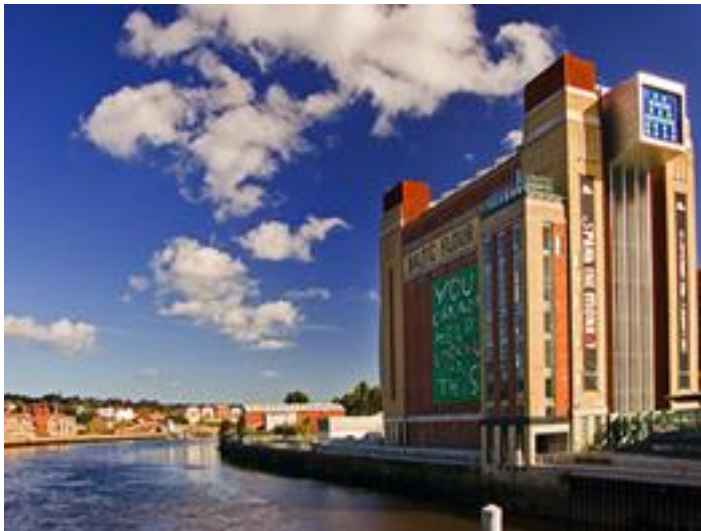
1 paveikslas. „BALTIC“ galerija Newcastle

Pirmoji galerija, apie kurią tikslinga kalbėti yra Didžiojoje Britanijoje gyvuojanti galerija „BALTIC“ (1 pav.). (Iš pirmo žvilgsnio neadekvatu būtų lyginti Lietuvos, juolab Šiaulių miesto galerijas su Didžiosios Britanijos, tačiau tokia nuostata klaidinga. Šio lyginimo galimybė atsiranda tada, kai suvokiamas faktas, jog galerija „BALTIC“ yra įsikūrusi mažame Newcastle miestelyje, kuris Didžiajai Britanijai yra žymiai menkesnis, nei Šiauliai Lietuvai). Šis didžiulis meno centras įkurtas sename pramoniniame pastate, pietiniame Tyne upės krante, Gateshead'e. Tai didžiulis tarptautinis šiuolaikinio meno centras. Jame nėra jokios nuolatinės meno kolekcijos parodos. Centro esmė – nuolat kintančios, pagal grafiką eksponuojamos dinamiškos parodos. Galerijoje eksponuojami įvairiausių menininkų darbai: nuo žymiausių šiuolaikinių menininkų, iki menininkų, kuriančių vietinėje bendruomenėje 55 .