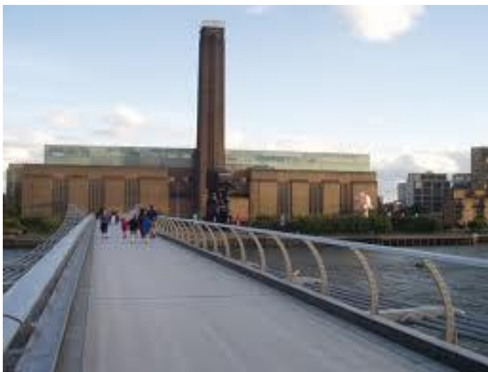
2 paveikslas. „Tate Modern“ galerija Londone