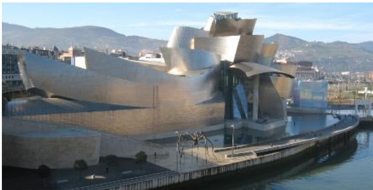
6 paveikslas. „Guggenheim“ muziejus Bilbao

svarbiausių šalies uostamiesčių. 101 J. Kraniauskaitė straipsnyje „Gugenheimo muziejus, arba naujasis Bilbao veidas“ rašo, jog tai buvo pramoninis gigantas, nuobodus ir pilkas uostamiestis, kurio vengdavo visi turistai. Tačiau iškilus šiam muziejaus padaliniui, miestas atgijo. „Guggenheim Bilbao“ lyginamas net gi su Paryžiaus Eifelio bokštu ar Sidnėjaus operos pastatu. Pastatas tituluojamas XX a. antros pusės modernios architektūros stebuklu. „Per pirmuosius savo gyvenimo metus sulaukęs vieno milijono trijų šimtų tūkstančių lankytojų, Bilbao Gugenheimo muziejus jau tapo šio miesto atgimimo simboliu“. 102