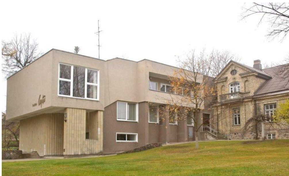
9 paveikslas. „Laiptų galerija“

Parodinę veiklą ši įstaiga pagrindine savo veiklos sritimi pasirinko 1992 metais ir įkūrė „Laiptų galeriją“ (9 pav.). Per metus čia surengiama apie 30 profesionalaus meno parodų, kurias