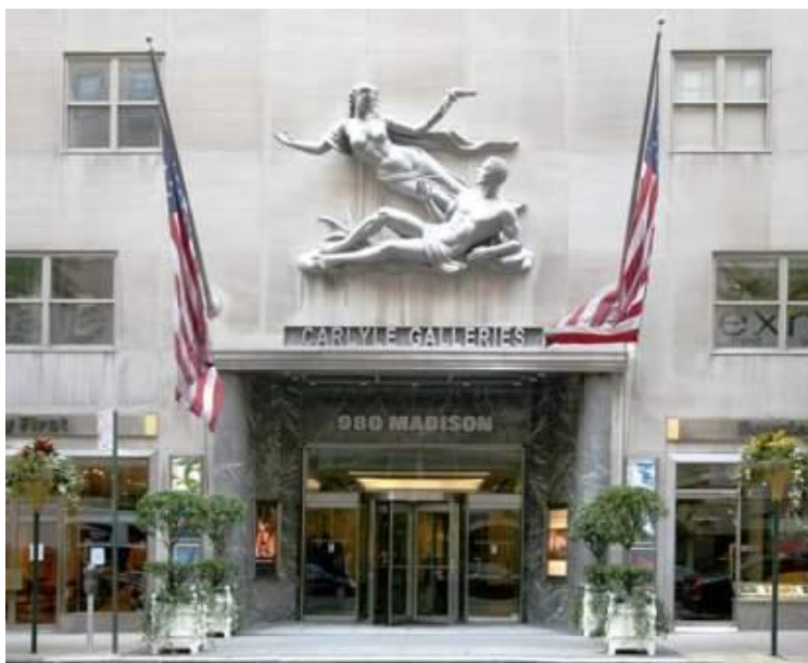
4 paveikslas. „Gagosian“ galerija New York‘e