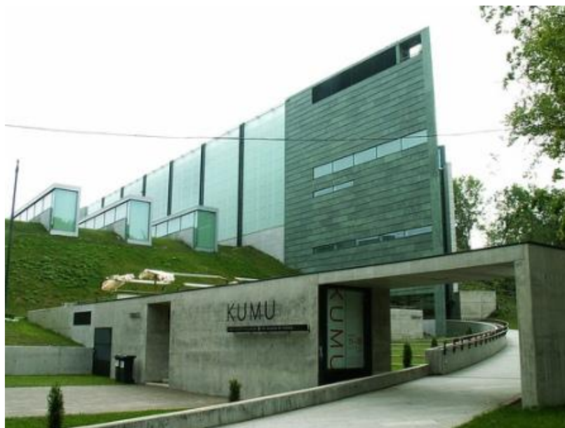
3 paveikslas. „Kumu“ meno muziejus Estijoje

(Pav. šaltinis http://www.flickr.com/photos/20792787@N00/339667821/ )