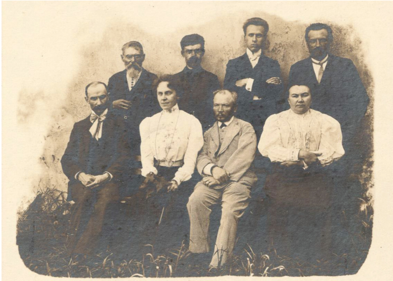
13 iliustracija. P. 11. „Personalas“.