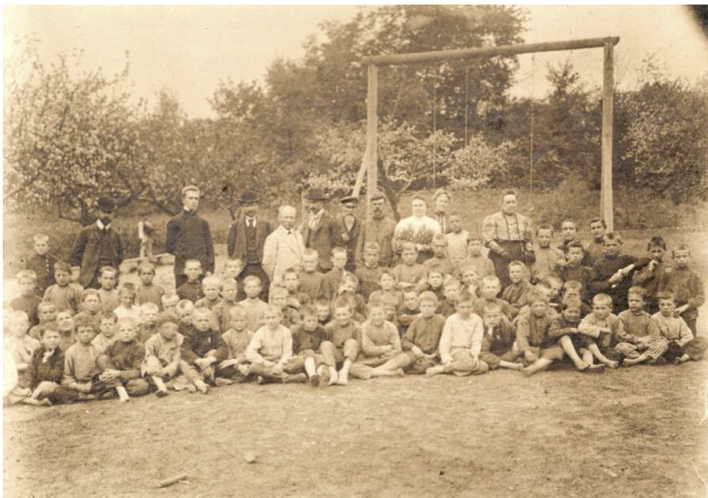
12 iliustracija. P. 10. „Grupė sode“.