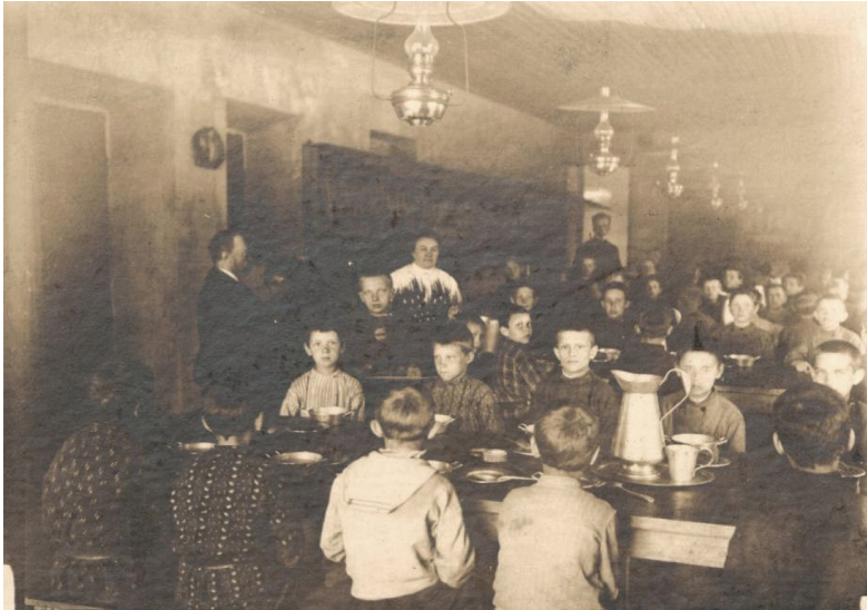
11 iliustracija. P. 9. „Valgomajame“.