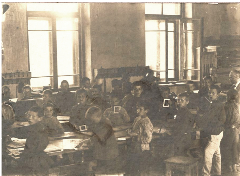
6 iliustracija. P. 4. „Knygrišystės dirbtuvėse“.