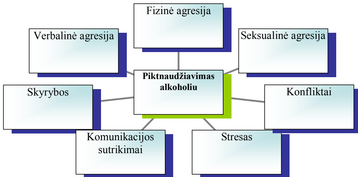
1. pav. Dažniausios pasekmės šeimoje, kurioje yra piktnaudžiuojama alkoholiu