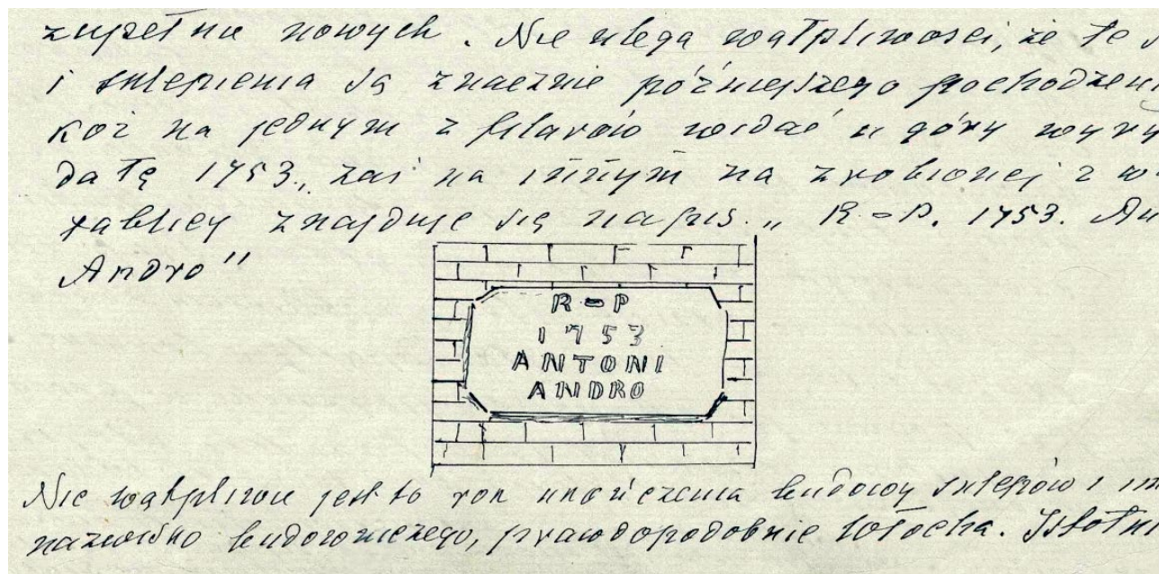
2. Rys. sygnatury murarza, prawdopodobnie Antoniego Andro, aktywnego w poł. XVIII w. w podziemiach kościoła Dominikanów pw. Świętego Ducha w Wilnie, fragm. rękopisu Wł. Zahorskiego, 1906 r.