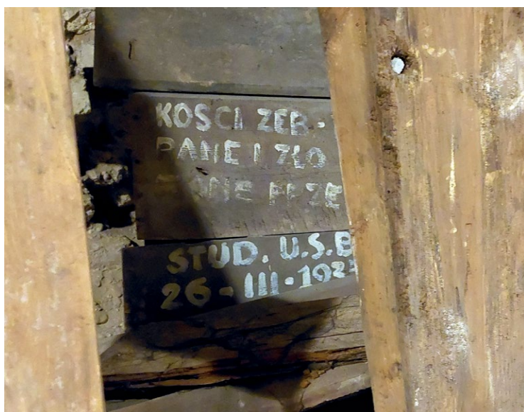
3. Fragm. drewnianych trumien z podziemi kościoła Dominikanów pw. Świętego Ducha oznaczonych przez wileńskich studentów w 1934 r. Fot. A.S. Czyż, 2023 r.

Ostatni przegląd archeologiczny w podziemiach miał miejsce w 2005 r. Archeolog Robertas Žukovskis odnalazł wówczas z mumifikowane ciała ludzkie i przedmioty, w tym gwoździe, ceramikę z XVIII–XIX w. oraz trumny, w tym jedną z malowanymi napisami 10 . O inskrypcjach na kamieniu czy marmurowych tablicach w raporcie archeologicznym nie ma wzmianki.