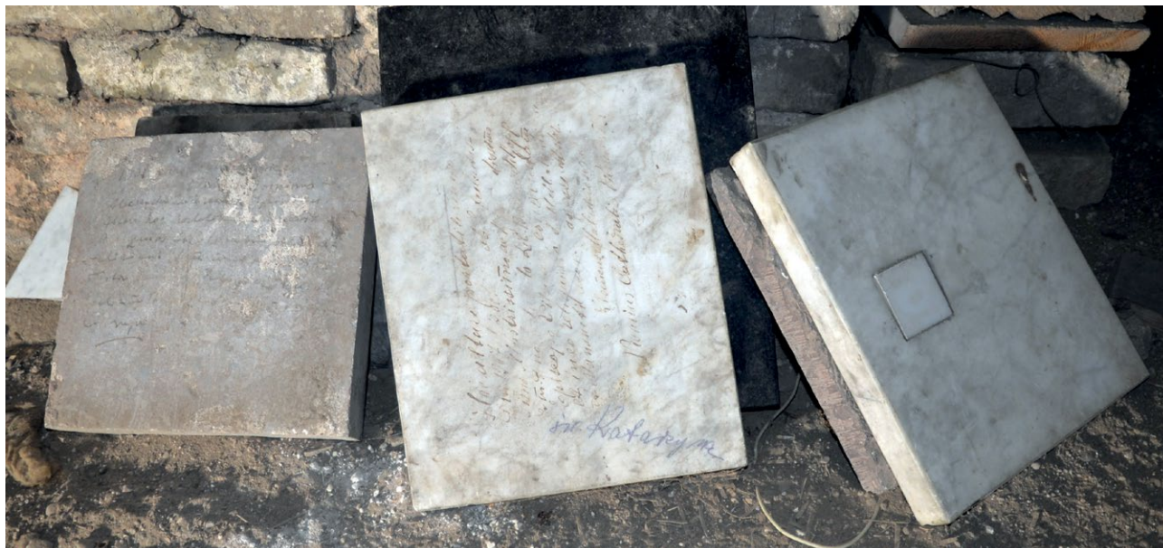
1. Portatyble w podziemiach kościoła Dominikanów pw. Świętego Ducha w Wilnie. Fot. A. S. Czyż, 2022 r.

zakonników, z podania tylko znających sklepy kościelne, po kilkodniowej pracy, odwalono kamienie zaciskające wejście, i opatrzeni pochodniami, spuściliśmy się do lochów zajmujących całą przestrzeń pod murami kościoła i częścią klasztoru 3 . Niestety, Tyszkiewicz swoje wrażenia opisał skromnie, na jednej stronie „Teki Wileńskiej”, i to dopiero po kilkunastu latach od wspomnianych wydarzeń. O żadnych inskrypcjach stamtąd nie wspominał.