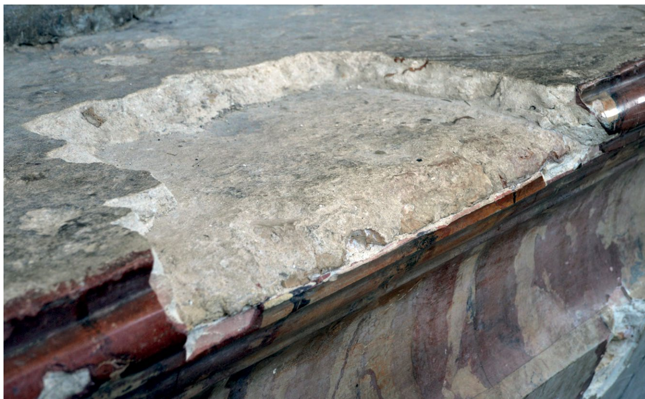
5. Miejsce po portatylu ołtarza maryjnego (tzw. Pacowskiego) w kościele pw. św. Katarzyny w Wilnie. Fot. A.S. Czyż, 2023 r.