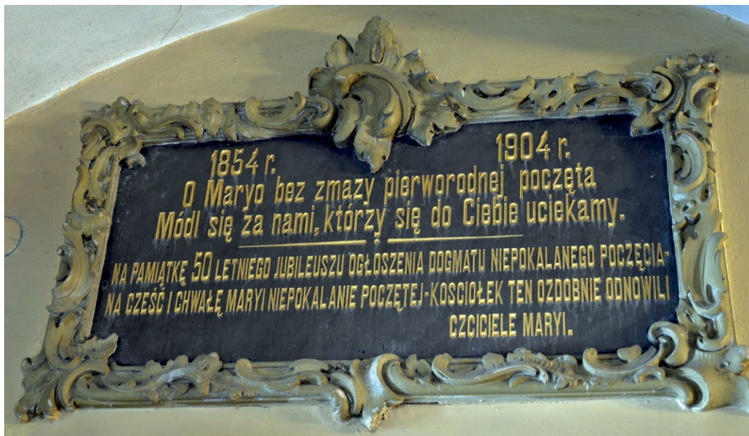
6. Tablica pamiątkowa z 1904 r. w kościele pw. Świętego Krzyża w Wilnie.

XX w. i zostały poświęcone w katedrze wileńskiej. Dwie najstarsze ( Inskrypcje 2 i 3 ), posiadające niezatarte daty, poświęcono w 1907 r. W Inskrypcji 2 widnieje nazwisko Aleksandra Zwierowicza (1842–1908), biskupa wileńskiego. Jest to nieco zaskakujące, gdyż w 1902 r. hierarcha został zesłany do Tweru przez władze carskie 12 . Pod Inskrypcją 3 widnieje nazwisko kanonika Klemensa Malukiewicza 13 , który zajmował stanowisko wikarego w katedrze wileńskiej w latach 1905–1911 14 .