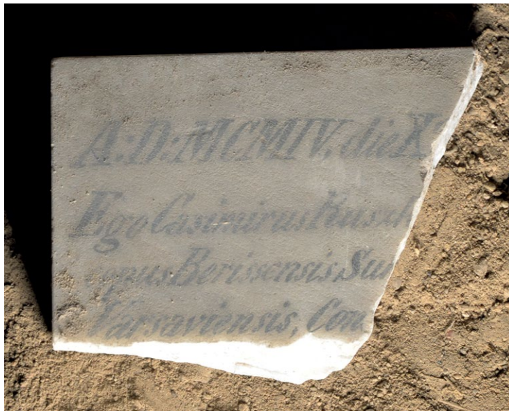
4. Portatył z Inskrypcją 1 z 1907 r. w podziemiach kościoła Dominikanów pw. Świętego Ducha w Wilnie. Fot. A.S. Czyż, 2022 r.

Treść inskrypcji przybliża okoliczności powstania poszczególnych tabliczek. Wszystkie pochodzą z pierwszej połowy