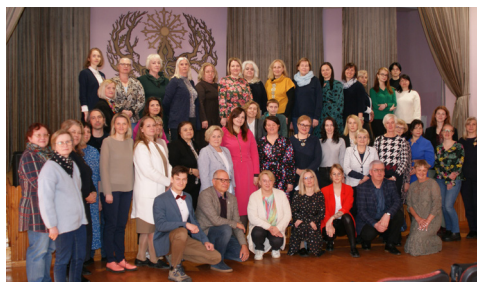
Bendra konferencijos dalyvių nuotrauka

Šios, 29-osios konferencijos darbas buvo įrašytas, todėl yra laisvai prieinamas internetiniame YouTube kanale (3 lentelė). Tai puiki galimybė norintiems bent trumpai susipažinti su konferencijos darbu, o taip pat išklausti kai kuriuos pranešimus.