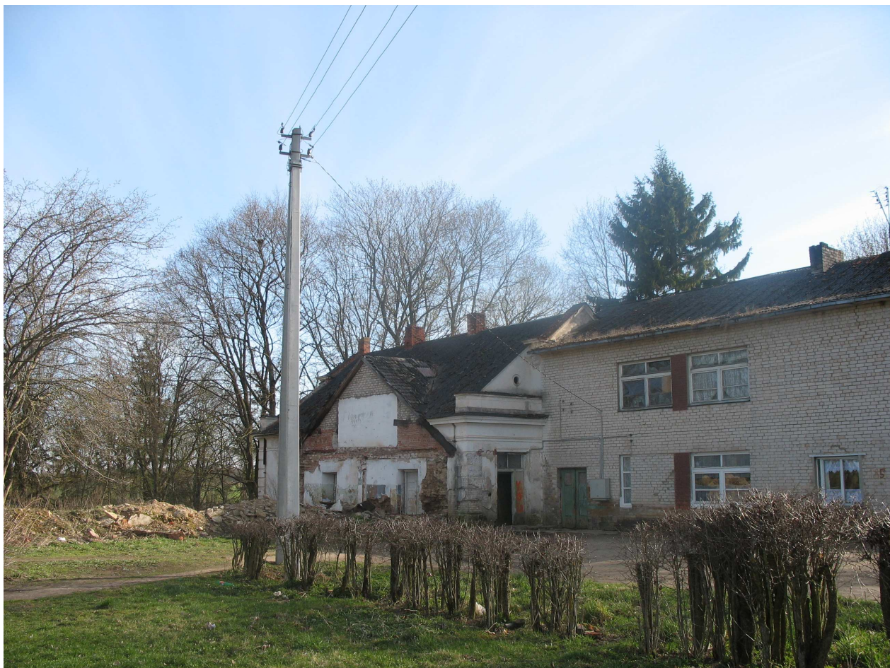
Dagilynės dvaro sodybos fragmentai. 248