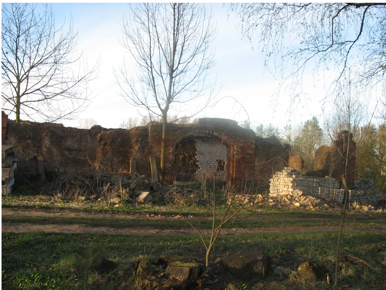
Vytartų dvaro ūkinių pastatų fragmentai. 229