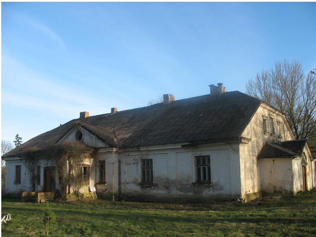
Vytartų dvaro rūmai, ŠV pusė. 228