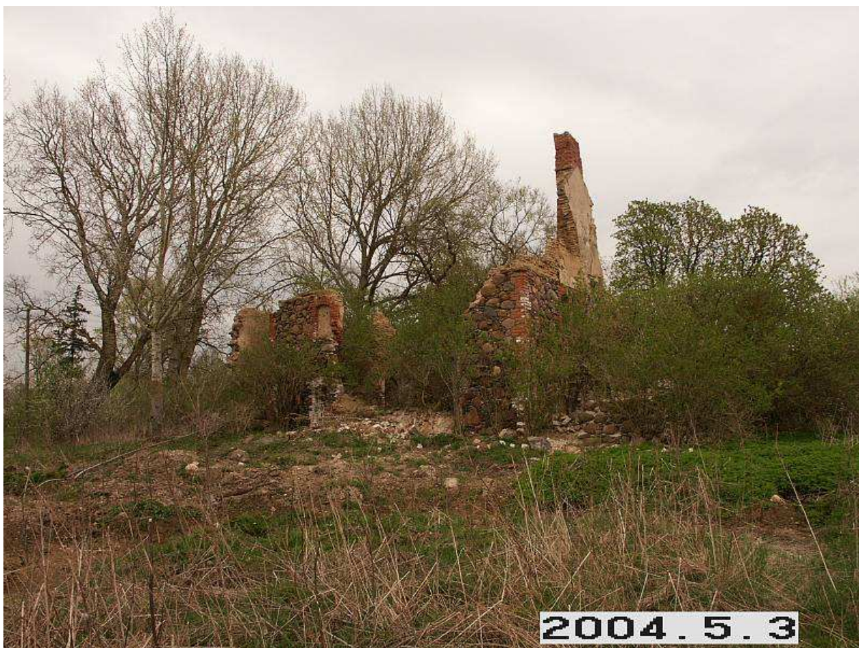
Malgūžių dvaro rūmų griuvėsiai. 225