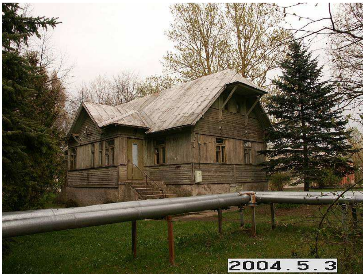
Jurdaičių dvaro sodybos gyvenamasis namas iš PV pusės. 260