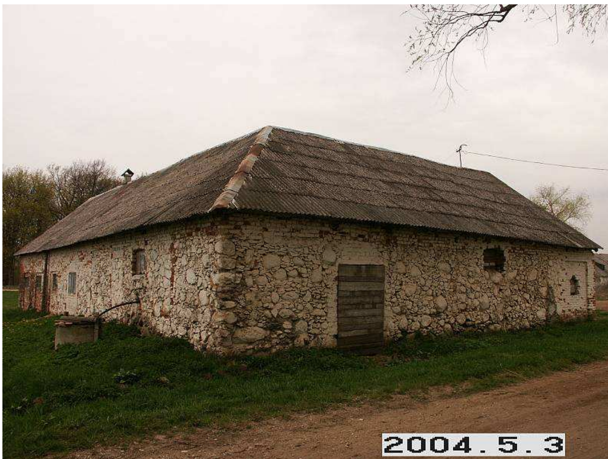
Malgūžių dvaro tvartas iš PV pusės. 227