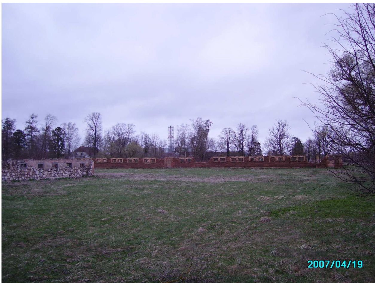
Klovainių dvaro sodybos ūkinių pastatų fragmentai. 250