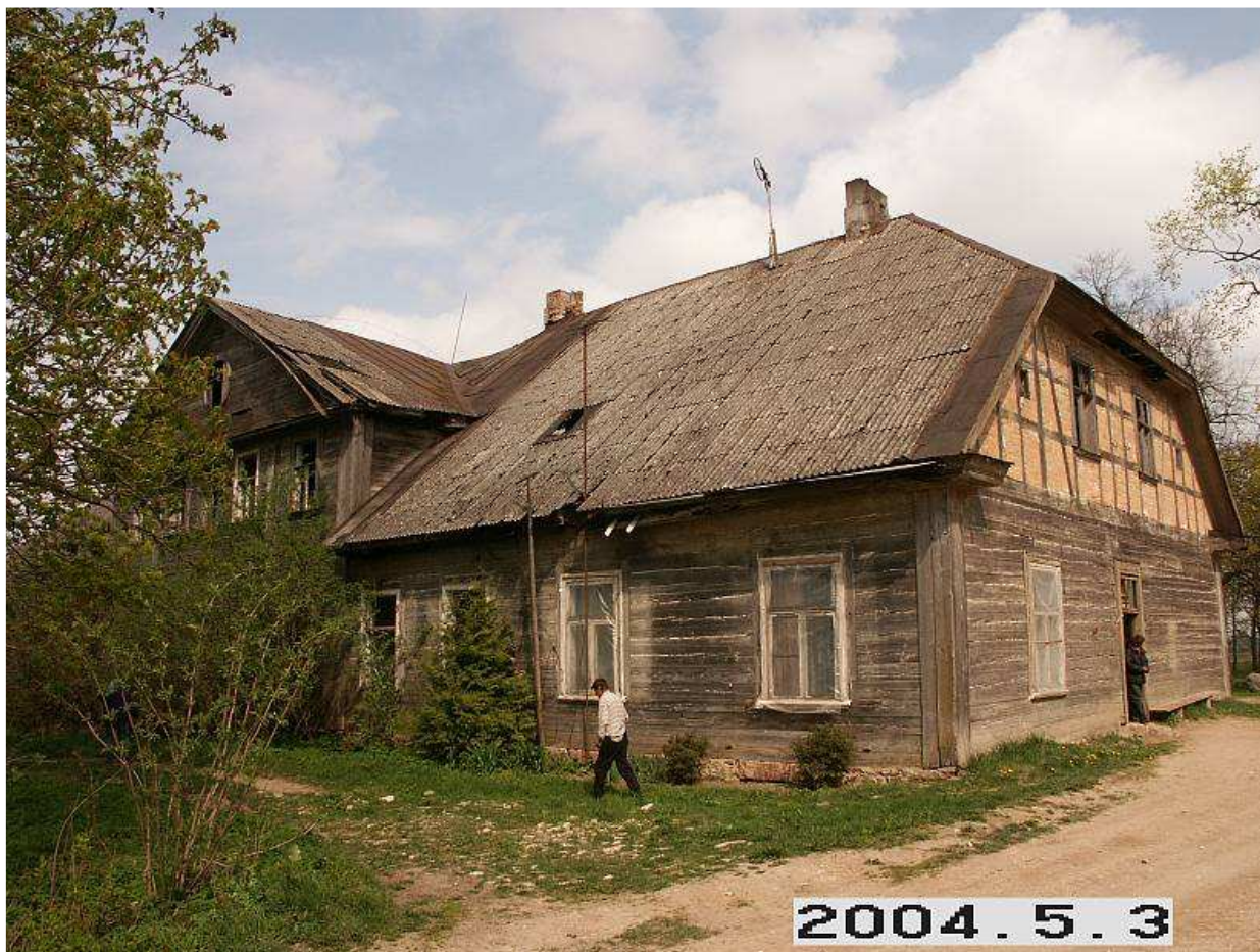
Daunoravos dvaro sodybos rūmai iš PV pusės. 218