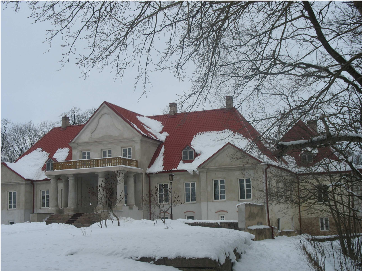
Joniškėlio senieji dvaro rūmai, . 261