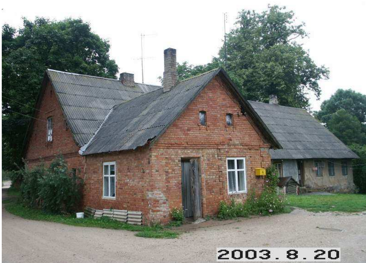
Daniūnų dvaro rūmų pastato dalis iš PV pusės. 223