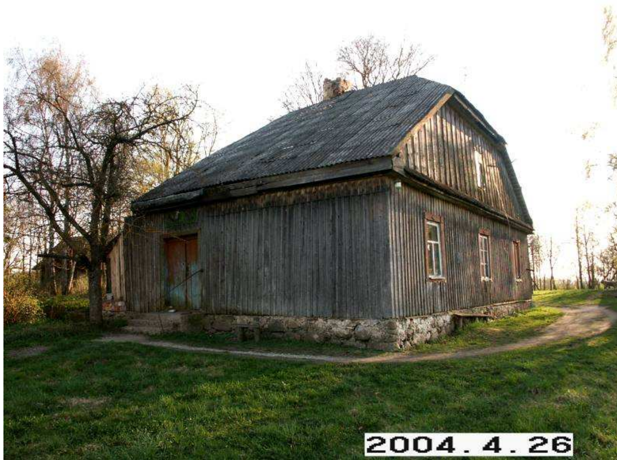
Balsių dvaro sodybos gyvenamasis namas iš ŠR pusės. 243