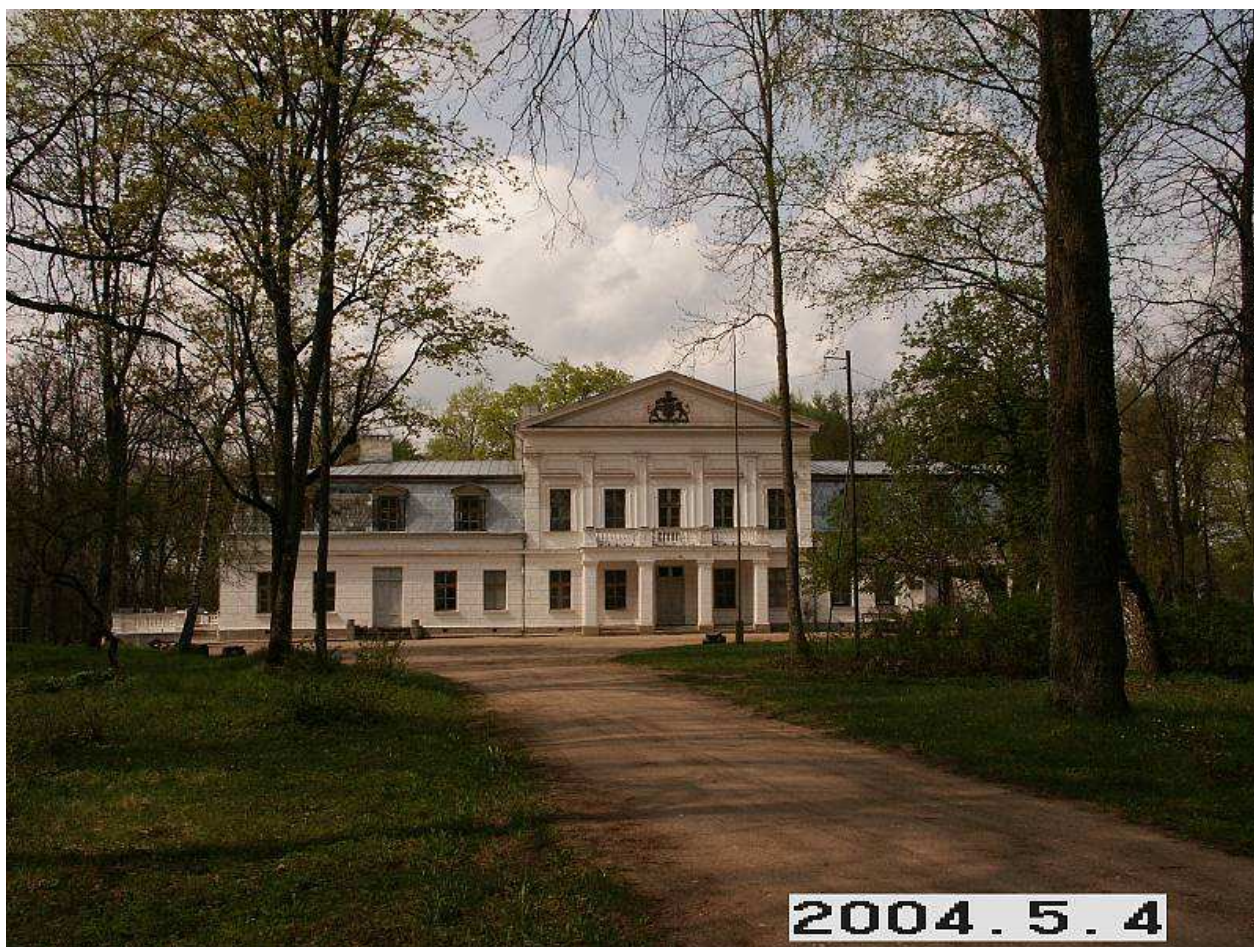
Žagarės rūmų pagrindinis fasadas iš PR pusės. 251