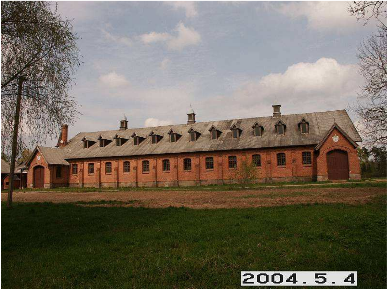
Žagarės maniežas iš PV pusės. 254