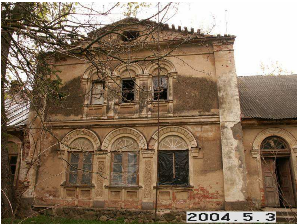
Geručiu (Glebavos) dvaro sodybos rūmai iš PV pusės. 234