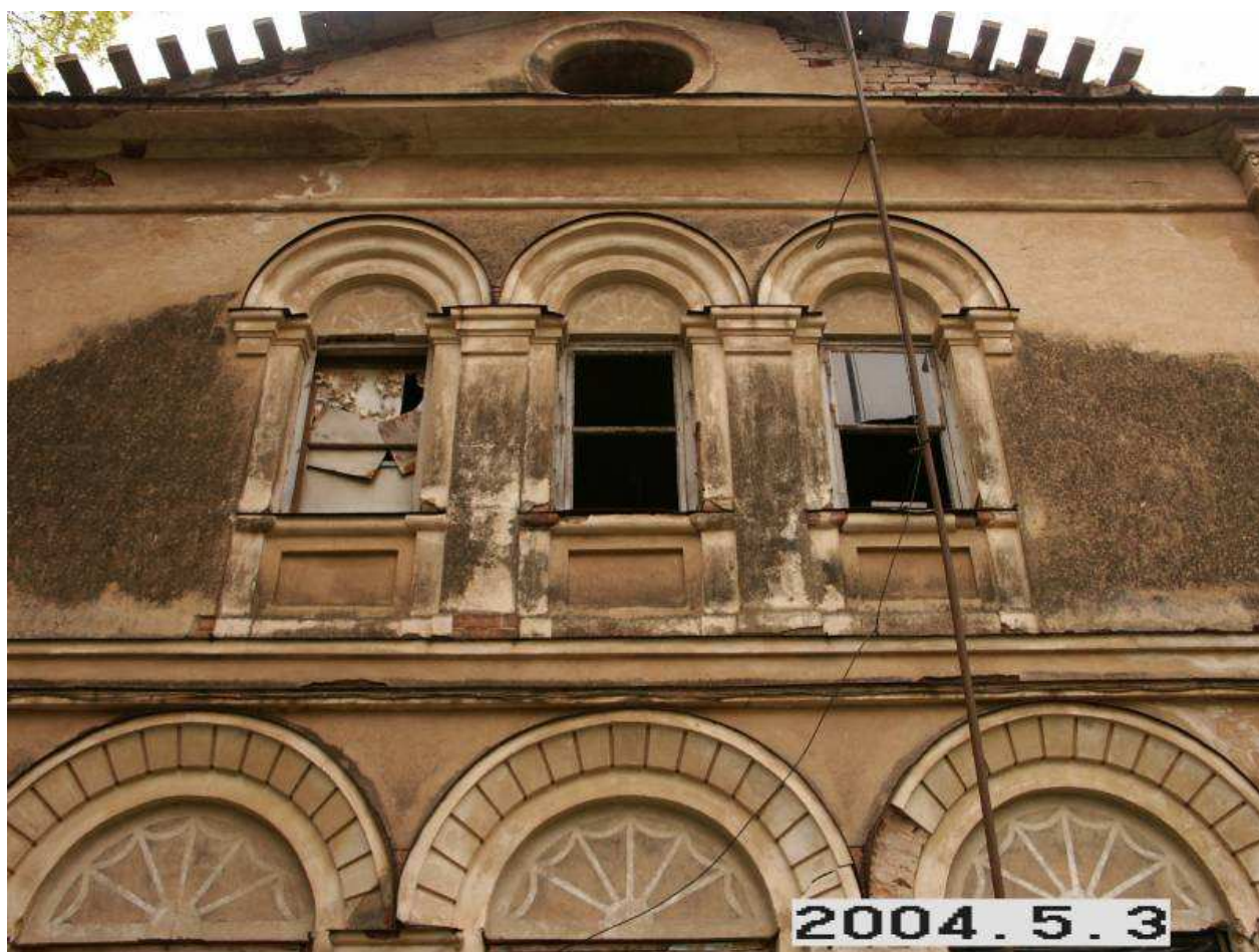
Geručių (Glebavos) dvaro rūmų V pusės fasado fragmentas. 235