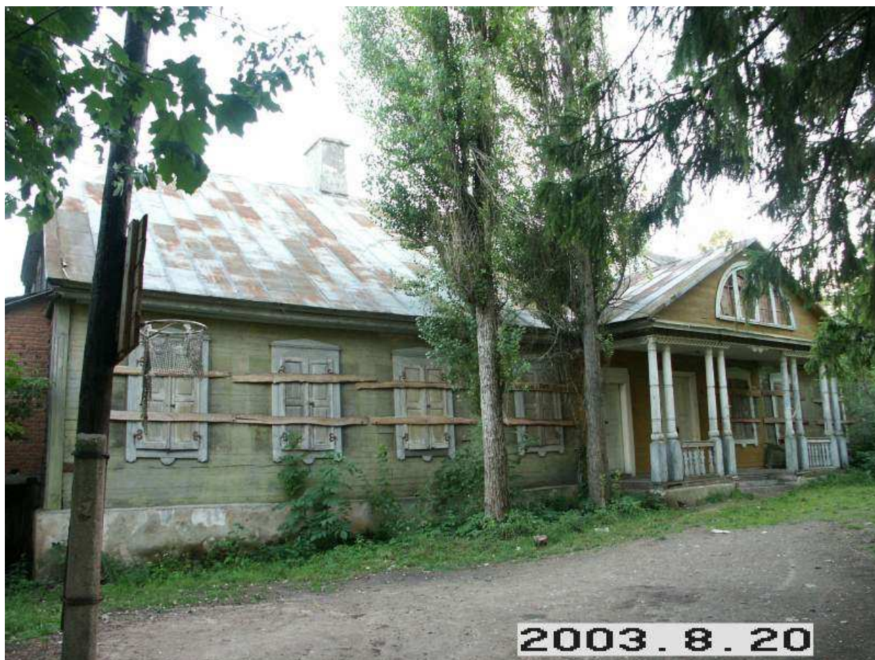
Didžiųjų Grūžių (Kalneliškio) dvaro sodybos rūmai iš ŠR pusės. 219