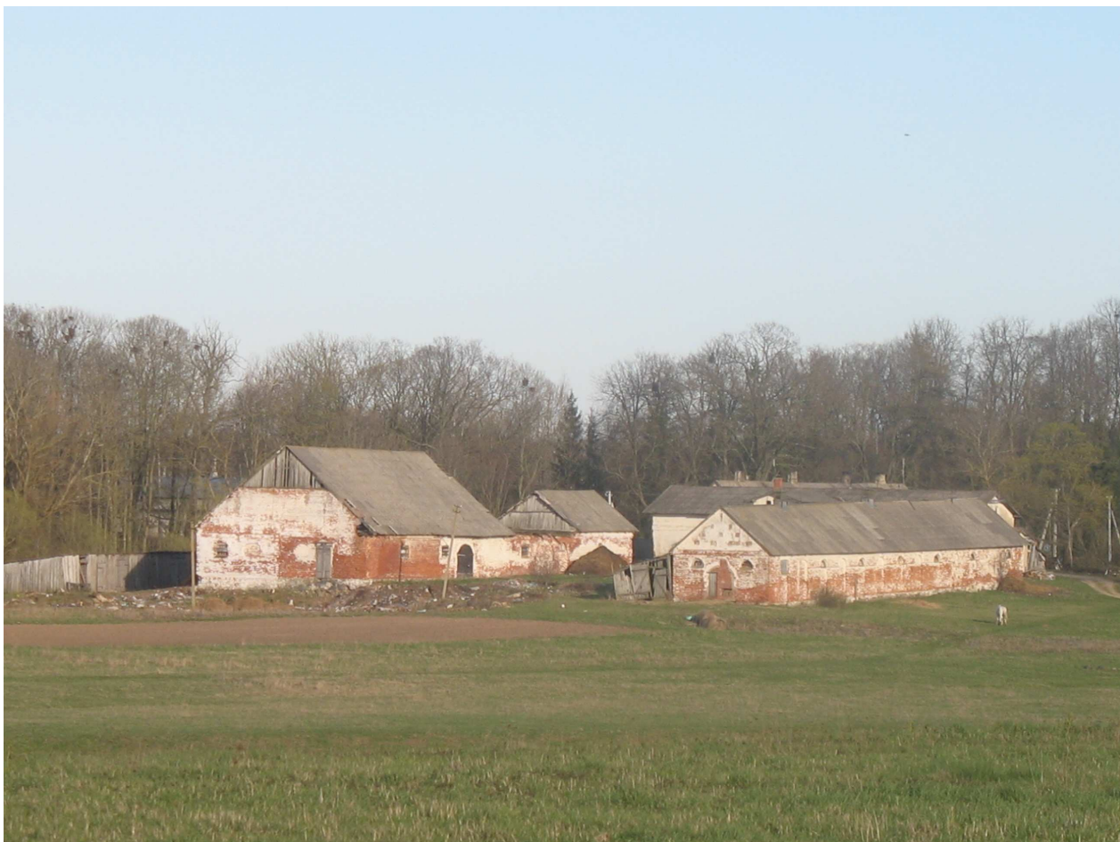
Škilinпамūšio dvaro sodybos bendras vaizdas. 245