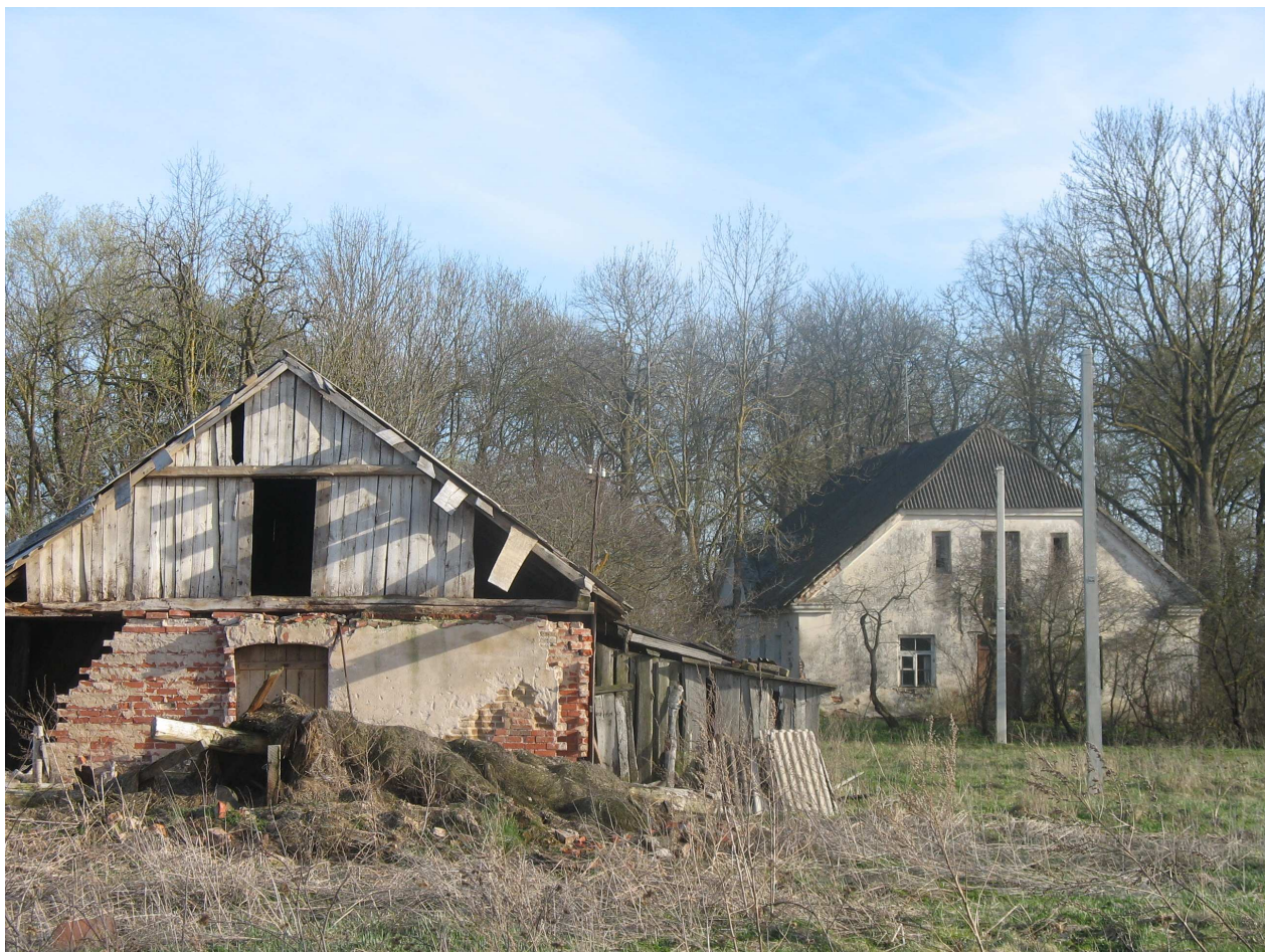
Baltpamūšio dvaro sodybos bendras vaizdas, Š pusė. 265