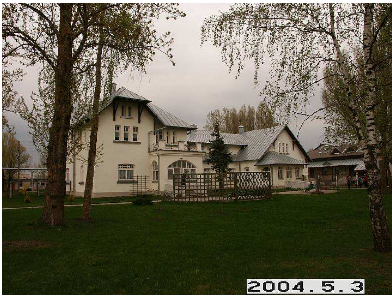
Jurdaičių dvaro rūmai iš P pusės. 259