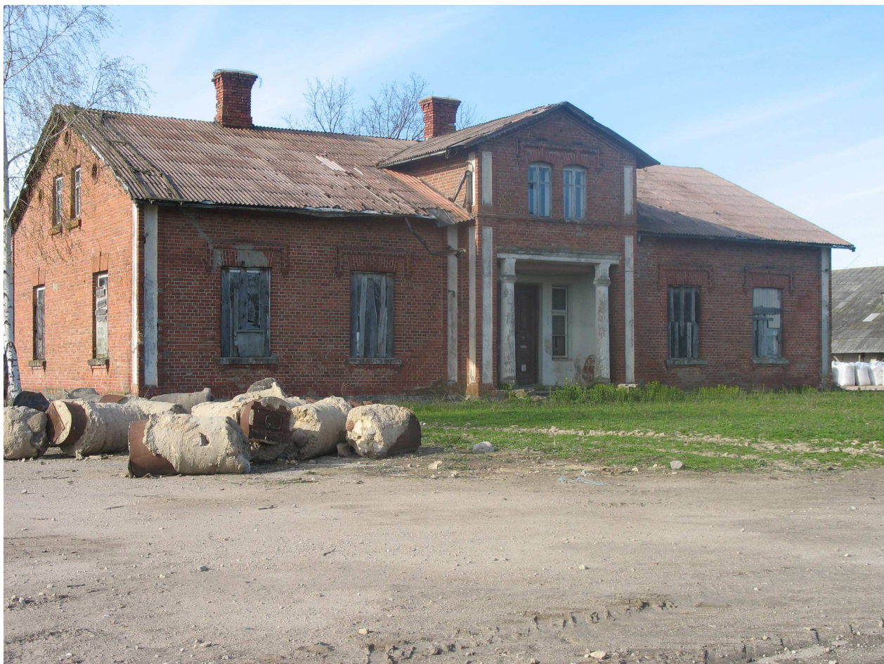
Puigiškio dvaro rūmai, PV pusė. 267