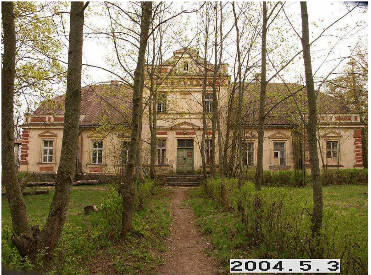
Jakiškių dvaro sodybos rūmai iš ŠR pusės. 232