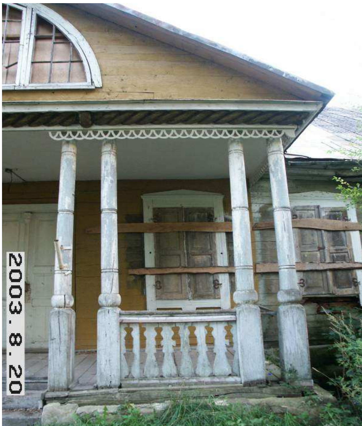
Didžiųjų Grūžių (Kalnelišio) rūmų fasado fragmentas. 220