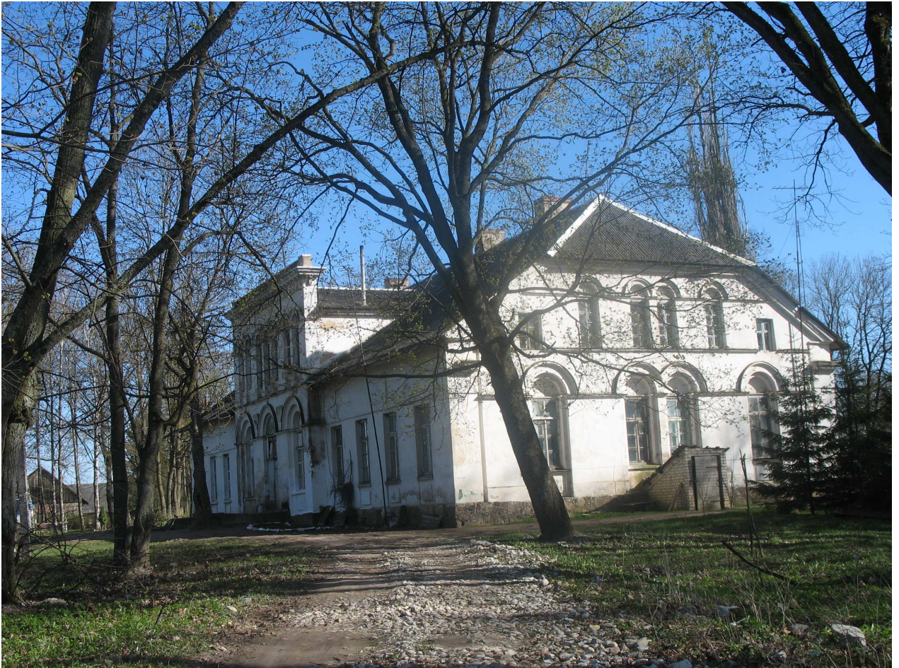
Berklainių dvaro sodybos rūmų ŠV pusė. 246