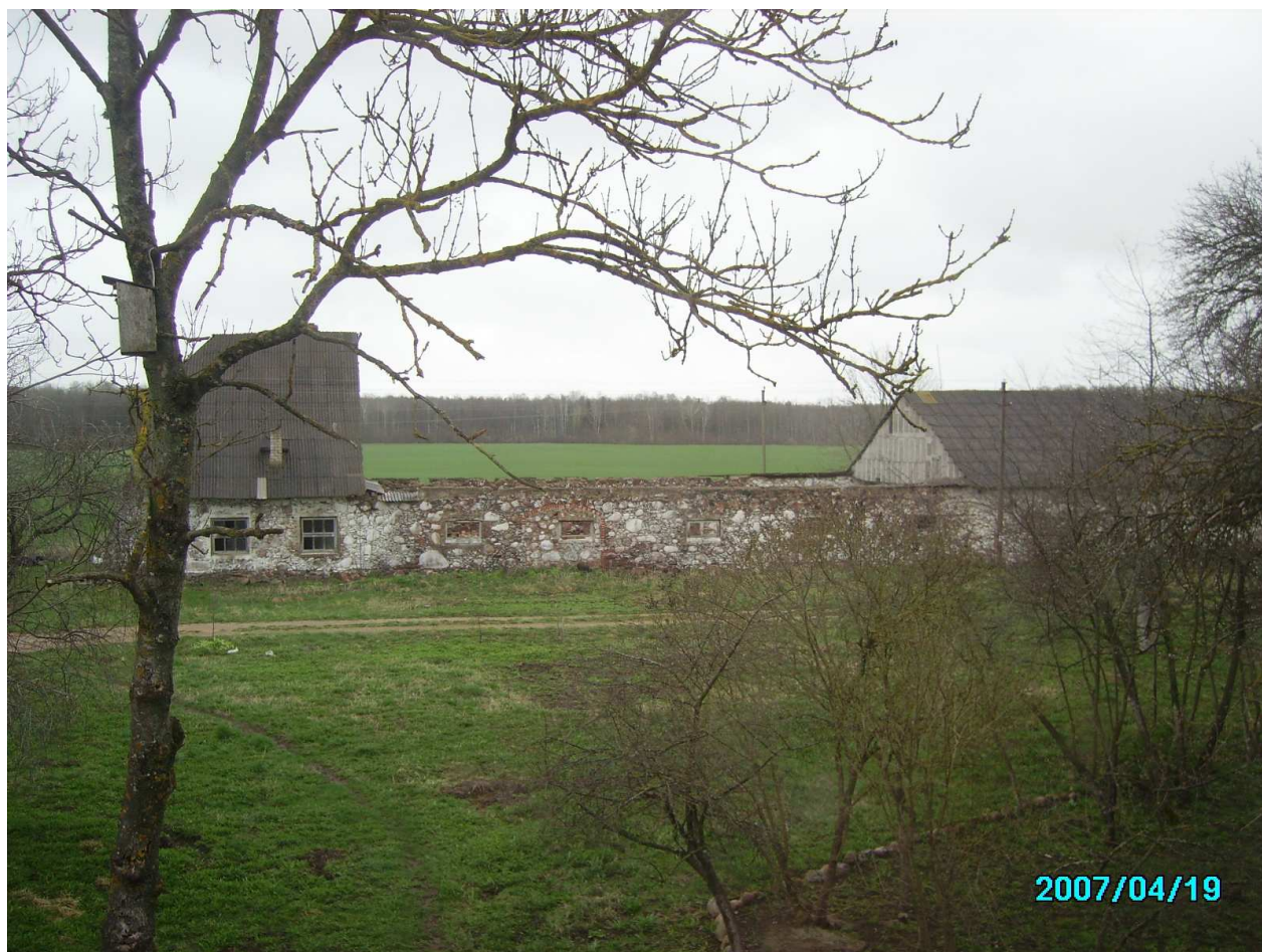
Kreivakiškio dvaro sodybos ūkinis pastatas. 222