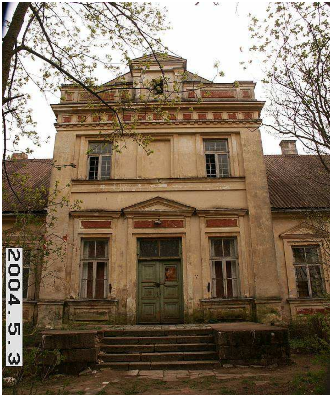
Jakiškių dvaro sodybos rūmų ŠR fasado fragmentas. 233