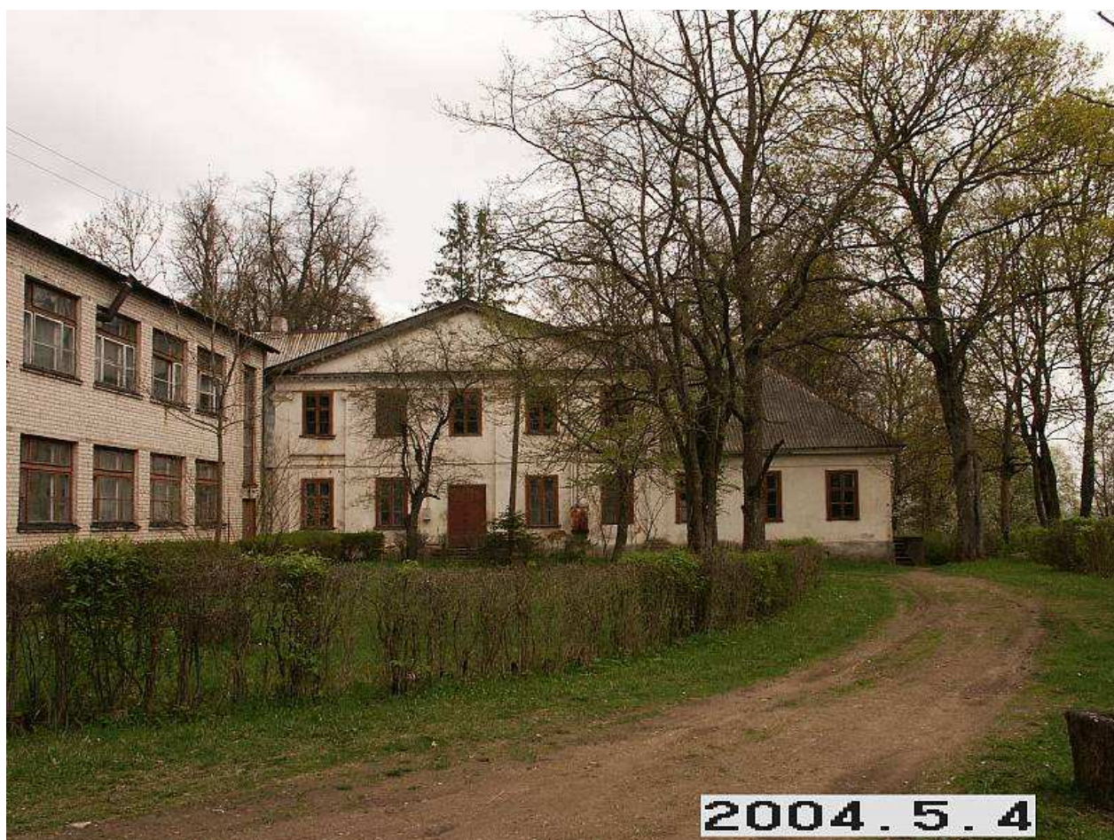
Martyniškių dvaro rūmai iš V pusės. 224