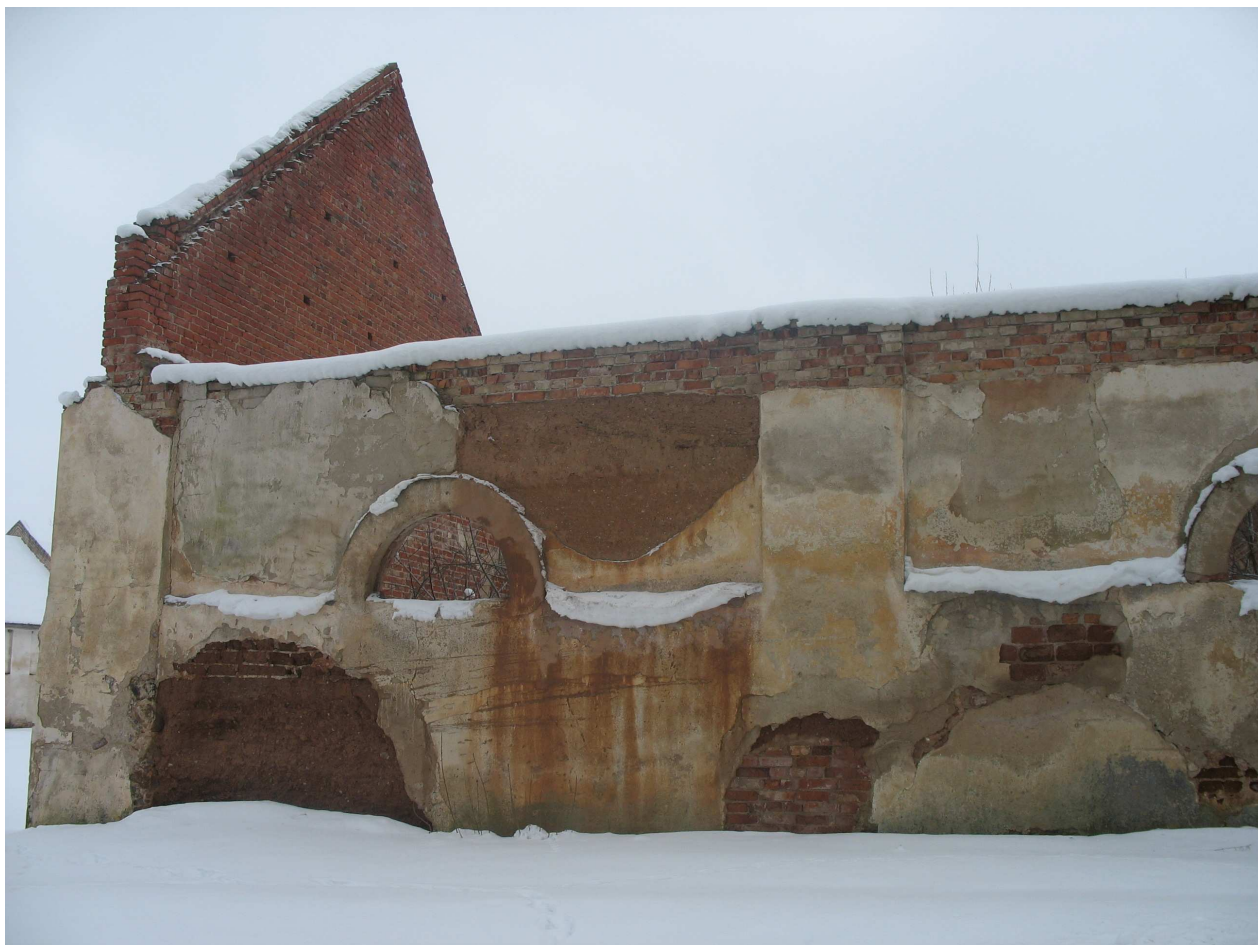
Joniškėlio dvaro sodybos ūkinis pastatas. 263