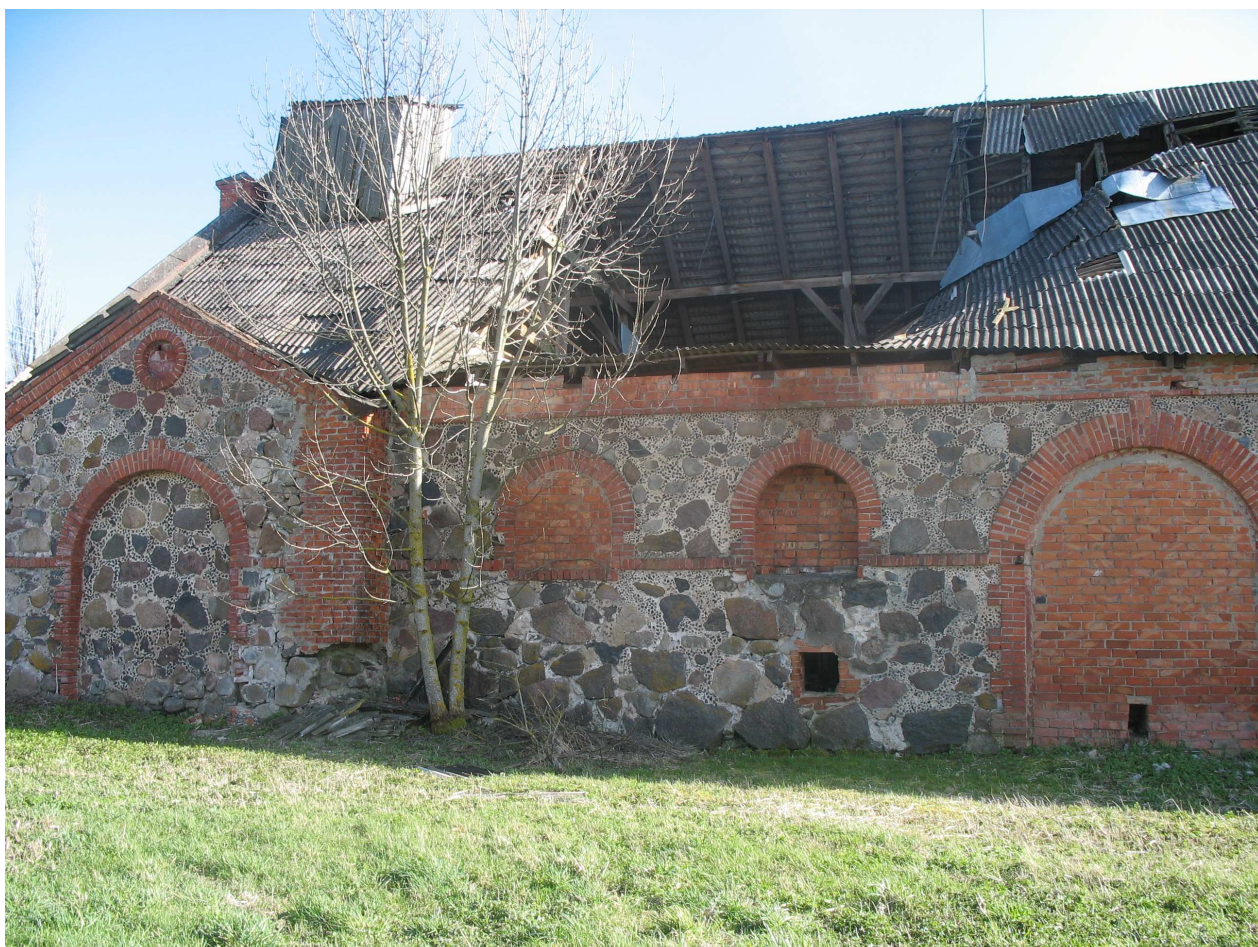
Gulbinėnų dvaro sodybos ūkinis pastatas. 241