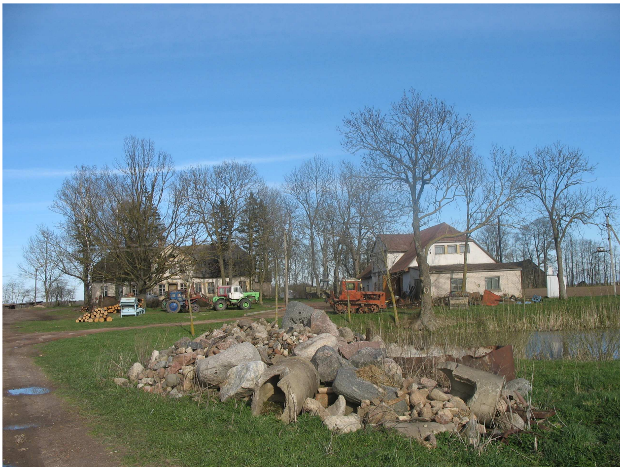
Sokų dvaro sodybos bendras vaizdas. 269