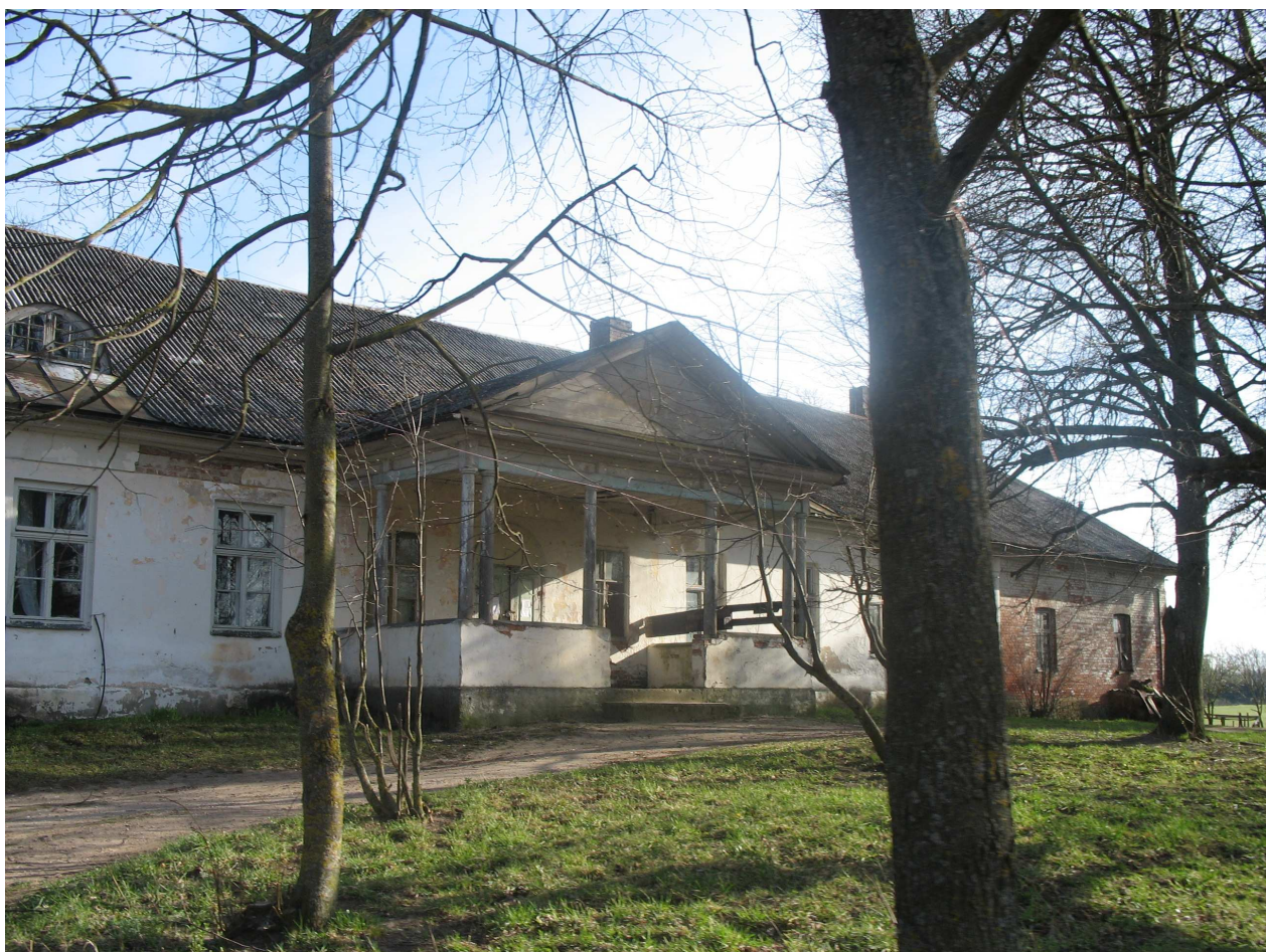
Škilinpamūšio dvaro rūmai, Š pusė. 244