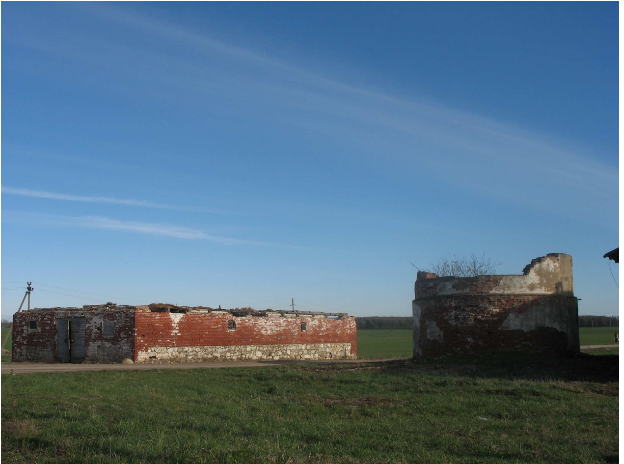
Puigiškio dvaro sodybos ūkinių pastatų fragmentai, Š pusė. 268