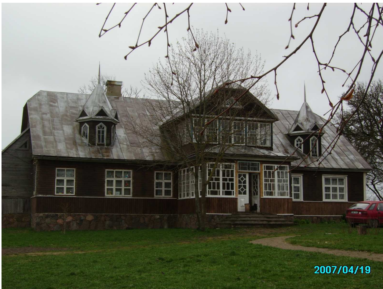
Kreivakiškio dvaro rūmai, PV pusė. 221