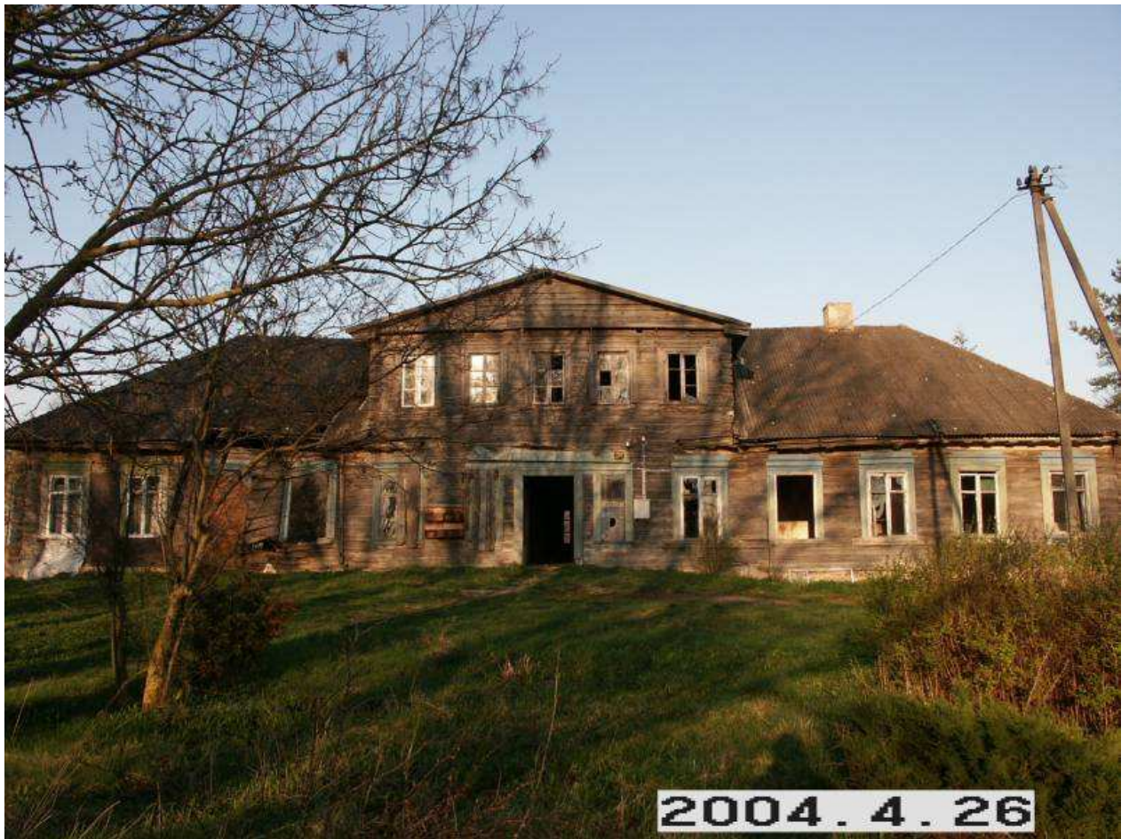
Lašmenpamūšio dvaro rūmai iš V pusės. 215