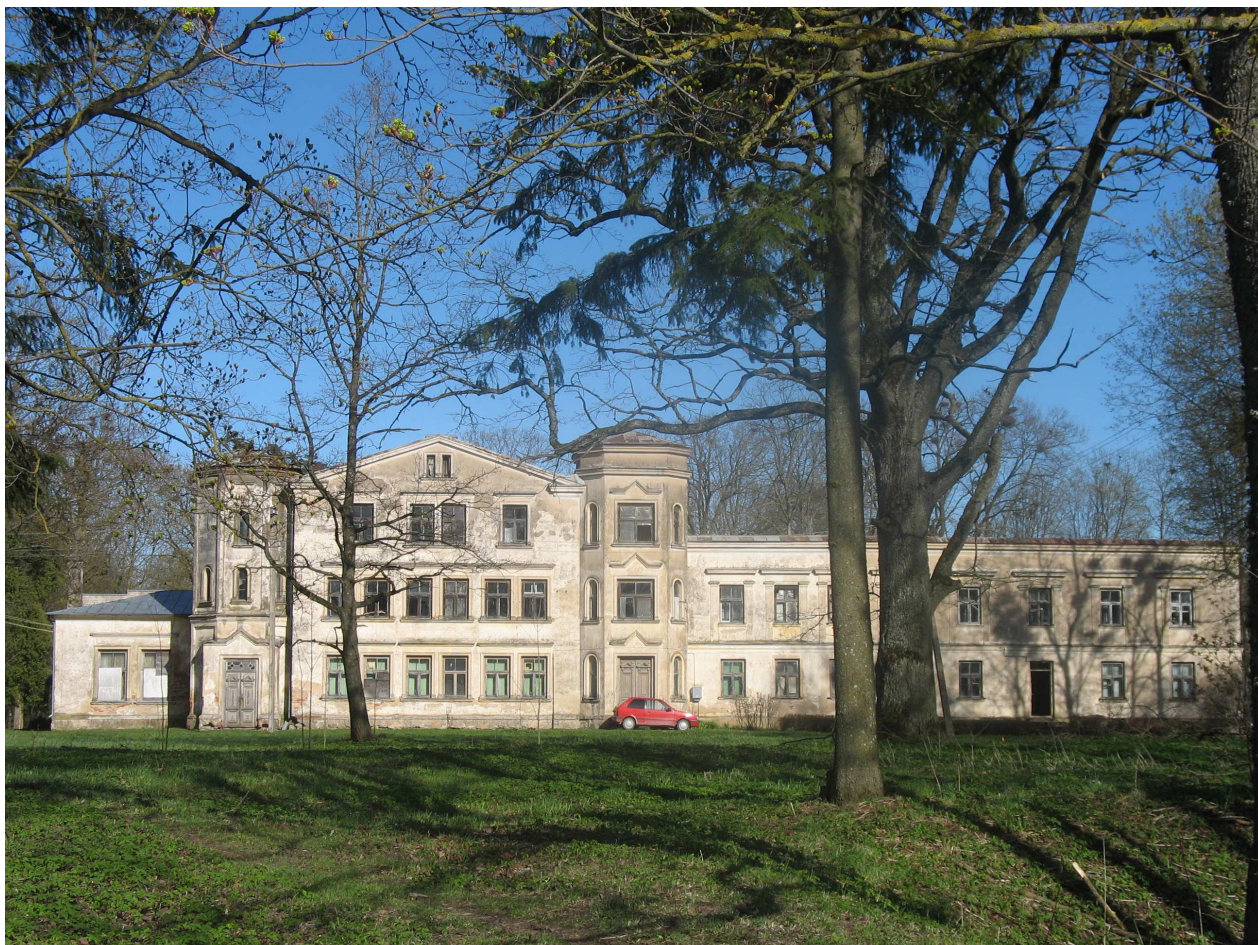
Gulbinėnų dvaro rūmai, PV pusė. 239