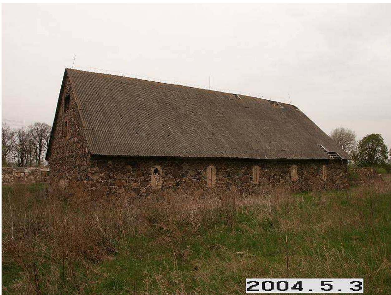
Malgūžių dvaro svirnas iš PV pusės. 226