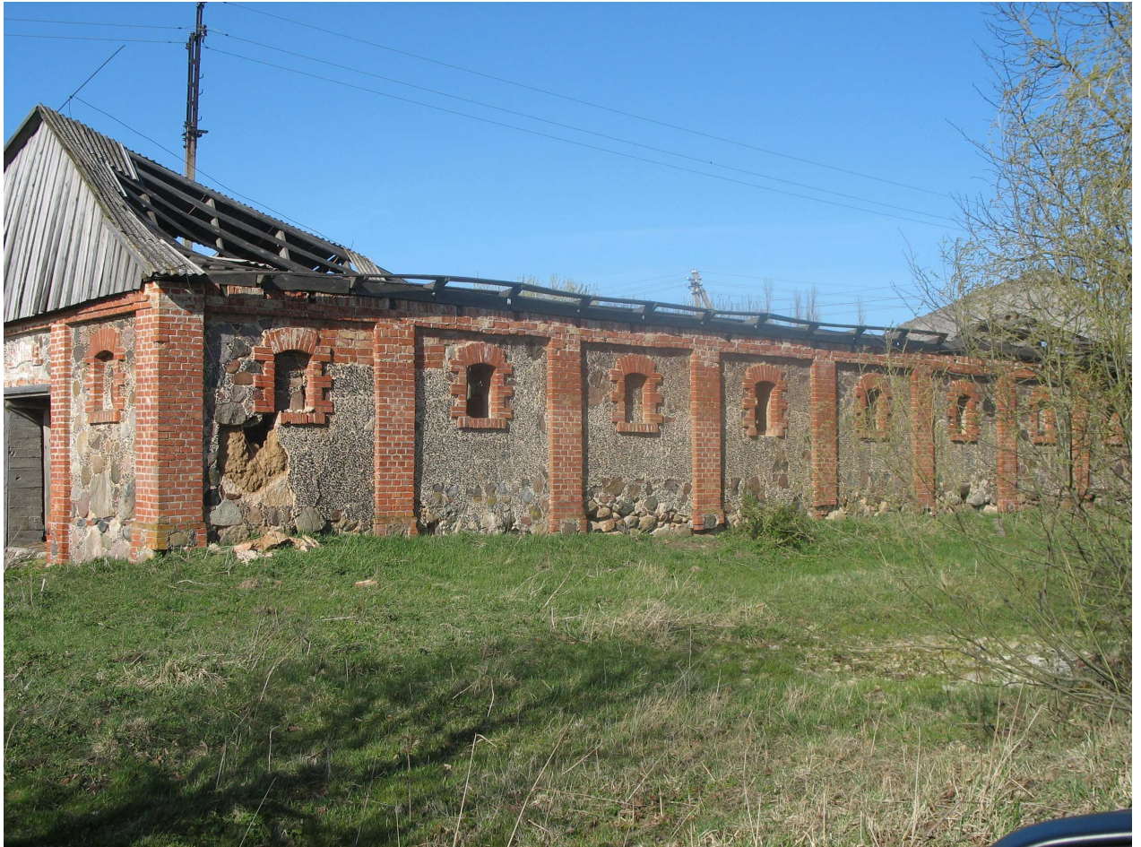
Gulbinėnų dvaro sodybos ūkinis pastatas. 240