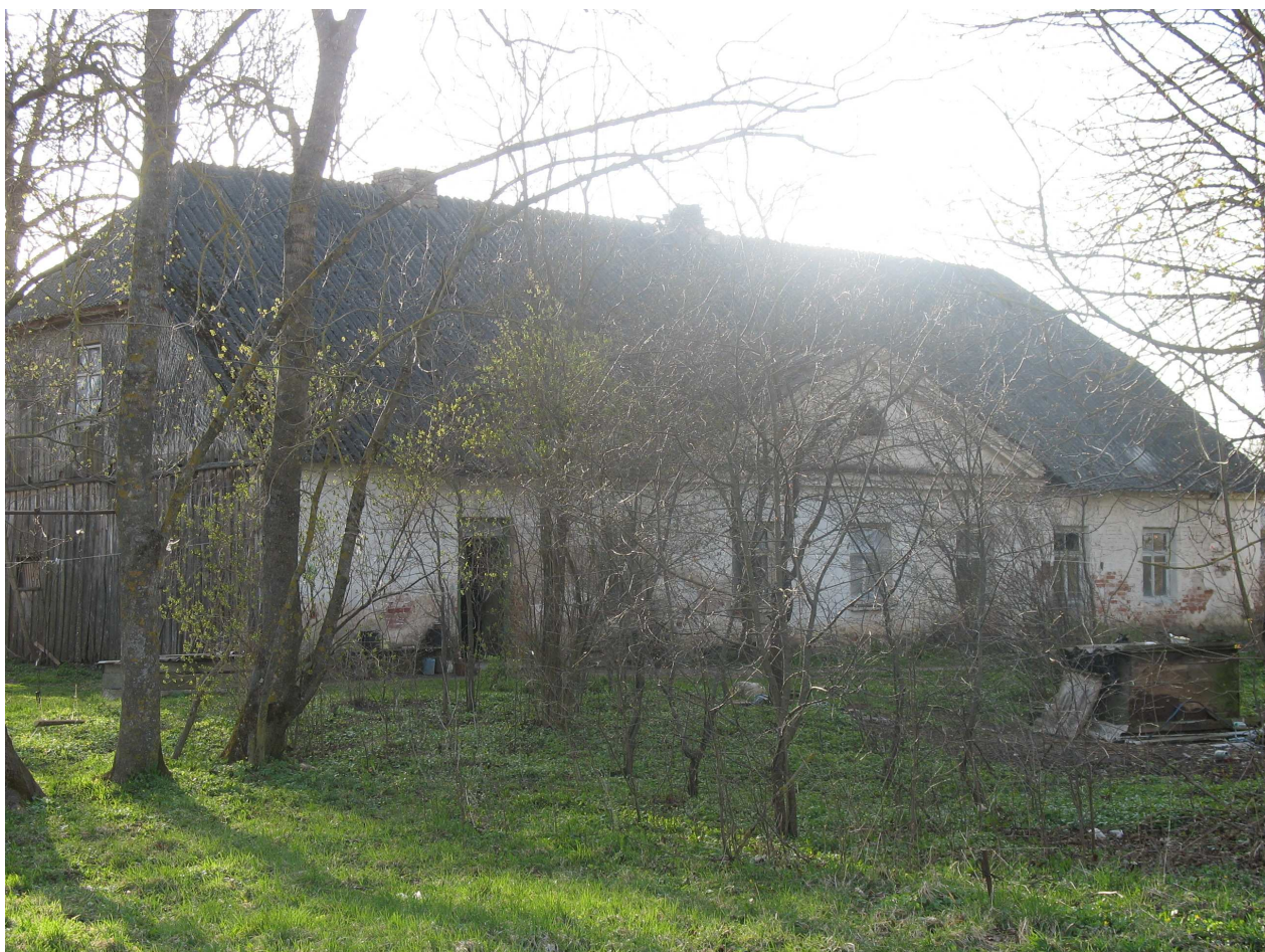
Baltpamūšio dvaro gyvenamasis namas, R pusė 264