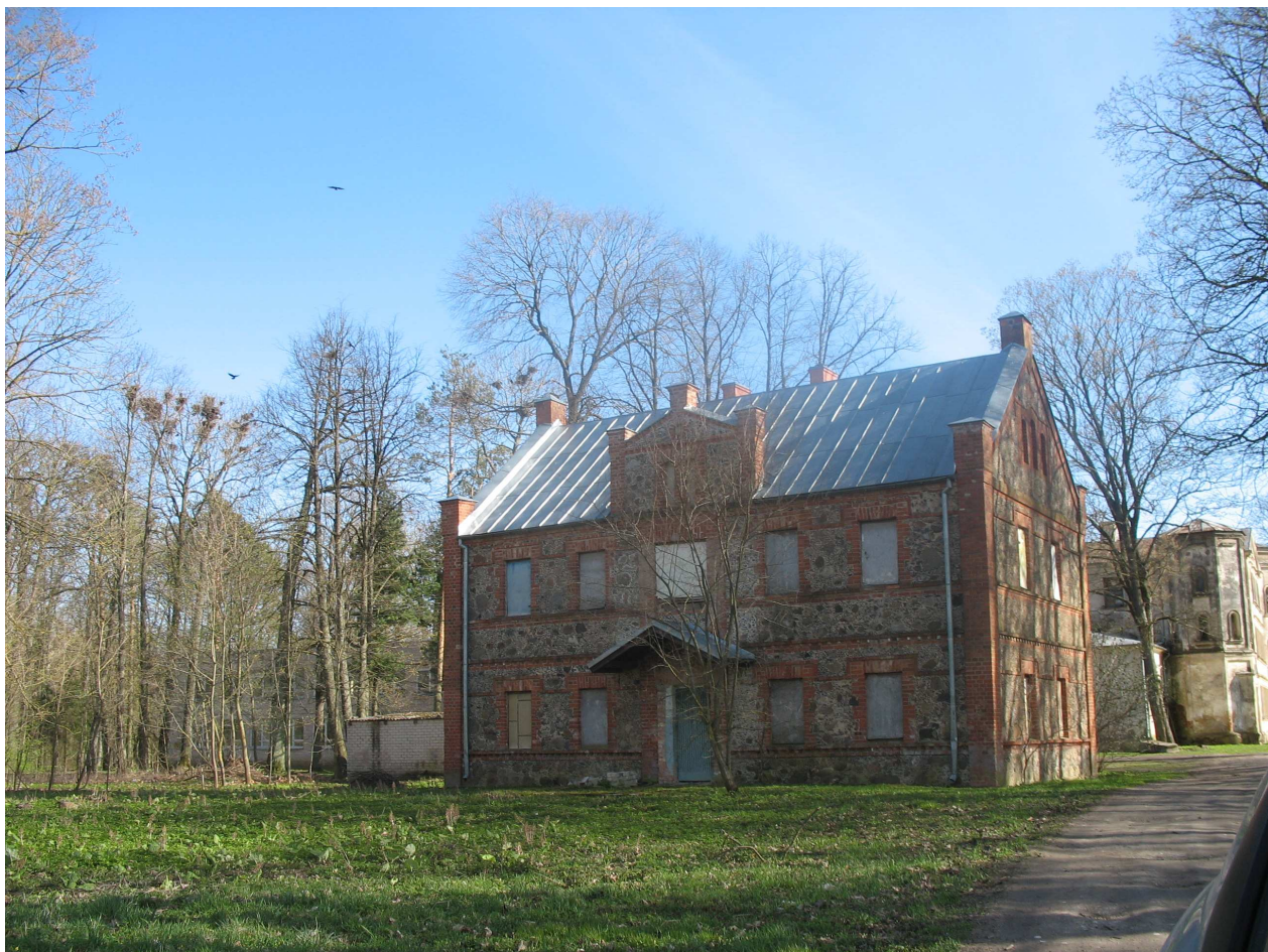
Gulbinėnų dvaro sodybos oficina, Š pusė. 242