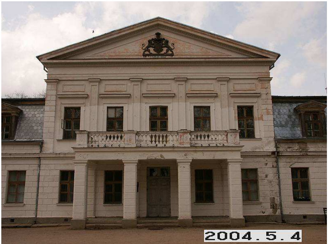
Žagarės dvaro rūmų pagrindinio fasado fragmentas. 252