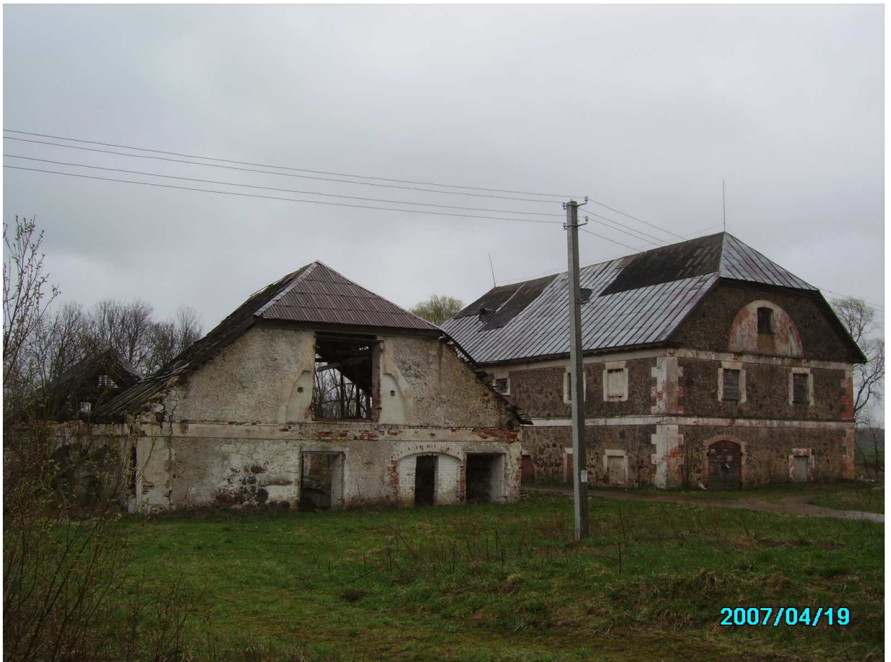
Pamūšio dvaro sodybos svirnas iš ŠV pusės. 237