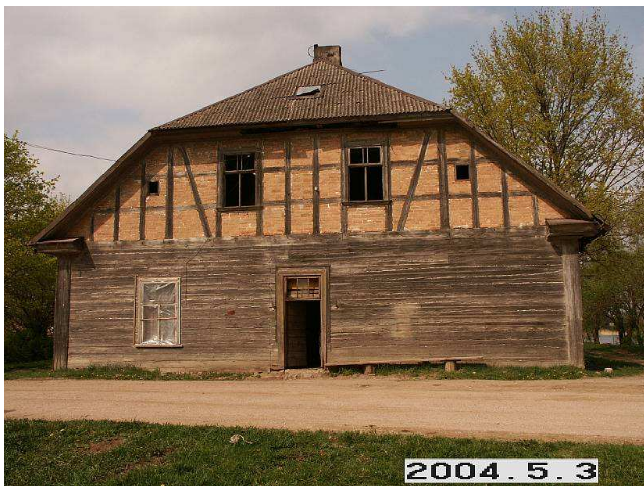
Daunoravos dvaro sodybos rūmai iš P pusės. 217