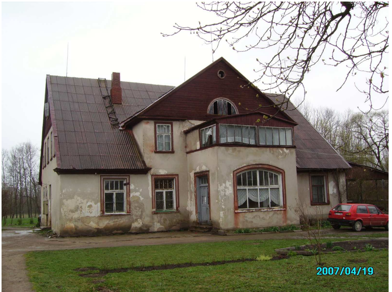
Pamūšio dvaro sodybos gyvenamasis namas iš PV pusės. 236