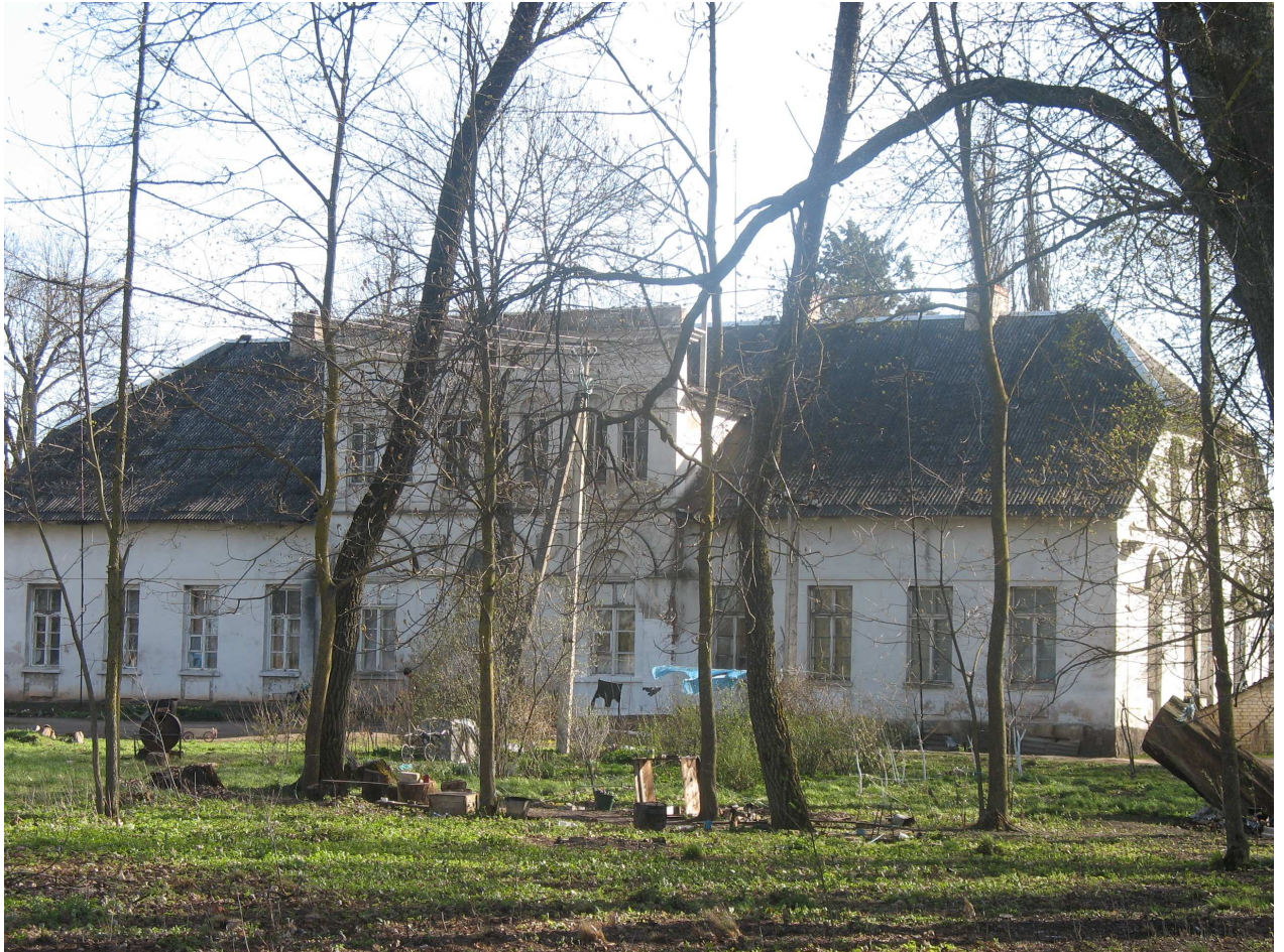
Berklainių dvaro sodybos rūmų fasadas, Š pusė. 247