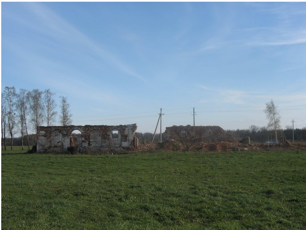
Sokų dvaro sodybos ūkinio pastato fragmentai. 270