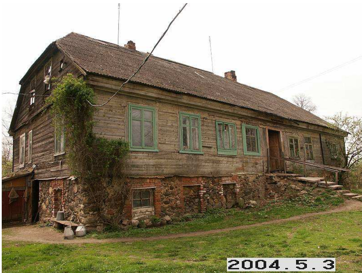
Paaudrūvės dvaro sodybos gyvenamasis namas iš ŠR pusės. 238