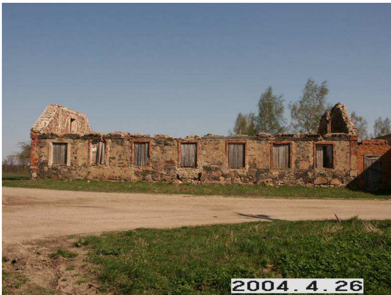
Pakruojo dvaro sodybos karčema. 258