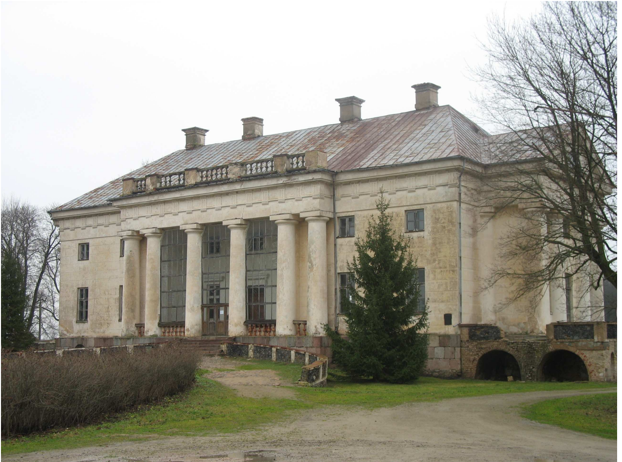
Pakruojo dvaro sodyba iš V pusės. 255