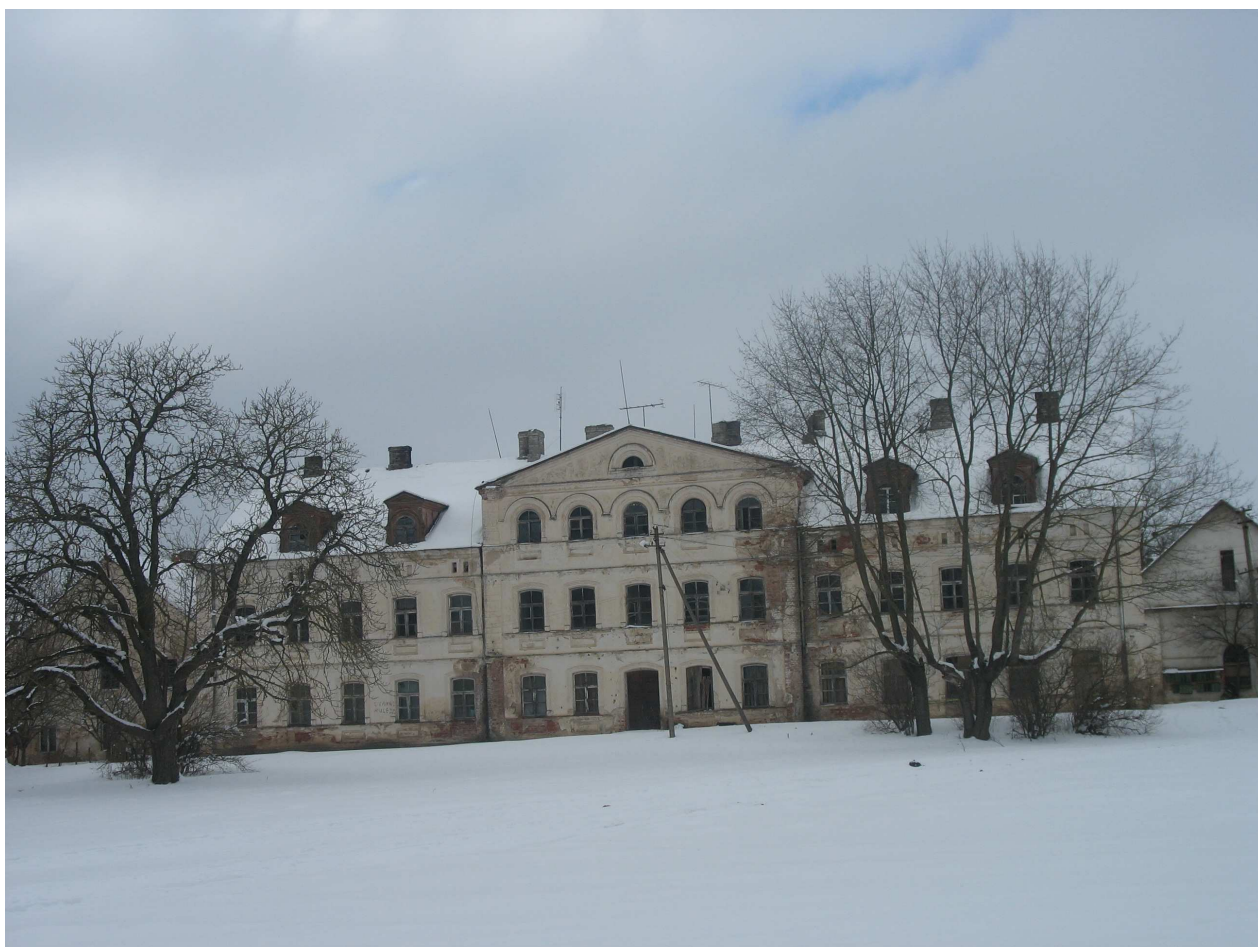
Joniškėlio naujieji dvaro rūmai, P pusė. 262