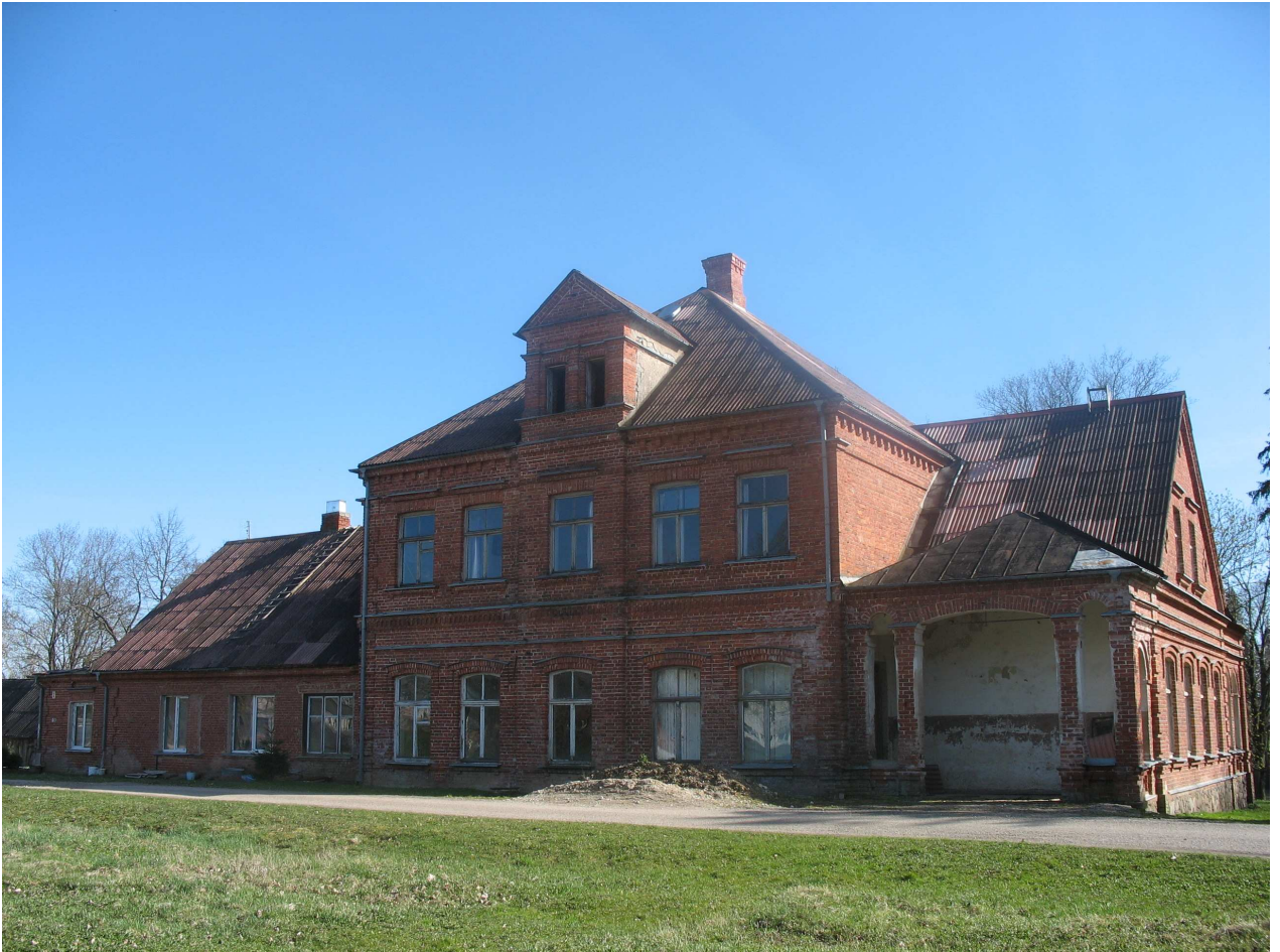
Pajiešmeniu dvaro sodybos rūmų Š pusė. 231