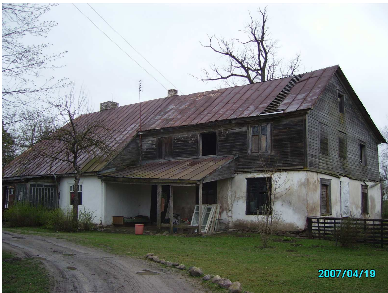
Klovainių dvaro rūmai. 249