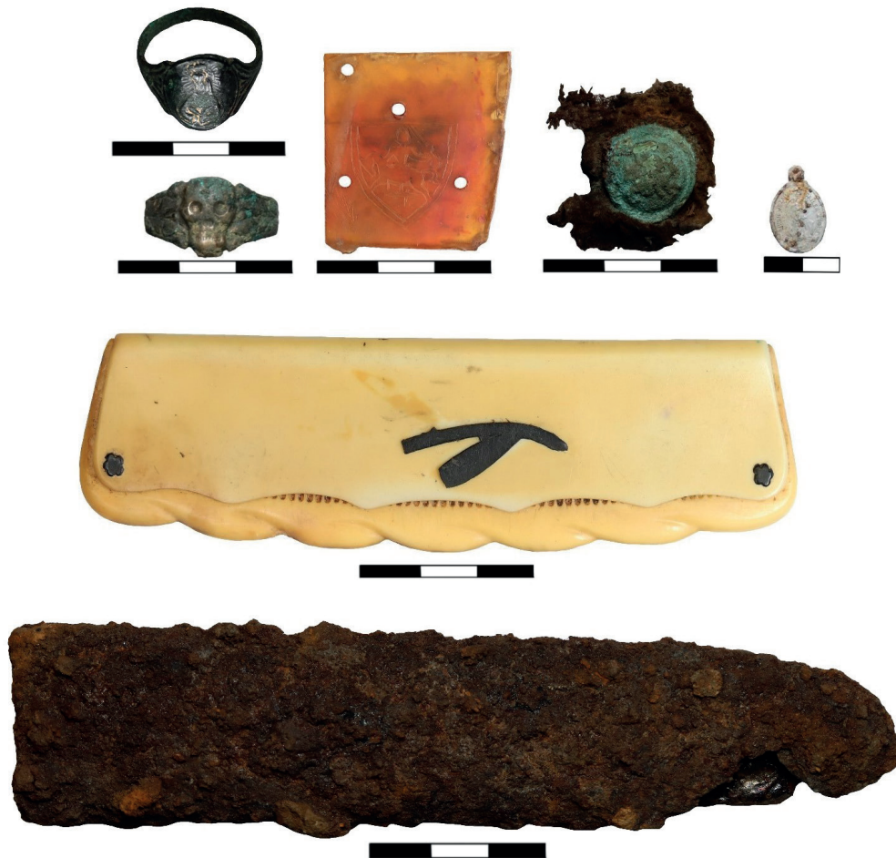
11 pav. 2021–2023 m. tyrimų Leipalingyje metu šalia Lietuvos laivės kovotojų palaikų aptikti radiniai.

Fig. 11. Finds discovered near the remains of Lithuanian freedom fighters during the 2021–2023 research at Leipalingis.