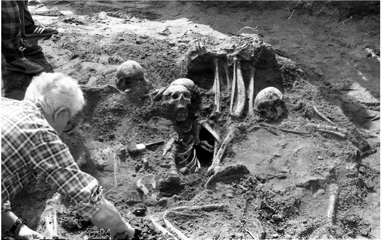
1 pav. 1991 m. visuomenės ir žuvusių partizanų artimųjų inicijuotos paieškos ir ekshumavimo akcija Leipalingio NKVD/MGB būstinės kieme. Nuotraukos kopija saugoma Leipalingio progimnazijos muziejuje.

Fig. 1. 1991 search and exhumation action initiated by the public and relatives of the fallen partisans in the courtyard of the NKVD (MGB) headquarters in Leipalingis. A copy of the photo is kept in the museum of Leipalingis Progymnasium.