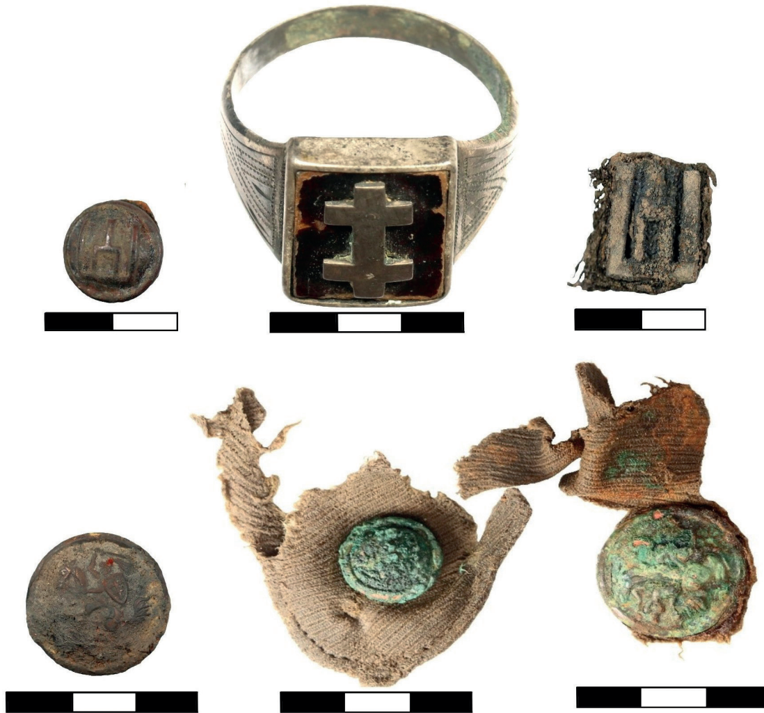
2 pav. 2021–2022 m. archeologinių tyrimų Lazdijų NKVD/MGB būstinės kieme ir jo artimiausioje aplinkoje metu šalia Lietuvos laisvės kovotojų palaikų aptikti radiniai.

Fig. 2. 2021–2022 during archaeological research in the courtyard of the Lazdijai NKVD (MGB) headquarters and its immediate surroundings, finds were discovered near the remains of Lithuanian freedom fighters.