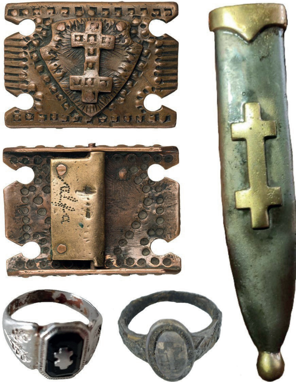
13 pav. Lietuvos laisvės kovotojams būdingi radiniai: žalvarinė diržo sagtis su Vyčio kryžiaus ženkle ir kitoje pusėje išraižytu slapyvardžiu „Alfa“; vokiško (hitlerjugendo narių) durtuvo makštys su Vyčio kryžiaus ženkle apkaustu; žiedas su Vyčio kryžiaus ženkle, priklausęs Lietuvos kariuomenės leitenantui Vytautui Milaševičiui; Rietavo dvaro teritorijoje su partizanų palaikais rastas žiedas su Vyčio kryžiaus ženkle.