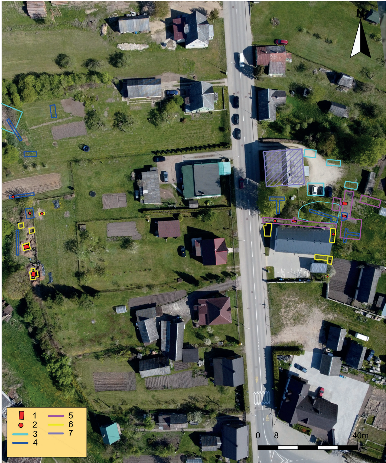
12 pav. 2021–2023 m. archeologinių tyrimų Leipalingio NKVD/MGB būstinės kieme ir artimiausioje aplinkoje planas. 1. Palaikų užkasimo vietos. 2. Pavieniai žmonių kaulai. 3. 1991 m. paieškų vietos. 4. 2021 m. tyrimai. 5. 2022 m. tyrimai. 6. 2023 m. tyrimai. 7. NKVD būstinės (stribyno) pastatas. I. Čičurkaitės nuotrauka, planą parengė R. Kraniauskas

Fig. 12. 2021–2023 plan for archaeological research in the courtyard of the NKVD (MGB) headquarters in Leipalingis and its immediate surroundings. 1. Burial sites of the remains. 2. Individual human bones. 3. Sites of the 1991 searches. 4. 2021 research. 5. 2022 research. 6. 2023 research. 7. NKVD headquarters building. Photo by I. Čičurkaitė, plan by R. Kraniauskas.