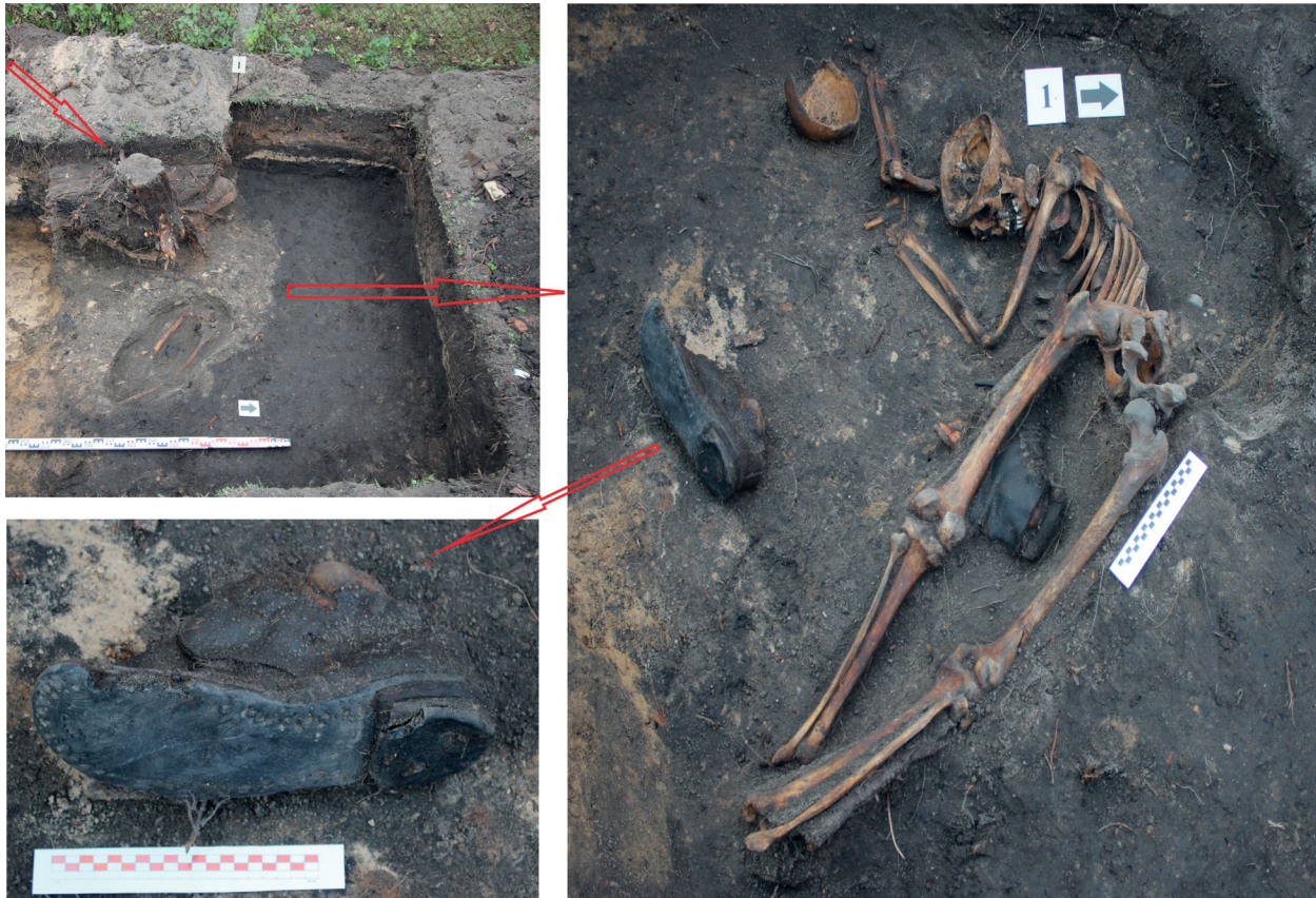
7 pav. 2021 m. gretimai Leipalingio NKVD/MGB būstinės aptikti Lietuvos laisvės kovotojo palaikai. Kaukolėje atliktas autopsinis pjūvis. In situ fiksuotas pėdų nutraukimo atvejis. Pėdų kaulai batuose į duobę įmesti atskirai nuo kūno.

Fig. 7. In 2021, the remains of a Lithuanian freedom fighter were discovered near the NKVD (MGB) headquarters in Leipalingis. An autopsy incision was made in the skull. A case of foot cessation was recorded in situ . The bones of the feet were thrown into the pit in shoes separately from the body.