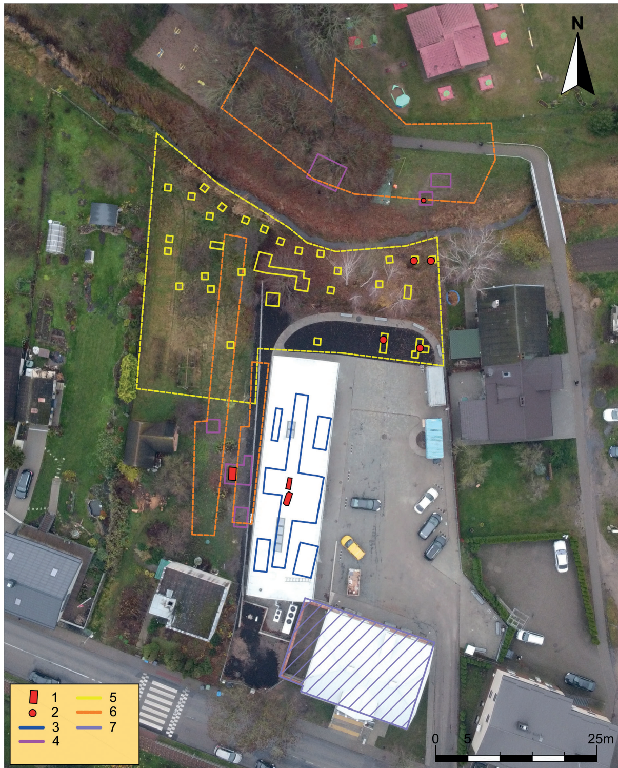
6 pav. 2021–2023 m. archeologinių tyrimų Lazdijų NKVD/MGB būstinės kieme ir artimiausioje aplinkoje planas. 1. Palaidų užkasimo vietas. 2. Pavieniai žmonių kaulai. 3. 2021 m. tyrimai. 4. 2022 m. tyrimai. 5. 2023 m. tyrimai. 6. Neinvaziniai GPR žvalgymai 2022 m. 7. NKVD būstinės (stribyno) pastatas. I. Čičiurkaitės nuotrauka, planą parengė R. Kraniauskas

Fig. 6. 2021–2023 plan for archaeological research in the courtyard of the NKVD (MGB) headquarters in Lazdijai and its immediate surroundings. 1. Burial sites of the remains. 2. Individual human bones. 3. 2021 research. 4. 2022 research. 5. 2023 research. 6. Non-invasive GPR surveys in 2022 7. NKVD headquarters building. Photo by I. Čičiurkaitė, plan by R. Kraniauskas.