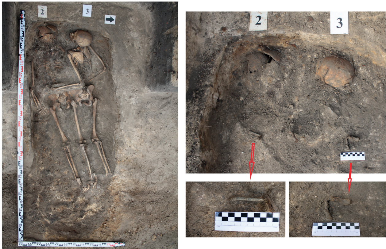
8 pav. 2022 m. gretimai Leipalingio NKVD/MGB būstinės aptikti dviejų Lietuvos laisvės kovotojų palaikai. In situ abiejų palaikų nugaros pusėje ties mentėmis fiksuotos sulenktos vinys, jų paskirtis nenustatyta.

Fig. 8. In 2022, the remains of two Lithuanian freedom fighters were discovered near the NKVD (MGB) headquarters in Leipalingis. In situ , bent nails were fixed on the back of the shoulder blades of both corpses, the purpose of which was not determined.