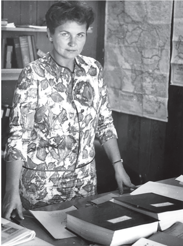
1 pav. Marija Gimbutienė prie darbo stalo Stanfordo universitete, 1961 m. (pagal Gimbutienė, 2015, p. 224)

Fig. 1. Marija Gimbutienė at her desk at Stanford University, in 1961 (according to Gimbutienė, 2015, p. 224).