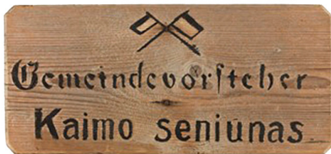
1 pav. Vokiškai-lietuviška lentelė (Lentelė vokiečių ir lietuvių kalbomis). „Aušros“ muziejus.

Pirmasis konstitucinio pobūdžio dokumentas, apibrėžęs valstybinį lietuvių kalbos statusą, priimtas Pirmojo pasaulinio karo pabaigoje, kai 1918 m. liepos 5 d. pirmą sykį vienintelei lietuvių politinei institucijai – Lietuvos Tarybai – leista susirašinėti su gyventojais lietuvių kalba. Tuo pačiu metu gatvių pavadinimų lentelėse greta vokiečių kalbos pradėta leisti rašyti ir lietuviškai (Lietuvos valstybės tarybos protokolai 1917–1918). Pirmajam pasauliniam karui artėjant prie Vokietijai nepalankios pabaigos, Lietuvos Taryba 1918 m. spalį iš Vokietijos imperijos vyriausybės gauna leidimą priimti savo valstybės konstituciją, sudaryti vyriausybę ir kurti Lietuvos valstybingumą. Tačiau dėl nestabilios tarptautinės ir vidinės padėties, Lietuvoje vykstant nepriklausomybės kovoms, iki 1922 m. tęsėsi laikinųjų konstitucijų (1918 m., 1919 m., 1920 m.), kuriose kalbos klausimams nebuvo teikiama reikšmės, laikotarpis. Kaip vieną iš svarbių tokio elgesio priežasčių galime paminėti tai, kad Lietuvos valstybiniame gyvenime veikiančios tautinės mažumos laikėsi rezervuoto požiūrio į projektuojamą nacionalinį lietuvių valstybingumą. Laikinųjų konstitucijų laikotarpiu lietuvių kalbos kaip valstybinės statuso pabrėžimas galėjo valstybės gyvenime didinti tautinę įtampą, kuri, vykstant kovoms už valstybės nepriklausomybę, buvo mažiausiai pageidautina.