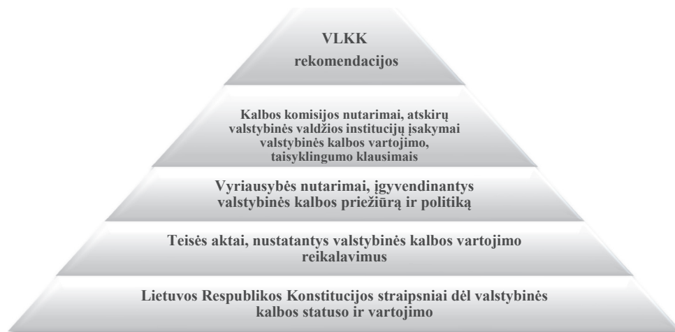
3 pav. Teisės aktų valstybinės kalbos apsaugos srityje hierarchinė sistema

Įtvirtinus lietuvių kalbos kaip valstybinės statusą valstybėje tampa svarbu užtikrinti jo įgyvendinimą, tam būtinas teisinės bazės sukūrimas ir įtvirtinimas. Atkūrus Lietuvos nepriklausomybę priimama nemažai teisės aktų valstybinės kalbos apsaugos srityje, pagal teisės aktų hierarchiją juos galima sugrupuoti taip: