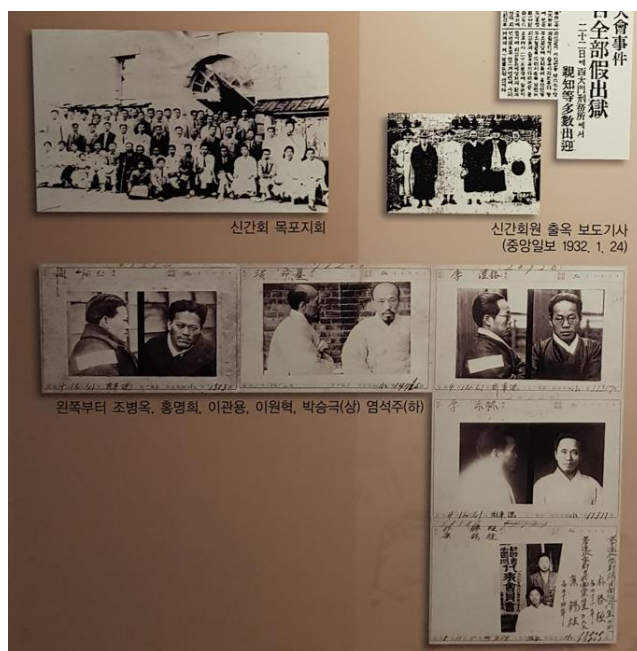
Pav.3. Seodaemun kalėjimo istorijos menė, pagrindinė parodų salė. Singan-heo judėjimo įkalintų lyderių fotografijos.

Kitas susidorojimo su aktyvistais muziejuje pateikimo pavyzdys galėtų būti tai, jog nors jau minėtosios kultūros išsaugojimo organizacijos nariai po japonų policijos arešto buvo teisme išteisinti kaip nekalti, tačiau, kaip rašoma informacinėje lentelėje, „teismo procesui užsitęsęs virš 4 metų, daug įkalintųjų mirė kalėjime, kaikurie dėl kankinimų“. Tokie stipriu emociniu tonu pasižymintys net ir trumpi muziejaus tekstai apibrėžia korėjiečių tautos viktimizaciją, dar kartą išryškinant juodai baltą skirtį tarp „mūsų“ – sužalotųjų ir „jų“ – smurtautojų, tokiu būdu formuojant empatijos jausmą savo tautiečiams ir pasąmoningą priešišumą buvusiai agresorių tautai. Tad galime pastebėti, jog šiame muziejuje kalbant apie pasipriešinimo judėjimus, pagal SKIM specifinę tematiką, yra išskirtinai pabrėžiamas ir drąsius aktyvistų veiksmus sekęs okupacinės valdžios vykdytas susidorojimo procesas, kuris lankytojams sustiprina dvipusius emocinius įspūdžius – tiek šviesų pasididžiavimą savo tautos atstovų ryžtingumu ir veiklumu, tiek liūdesį dėl šių veiksmų sukulto laukusio atpildo bei pyktį, nukreiptą prieš priešiškąją kitą – okupacinę japonų valdžią.