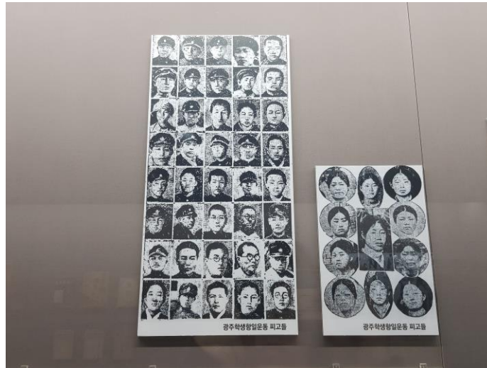
Pav.9. Nacionalinis Korėjos šiuolaikinės istorijos muziejus, 1 zona. Gvangdžu miesto studentų judėjimo dalyvių vyrų ir moterų portretai.

grupių narės, pavyzdžiui, Gvangdžu miesto studentų judėjimo (1929m.) ar Korėjiečių kalbos organizacijos atstovės.