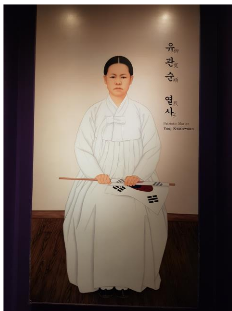
Pav.15. Seodaemun kalėjimo istorijos muziejus, administracinio pastato ekspozicija. 17-metės aktyvistės Yoo Kwan-sun paveikslas.