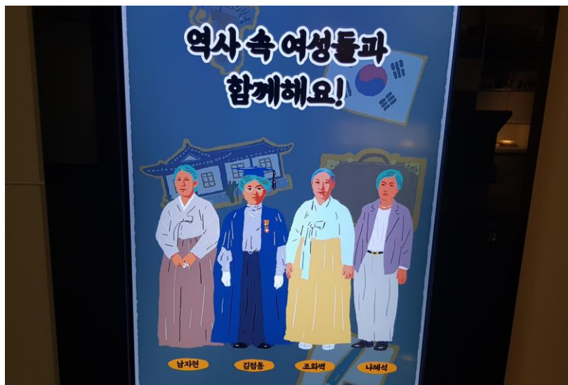
Pav.12 . Nacionalinė moterų istorijos parodų salė. 4 moterų aktyvisčių portretai, viršuje užrašas „Kartu su istorijos dalyvėmis moterimis!“ .