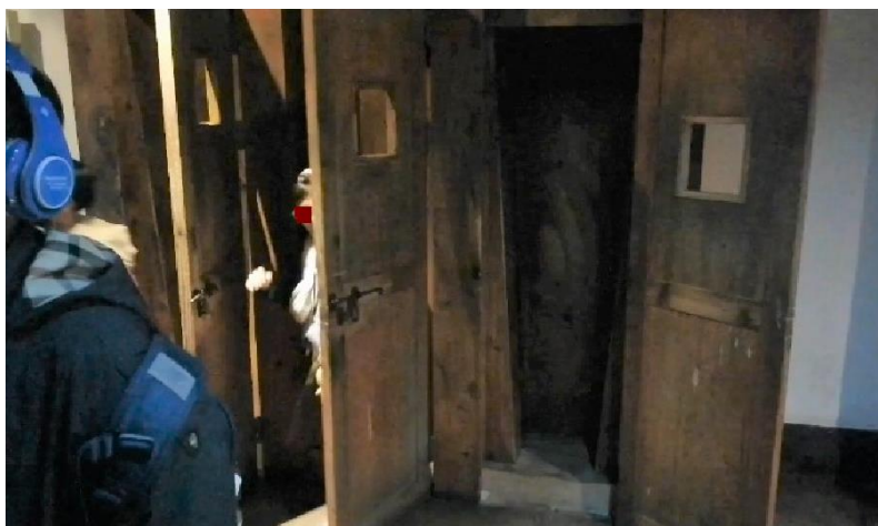
Pav 11. Seodaemun kalėjimo administracinio pastato rūšys. Korėjiečių vaikų ekskursijos dalyviai išbando kankinimo spintą.

Be šių, ypatingai su aukos vaidmeniu, susijusių vyrams priskiriamų rolių Seodaemun kalėjimo menėje yra kalbama ir kitas, SIM ir NKŠIM išskirtas, nepriklausomybės judėjimuose veikusių vyrų funkcijas, tokias kaip Laikinosios vyriausybės politinis organizavimasis siekiant atkurti šalies nepriklausomybę arba telkimasis į ginkluotąsias pajėgas ir sabotažinių misijų vykdymas. Galime daryti išvadą, jog SKIM konstruojamo tautinio pasakojimo dalyviai vyrai yra atvaizduojami kaip centrinės rezistencinio judėjimo figūros, kurių labiausiai akcentuojamos savybės yra atsidavimas tautos labui, broliškumas, herojiškumas , o tuo tarpu moterims yra priskiriamas „vienų iš daugelio“ protestuotojų ir netinkamoje vietoje atsidurusiųjų motinų vaidmuo.