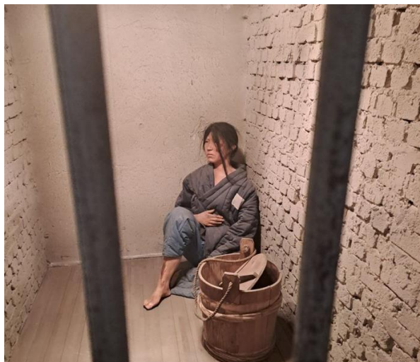
Pav 10. Seodaemun kalėjimo moterų kamera. Nėščia įkalinta moteris.