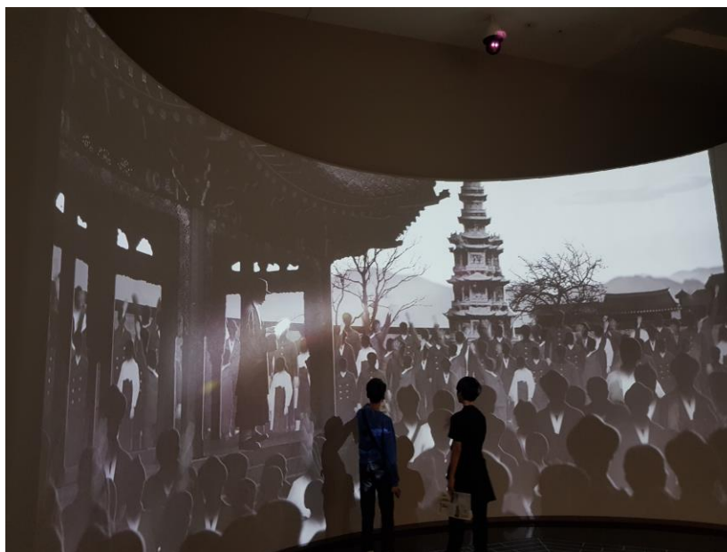
Pav.1. Nacionalinis šiuolaikinės Korėjos istorijos muziejus, ilgalaikės parodos 1 salė. Kovo 1-osios judėjimui skirtas 5min. trukmės animacinis vaizdo įrašas.

Tokiu būdu ekspozicijoje pateikiant korėjiečių mobilizavimosi anti-japoniškiems susibūrimams istorinį faktą ir pasitelkiant vizualųjį bei garsinį šaltinį, parodos lankytojams yra sąmoningai sukuriama korėjiečių vienybės ir tautos pasididžiavimo jausmas, sukeliantis teigiamas emocijas, identifikuojantis su tautai priskiriamomis atkaklumą ir drąsą simbolizuojančiomis savybėmis. Kitas įvykis, pateikiamas abiejuose muziejuose, istorijos tekmeje laipsniškai sekęs po Kovo 1-osios Nepriklausomybės deklaracijos paskelbimo yra korėjiečių Laikinosios vyriausybės įkūrimas Šanchajuje . SIM šį įvykį aprašančioje informacinėje lentelėje yra pabrėžiama, jog naujai suformuotos valdžios forma yra „demokratinė respublika, o ne karalystė ar imperija“. Galime daryti prielaidą, jog tokiu būdu yra pabrėžiamas tautos vienio ir tautos narių balso aspektas, siekiant parodyti, jog naujai kuriamos modernios Korėjos valstybės kryptis užtikrins visuotinę korėjiečių įtrauktį į šalies statybą ir valdymą. Toliau kalbant apie aptariamojo istorinio laikotarpio tautos formavimosi procesus, į kuriuos dėmesį atkreipia SIM ir NKŠIM, yra susifokusuojama ties įvairiapusių pasipriešinimu okupacinei japonų valdžiai . Abu muziejai pasakoja apie tai, jog po 1919m. Kovo 1-osios japonų valdžiai paskelbus griežtesnius laisvo žodžio, spaudos, gyventojų būriavimosi ir organizacijų steigimo apribojimus, dalis korėjiečių nepaisant grėsmės būti sulaikytiems toliau rinkosi į protestus,