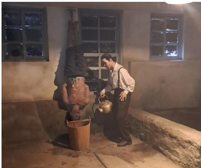
Pav 8. Seodaemun kalėjimo administracinio pastato rūšys. Vienas iš kalinių kankinimo būdų.