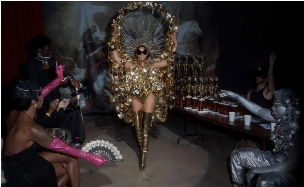
13 paveikslas (Beyoncé, act i – RENAISSANCE (Niujorkas: Parkwood Entertainment, 2022))