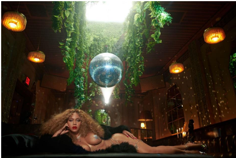
4 paveikslas (Beyoncé, act i – RENAISSANCE (Niujorkas: Parkwood Entertainment, 2022))