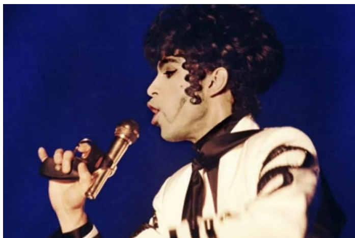
11 paveikslas (Spencer Kornhaber, „Prince: Gay Icon, Whether He Wanted to Be or Not“, The Atlantic, paskelbta 2016 m. balandžio 22 d., https://www.theatlantic.com/entertainment/archive/2016/04/prince-gay-homophobia-conservative-liberal-progress/479502/ )