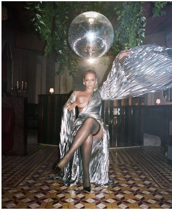
5 paveikslas (Beyoncé, act i – RENAISSANCE (Niujorkas: Parkwood Entertainment, 2022))