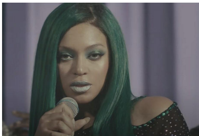
12 paveikslas („Beyoncé – I‘M THAT GIRL (Official Teaser)“ nufilmuota 2022 m., „YouTube“ vaizdo įrašas, 0:41, paskelbta „Beyoncé“ 2022 m. rugpjūčio 12 d., https://youtu.be/09z3qcegPHU )