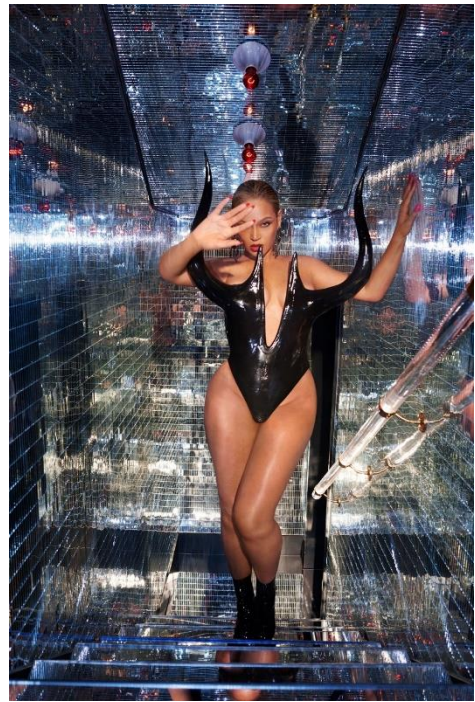
6 paveikslas (Beyoncé, act i – RENAISSANCE (Niujorkas: Parkwood Entertainment, 2022))