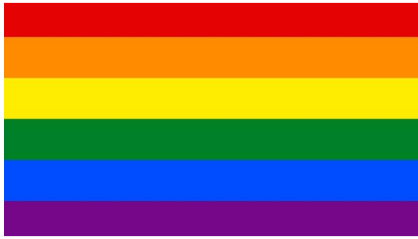
1 paveikslas (Jamie Baillard, „22 LGBTQ+ Pride Flags and Their Meanings“, Woman’s Day, paskelbta 2023 m. gegužės 5 d., https://www.womansday.com/relationships/g43713046/lgbtqia-pride-flag-meanings/ )