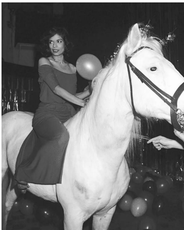
9 paveikslas (Melissa Locker, „Bianca Jagger Finally Sets The Record Straight About That Night At Studio 54 “, Vanity Fair, paskelbta 2015 m. balandžio 25 d., https://www.vanityfair.com/hollywood/2015/04/bianca-jagger-studio-54 )