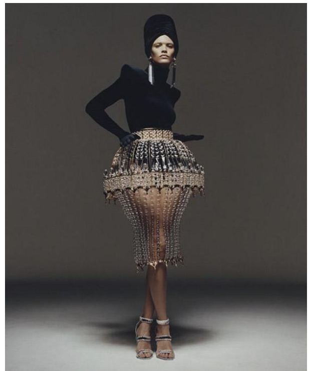
15 paveikslas (Balmain, „RENAISSANCE Couture by Beyoncé x Balmain“, Balmain, žiūrėta 2023 m. gegužės 1 d., https://us.balmain.com/en/experience/renaissance-couture-beyonce-x-balmain )