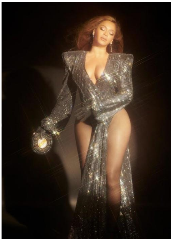
7 paveikslas (Beyoncé (@beyonce), Be pavadinimo , Instagram nuotraukos, 2022 m. rugpjūčio 8 d., https://www.instagram.com/p/ChAn_E1PY2A/?igshid=YmMyMTA2M2Y%3D )