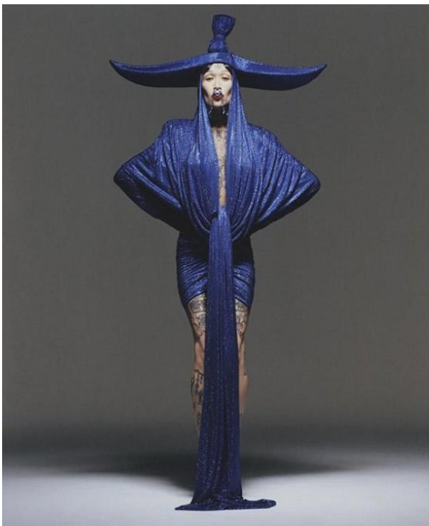
14 paveikslas (Balmain, „RENAISSANCE Couture by Beyoncé x Balmain“, Balmain, žiūrėta 2023 m. gegužės 1 d., https://us.balmain.com/en/experience/renaissance-couture-beyonce-x-balmain )