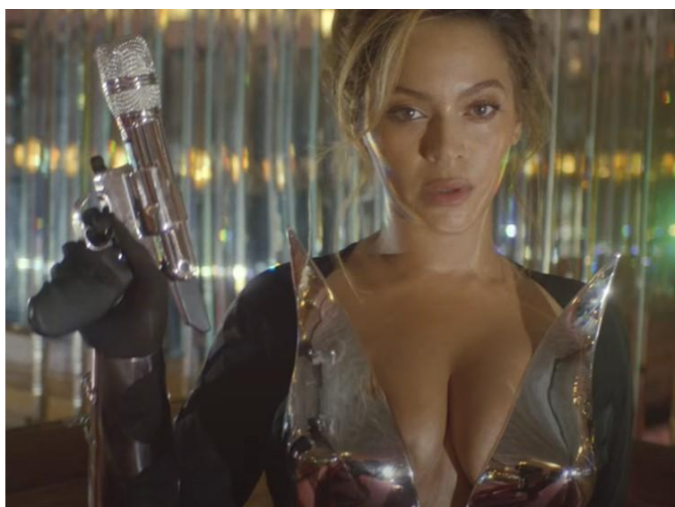
10 paveikslas („Beyoncé – I‘M THAT GIRL (Official Teaser)“ nufilmuota 2022 m., „YouTube“ vaizdo įrašas, 1:38, paskelbta „Beyoncé“ 2022 m. rugpjūčio 12 d., https://youtu.be/09z3qcegPHU )