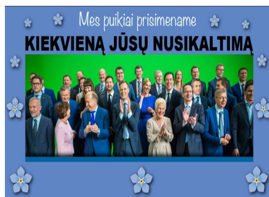
Paveikslas 10: internetinis memas - politinių veikėjų kritikos pavyzdys

Paveiksle Nr. 11 galime pamatyti internetinį memą, kuriame pavaizduota dabartinė teisingumo ministrė Evelina Dobrovolska, viršuje virš jos nuotraukos angliškai parašyta „E. Dobrovolska Lithuania minister of Justice. 3 years study no qualifying exams passed – anyone see the problem with politics?“ (Evelina Dobrovolska, Lietuvos teisingumo ministrė, 3 metai studijų, nėra išlaikiusi kvalifikacijos egzaminų, ar kažkas mato problemą su politika?) Šiame internetiniame meme bandoma atkreipti dėmesį į teisingumo ministrės išsilavinimą, nes kai ji tapo kandidate į teisingumo ministrės postą, viešojoje erdvėje pasirodė svarstymai, ar magistrantūros laipsnio neturinti Evelina Dobrovolska profesionaliai ir kompetentingai atliktų savo pareigas. 101 Tačiau protestuotojų viešojoje erdvėje,