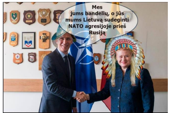
Paveikslas 36: internetinis memas – informacijos šaltinių kritika