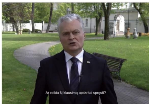
Paveikslas 22: internetinis memas – politiko kritikos pavyzdys

Kai pana paklausia kur mano prezervatyvas