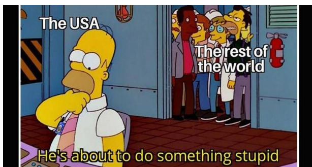
Paveikslas 1: Memo pavyzdys

ir komentarus į sudėtingus koliažus. Pavyzdžiui, 1 ir 2 paveiksle galime pamatyti du sukurtus internetinius memus, kurių vaizdas yra iš kultinio animacinio serialo „Simpsonai“, tačiau teksto pagalba keičiama memo reikšmė. Pirmame paveiksle esančiu tekstu pasakoma, jog JAV padarys kažką kvailo, nes Houmeris pavadintas „The USA“, tiesioginis to vertimas būtų Jungtinės Amerikos Valstijos, grupė žmonių pavadinti „The rest of the world“, tiesioginis to vertimas būtų visas likęs pasaulis, o pokalbis tarp grupės žmonių subtitru parašyta „He’s about to do something stupid“, vertimas šio subtitro būtų: jis padarys kažką kvailo, o antrame paveiksle, jog kažką kvailo padarys antivakseriai (vertimas – Pasiruoškite visi, jis tuo padarys kažką kvailo). Abu internetinius memus galime susieti su pagrindiniu serialo veikėju Houmeriu Simpsonu, kuris pasižymi ne pačiu aštriausiu protu, tingumu ir kvailais sprendimais.