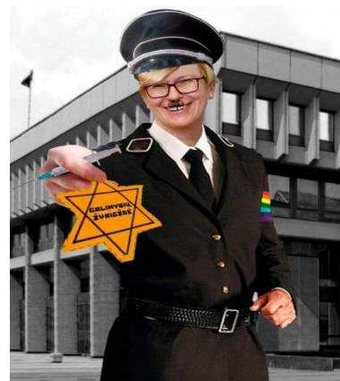
Paveikslas 13: internetinis memas - politinių veikėjų kritikos pavyzdys

Paveiksle Nr. 14, skirtingai nei paveiksle Nr. 12 ir 13, Šimonytė lyginama ne su nacistinės Vokietijos lyderiu Adolfu Hitleriu, bet su sovietų sąjungos diktoriais Leninu ir Stalinu, šių asmenų plakatas integruotas kairėje memo pusėje, o ant Ingridos Šimonytės skverno prikabinta sovietų sąjungos žvaigždė. Tekste parašyta „Jums suorganizuosiu lietuvišką holodomorą – antivakseriai!“ Holodomoras – tai 1932-1933 m. Sovietų sąjungos vadovybės dirbtinai sukeltas badas Ukrainoje. Internetiniame meme parašyti žodžiai tampa tarsi Ingridos Šimonytės balsu ir jos gąsdinimu antivakseriams – žmonėms, kurie nepripažįsta vakcinų. Lyginant paveikslų Nr. 12,13,14 struktūrą galima pastebėti, kad paveikslas 14 yra sukurtas neprofesionaliai, tai neatitinka standartinių internetinio memo formų, teksto šrifto ir spalvos, dėl šios priežasties galime manyti, jog internetinio