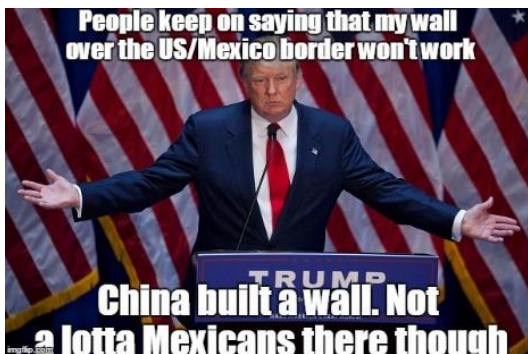
Paveikslas 4: Politinės kampanijos memo pavyzdys