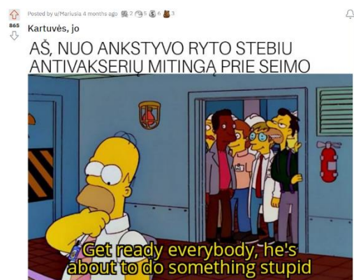
Paveikslas 2: Memo pavyzdys

Pozicijos elementą galima būtų skirti į tris pograpius 36 :