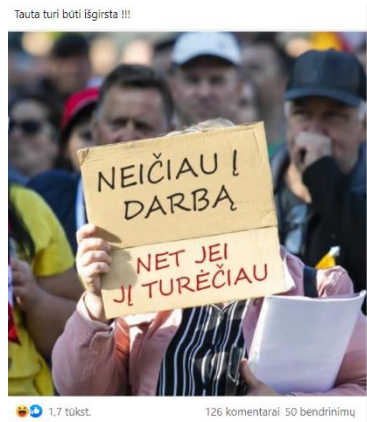
Paveikslas 42: internetinis memas – humoristinis pavyzdys

Internetiniame meme, kuris pavaizduotas paveiksle Nr. 42, matomas vyras, kuris atsisukęs į plytinę sieną ir tarsi kalbasi su ja, o tekste parašyta „bandai racionaliai kalbėtis su šeimų maršo dalyviu:“, taip panaudojant žinomą frazeologizmą mėginama ironizuoti, jog kalbėtis su protestuotoju yra tas pats, kas su siena, diskusija nevyks ir jokių atsakymų gauti nepavyks. Paveiksle Nr. 43 galime pamatyti internetinį memą, kurio tekste parašyta „Aš vėluodamas bėgu į troleibusą“, o nuotrauka tampa atsakymu į šią sąlygą ir pridedami žodžiai „Troleibuso vairuotoja, užtrenkdama man prieš nosį duris:“, o nuotraukoje matoma moteris, kuri demonstruoja nepadorius rankų gestus. Šiuo internetiniu memu norima parodyti, kokie nekultūringi asmenys reprezentuoja protestuotojus, ir pasityčioti iš jų veiksmų. Kritika įvelkama į kasdienę gyvenimiškąją situaciją ir dėl šio nesuderinamumo internetinis memas tampa juokingas.