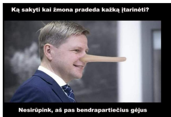
Paveikslas 16: internetinis memas - politinių veikėjų patyčios pavyzdys