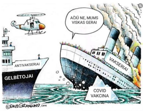
Paveikslas 39: internetinis memas – mobilizacijos pavyzdys