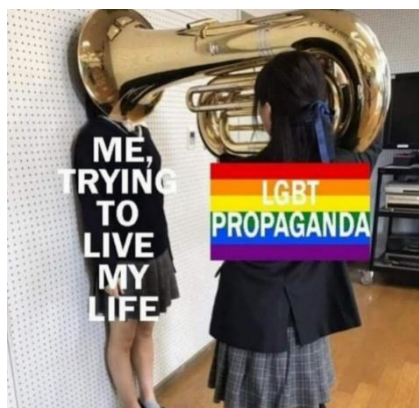
Paveikslas 29: internetinis memas – LGBT bendruomenės kritika