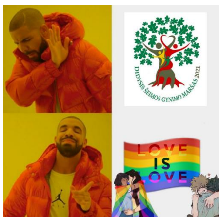
Paveikslas 31: internetinis memas – LGBT bendruomenės kritika

internetiniame meme jis nusisukęs ir nenori žiūrėti į „Didžiojo Šeimos gynimo maršo“ logotipą, tačiau yra patenkintas ir nori žiūrėti į LGBT vėliavą, kurioje parašyta „Love is Love“ vertimas ir karikatūriškai nupieštos dvi homoseksualios poros. Šiuo internetiniu memu norima palaikyti LGBT bendruomenę. Internetiniame meme, kuris pavaizduotas paveiksle Nr. 32, galime pamatyti lyginamąjį memą, viršutinėje dalyje parašyta „žmonės dalijasi šituo“, o karikatūriškai nupieštas asmuo, kuris valosi užpakalį sėdmenis? su LGBT vėliava, apatinėje memo dalyje parašyta „užuolaidos jų namuose“, pavaizduotos purvinos užuolaidos. Šiuo internetiniu memu norima pasakyti, jog tie, kurie negerbia LGBT bendruomenės, yra netvarkingi ir gyvena skurdžiai ir yra iš žemesnės socioekonominės klasės.