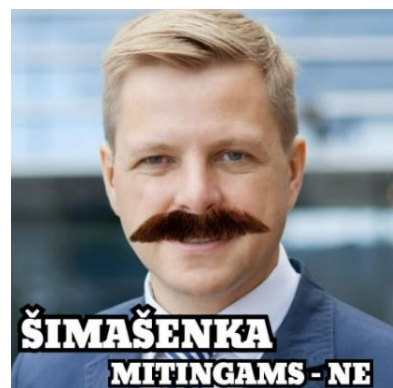
Paveikslas 15: internetinis memas - politinių veikėjų kritikos pavyzdys