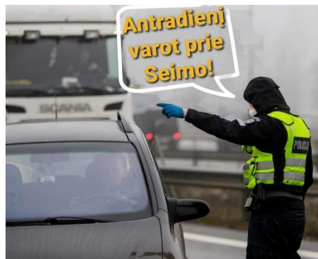
Paveikslas 38: internetinis memas – mobilizacijos pavyzdys