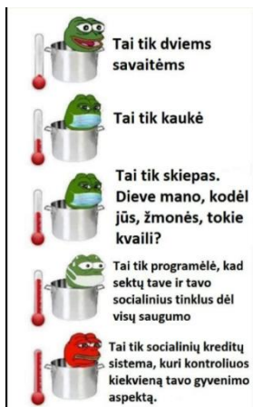
Paveikslas 45: internetinis memas – humoristinis pavyzdys