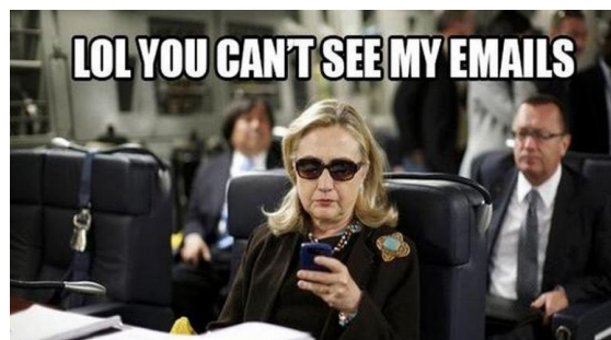
Paveikslas 5: Politinės kampanijos memo pavyzdys

Politiniai ir protesto memai gali sukurti alternatyvius pasakojimus, naują prasmę, suburti politines grupes internetinių memų forma turi galią daryti įtaką socialiniams judėjimams, pavyzdžiui, tokiems kaip „Occupy Wall Street“ ar Greepeace „Let’s go“