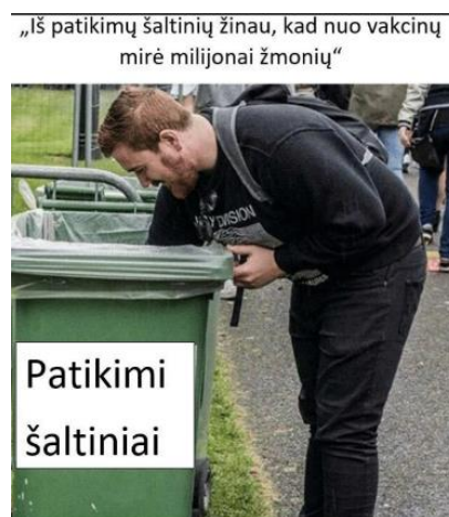
Paveikslas 34: internetinis memas – informacinio šaltinių kritika

Analizuojant dezinformuojančius memus galima pastebėti informacinę ataką, nukreiptą prieš JAV ar NATO pajėgas, internetinių memų forma bandoma vaizduoti juos kaip keliančius grėsmę