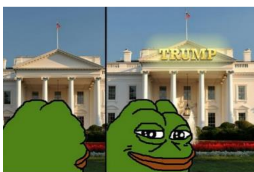
Paveikslas 6: alt-right memo pavyzdys