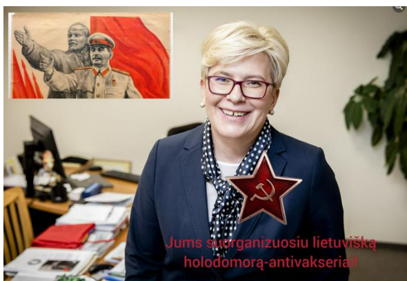
Paveikslas 14: internetinis memas - politinių veikėjų kritikos pavyzdys

memo kūrėjas nėra susipažinęs su internetinių memų kultūra. 103 Paveiksle Nr. 15 pavaizduotas Remigijus Šimašius, prie jo veido „prikabinti“ ūsai, o tekste parašyta „Šimašenka mitingams – ne“. Šis internetinis memas sukurtas birželio mėnesį, kai Vilniaus miesto savivaldybė neišdavė leidimo susirinkti 3 dienų mitingui, kurį organizavo Didžiojo šeimų maršo organizatoriai. 104 Šiame internetiniame meme Remigijus Šimašiaus pavardė pakeista į Šimašenka, tai asocijuojasi su Baltarusijos diktatoriaus Aliaksandro Lukašenkos pavarde, šis diktatorius naudodamas jėgos struktūras, uždarinėdamas į kritikus į kalėjimus suvaldė didžiulius protesto mitingus Baltarusijoje, Lukašenka laikomas paskutiniu Europos diktatoriumi. Šio internetinio memo kūrėjai nori sulygtinti Šimašiaus protesto draudimus su Lukašenkos smurtiniu režimu. Svarbu pabrėžti, jog tekstas parašytas standartiniu ir populiariausiu internetinių memų šriftu ir stiliumi.