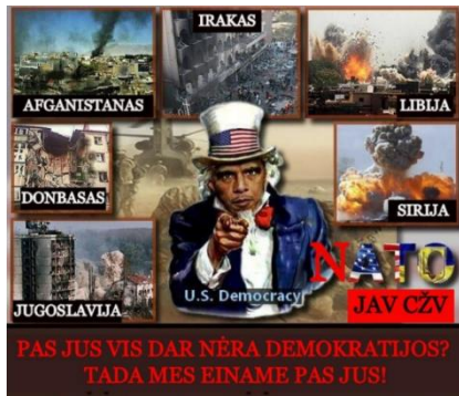
Paveikslas 35: internetinis memas – informacijos šaltinių kritika