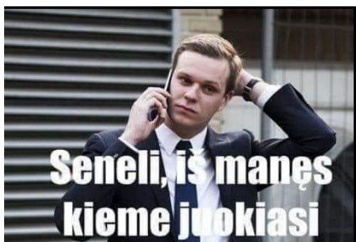
Paveikslas 17: internetinis memas - politinių veikėjų patyčios pavyzdys

anūkui, jog jis yra „prastumtas“ į partijos viršūnę. Viename meme implikuojama tai, kad Gabrielius Landsbergis tarsi skundžiasi dėl įžeidinėjimų ir pašaipų, o kitame internetiniame meme „Šeimos gynimo maršai“ tarsi lyginimai su nepriklausomybės atkūrimo mitingais, iš dalies galima manyti, jog paveikslas Nr. 18 yra mobilizuojantis internetinis memas, kuris ragina ateiti į mitingą. Apskritai protesto palaikytojų viešojoje erdvėje Landsbergių pavardė yra viena iš dažniausiai vartojamų, apie Gabrieliaus Landsbergio asmenybę kuriama nemažai internetinių memų.