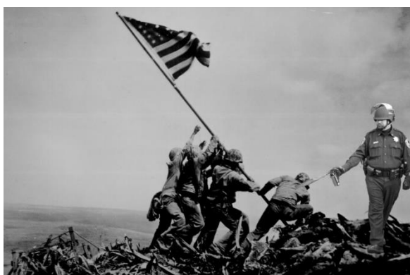
Paveikslas 8: Pepper spray cop internetinio memo pavyzdys

Šios plačios kategorijos iliustruoja, kaip internetiniai memai permaišo istorijos ir popkultūros vaizdus, kaip internetinis memas buvo panaudotas, kaip kritika prieš perteklinę policijos galią protesto metu ir kaip protesto užfiksuoti vaizdai virto internetiniais memais, o jie įgavo didžiulę reikšmę viso protesto mastu.