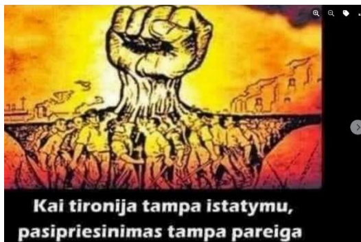
Paveikslas 37: internetinis memas – mobilizacijos pavyzdys