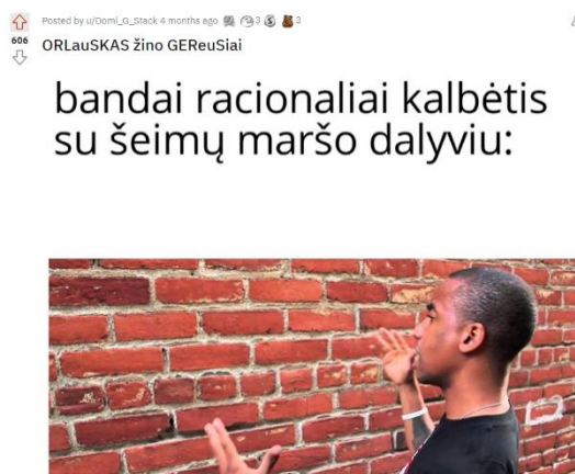
Paveikslas 43: internetinis memas – ironiškas pavyzdys

Internetiniame meme, kuris pavaizduotas paveiksle Nr. 42, matomas vyras, kuris atsisukęs į plytinę sieną ir tarsi kalbasi su ja, o tekste parašyta „bandai racionaliai kalbėtis su šeimų maršo dalyviu:“, taip panaudojant žinomą frazeologizmą mėginama ironizuoti, jog kalbėtis su protestuotoju yra tas pats, kas su siena, diskusija nevyks ir jokių atsakymų gauti nepavyks. Paveiksle Nr. 43 galime pamatyti internetinį memą, kurio tekste parašyta „Aš vėluodamas bėgu į troleibusą“, o nuotrauka tampa atsakymu į šią sąlygą ir pridedami žodžiai „Troleibuso vairuotoja, užtrenkdama man prieš nosį duris:“, o nuotraukoje matoma moteris, kuri demonstruoja nepadorius rankų gestus. Šiuo internetiniu memu norima parodyti, kokie nekultūringi asmenys reprezentuoja protestuotojus, ir pasityčioti iš jų veiksmų. Kritika įvelkama į kasdienę gyvenimiškąją situaciją ir dėl šio nesuderinamumo internetinis memas tampa juokingas.