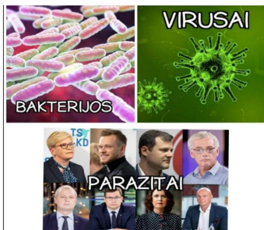
Paveikslas 9: internetinis memas - politinių veikėjų kritikos pavyzdys

delegitimizuoti TS-LKD. Šis atvejis įdomus dėl savo intertekstualumo nes užrašas „Mes puikiai prisimename“, atrodo, yra originalus rėmelyje, o užrašas „Kiekvieną jūsų nusikaltimą“ atrodo įklijuotas, taip pat galime pastebėti, jog nuotrauka paimta iš 2016 m. metų seimo rinkimų, tačiau ji taip pat įklijuota, nes TS-LKD 2016-2021 m. laikotarpyje sausio mėnesį nėra skelbusi tokios nuotraukos su neužmirštuolių rėmeliais ir užrašu „Mes puikiai prisimename“. Neužmirštuolės yra simbolis, kuris primena apie 1991 m. Sausio 13 d. įvykius Lietuvoje. Galima teigti, kad TS-LKD nekeltų tokios nuotraukos, kurioje yra plojama, juokiamasi ir šypsomasi, kai bandoma prisiminti apie tragiškus Sausio 13 d. įvykius. Dėl šių priežasčių galime manyti, jog būtent šis internetinis memas iš dalies yra dezinformuojantis ir nukreiptas prieš konservatorių partiją – elitą. Šis internetinis memas yra tarpdiskursinis, nes pažvelgus į jį, jis suteikia keletą konotacijų. Abejais paveikslų Nr. 9 ir 10 atvejais bandoma delegitimizuoti politinius veikėjus.