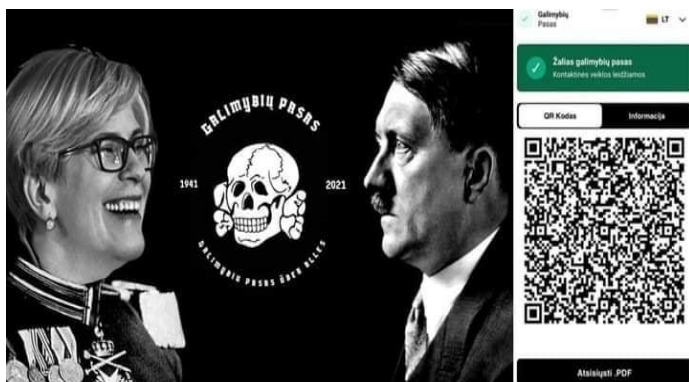
Paveikslas 12: internetinis memas - politinių veikėjų kritikos pavyzdys

pasas“, galimybių paso nuotrauka pridėta prie pagrindinės Šimonytės ir Hitlerio gretinimo nuotraukos. Internetinio memo pagalba protestuotojai siekia sulyginti Hitlerio sprendimus su Šimonytės, kaip Vyriausybės vadovės sprendimais, COVID-19 viruso valdymo priemonės prilyginamos holokaustui. Paveiksle Nr. 13 galime pamatyti, jog Šimonytė lygiai taip pat, kaip ir praeitame meme, reprezentuoja Adolfo Hitlerio asmenybę, nes ji aprengta nacistine uniforma, tik šiuo atveju ant jos veido „prilipdyti“ Hitlerio ūsai. Šiame internetiniame meme Šimonytė laiko švirkštą ir Dovydo žvaigždę, ant kurios parašyta „Galimybių žvaigždė“, ant politikės kairės rankos yra ne nacių raištis, o LGBT vėliavos raištis. Protestuotojai šiuo memu siekia sulyginti Šimonytę su Adolfu Hitleriu, taip pat bando sulyginti galimybių pasą su Dovydo žvaigžde, kurią žydų tautybės asmenys privalėjo nešioti getuose Holokausto metu. Nors galimybių pasas nėra susijęs su LGBT bendruomene, protestuotojai sujungia dvi temas viename meme, šis dviejų artefaktų sujungimas į vieną internetinį memą reprezentuoja prieš ką protestuoja memų kūrėjas.