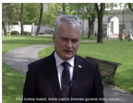
Paveikslas 23: internetinis memas – politiko kritikos pavyzdys

Kai draugas paklausia kodėl fotkinu jį girtą ir dedu į instagramą