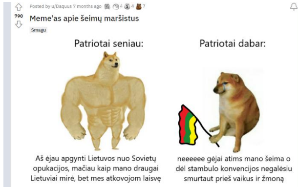
Paveikslas 41: internetinis memas – humoristinis pavyzdys

jei jį turėčiau“, taip buvo mėginama pabrėžti, kad protestuotojai yra iš silpnesnės ekonominės klasės bei žemesnio išsilavinimo.