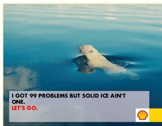
Paveikslas 7: Greenpeace akcijos Let's go memo pavyzdys.

„Greenpeace“ organizacija naudodama internetinius memus bandė delegitimizuoti „Shell“ planuojamus Arkties gręžimo veiksmus. Vienas iš delegitimizacijos veikslių buvo naudojama ironija. Svarbiausias ironijos bruožas yra tas, kad ji vienu metu išreiškia daugiau nei vieną prasmę – daugiau nei vieną perspektyvą. Galima pažymėti, kad ironijos „bendra savybė yra ką nors suprasti išreiškiant priešingybę.“ 80 Tai reiškia, kad „Greenpeace“ „Arctic Ready“ memai, kaip ir visi ironiški diskursai, reikalauja, kad internetinių memų kūrėjai ir žiūrovai rekonstruotų posakius su reikšmėmis, kurios skiriasi nuo tų, kurios matomos internetiniame meme. Pavyzdžiui paveiksle Nr. 7, „Greenpeace“ parodė baltąją mešką, kuri plaukioja vandenyje, šiame meme užrašyta „Aš turiu 99 problemas, bet kietas ledas nėra viena jų“.