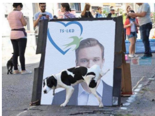
Paveikslas 19: internetinis memas - politinių veikėjų patyčios pavyzdys

Paveiksle Nr. 19 ant reklamos stende pavaizduotas Gabrielius Landsbergis, o ant to reklaminio stendo šlapinasi šuo. Internetinis memas nėra standartinis, nes nėra teksto, tačiau atitinka internetinio memo formą. Šiuo memu norima pasakyti, jeigu net šuo šlapinasi ant užsienio reikalų ministro, tai šis žmogus tikrai nėra gerbiamas visuomenėje. Kitu atveju galime galvoti, jog politinės reklamos tiesiog nusibodo internetinio memo kūrėjams, kad net šuo šlapinasi ant jo, tačiau įvertinus visą viešosios erdvės srautą, galime manyti, jog šiuo memu norima pasityčioti iš TS-LKD lyderio, prieš kurį yra nusistatę protestuotojų viešoji erdvė. Verta pabrėžti, jog internetinio memo formatas gana populiarus, nes į Gabrieliaus Landsbergio nuotraukos vietą galima įdėti bet kokią nuotrauką.