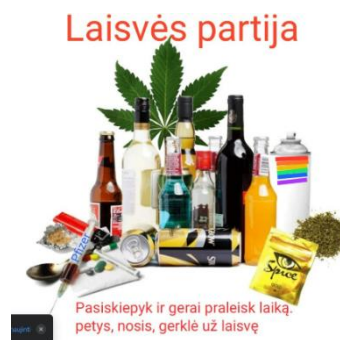
Paveikslas 46: internetinis memas – įžeidžiantis pavyzdys