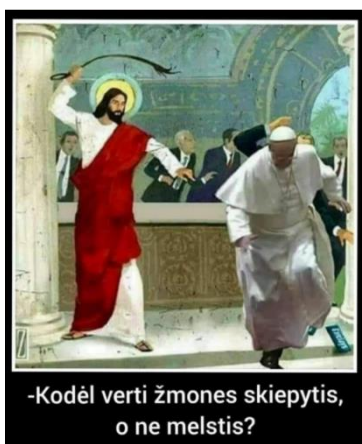
Paveikslas 20: internetinis memas – pasaulinio lyderio kritikos pavyzdys