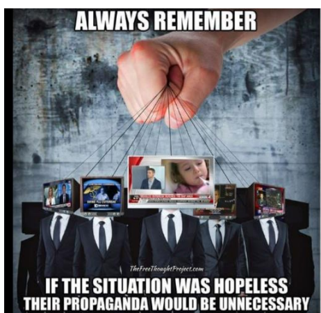
Paveikslas 33: internetinis memas – informacijos šaltinių kritika