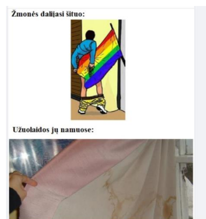
Paveikslas 32: internetinis memas – LGBT bendruomenės kritika