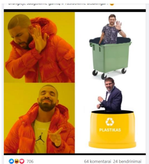
Paveikslas 26: internetinis memas – protesto lyderių kritikos pavyzdys