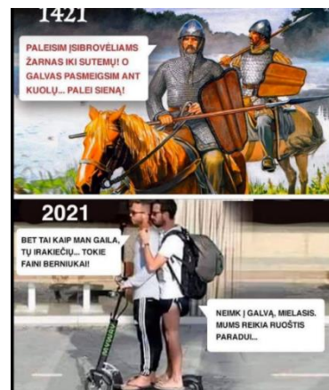
Paveikslas 30: internetinis memas – LGBT bendruomenės kritika

Protesto kritikų viešojoje erdvėje buvo galima pamatyti LGBT bendruomenę palaikančius interneto memus, taip pat ir kritiką protestuotojams: buvo bandoma sumenkinti protestuotojų socialinį statusą, demonstruojant, kad jie yra netvarkingi ar gyvena skurdžiai, taip pat buvo atkreipiamas dėmesys į tai, kad protestuotojai prieš LGBT per daug reaguoja į LGBT bendruomenę. Pavyzdžiui, paveiksle Nr. 31 galime pamatyti jau seniau aptartą reperio Drake memo formatą, šį kartą šiame