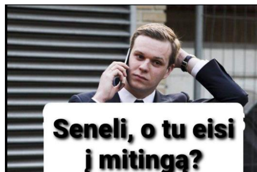
Paveikslas 18: internetinis memas - politinių veikėjų patyčios pavyzdys

Paveiksle Nr. 19 ant reklamos stende pavaizduotas Gabrielius Landsbergis, o ant to reklaminio stendo šlapinasi šuo. Internetinis memas nėra standartinis, nes nėra teksto, tačiau atitinka internetinio memo formą. Šiuo memu norima pasakyti, jeigu net šuo šlapinasi ant užsienio reikalų ministro, tai šis žmogus tikrai nėra gerbiamas visuomenėje. Kitu atveju galime galvoti, jog politinės reklamos tiesiog nusibodo internetinio memo kūrėjams, kad net šuo šlapinasi ant jo, tačiau įvertinus visą viešosios erdvės srautą, galime manyti, jog šiuo memu norima pasityčioti iš TS-LKD lyderio, prieš kurį yra nusistatę protestuotojų viešoji erdvė. Verta pabrėžti, jog internetinio memo formatas gana populiarus, nes į Gabrieliaus Landsbergio nuotraukos vietą galima įdėti bet kokią nuotrauką.