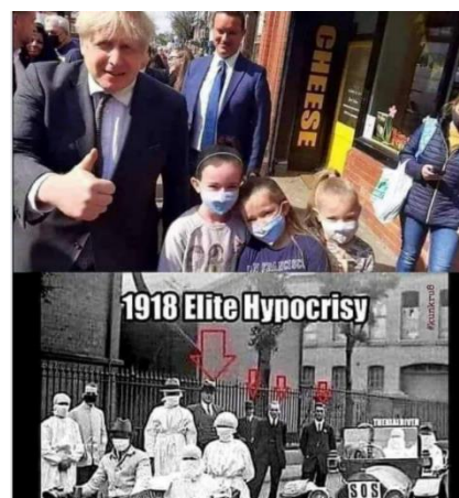
Paveikslas 21: internetinis memas – pasaulinio lyderio kritikos pavyzdys