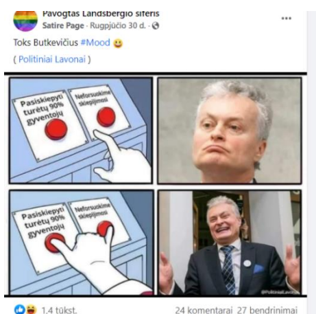
Paveikslas 3: Politinės satyros memo pavyzdys

Svarbu pabrėžti, jog politinis humoras yra svarbi politinio diskurso dalis visuomenėje. Internetiniai memai sujungia popkultūrą su politika, tai pritraukia ne tik politikoje dalyvaujančius žmones, bet ir padeda formuoti nuomonę tiems, kurie nėra aktyvūs politinių klausimų ir diskusijų dalyviai. 47 Įvairūs tyrinėtojai mini, kad politinio humoro poveikis padidina politinį dėmesį ir padeda sužinoti apie politines problemas. Politinių pramogų tyrimai parodė didelį poveikį politinių problemų, politikų ar institucijų vertinimo rezultatams. Tai taip pat padidina susidomėjimą politika. Be to, politinis humoras yra humoro ir vartotojų sukurto turinio derinys. Memų kūrimas gali būti kiekvieno žmogaus kūryba, todėl savotiškai atliepia visuomenės nuomonę. Pavyzdžiui paveiksle Nr. 3 pateikiamas politinės satyros internetinis memas, kuris kritikuoja Lietuvos prezidentą Gitaną Nausėdą dėl jo skirtingų nuomonių apie vakcinaciją, jis internetiniame meme atrodo laimingas, kai paspaudžia du mygtukus, viename parašyta „pasiskiepyti turėtų 90% gyventojų“, kitame parašyta „neforsuokime skiepijimo“. Šios dvi citatos yra paties Nausėdos pasakytos skirtingu laikotarpiu. Šis internetinis memas atitinka tiek žaismingumo, tiek pranašumo savybę, nes šiame internetiniame meme žaismingai sulyginamos dvi Gitano Nausėdos nuotraukos ir citatos, o pranašumo savybė atkreipia dėmesį į Gitano Nausėdos negalėjimą apsispręsti, kaip turėtų būti vykdoma vakcinacija.