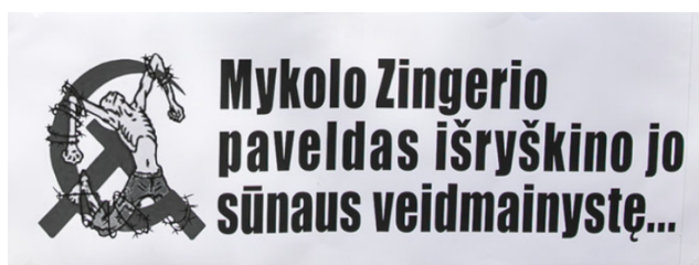
Paveikslas Nr. 2. Protestuotojų plakatas „Mykolo Zingerio paveldas išryškino jo sūnaus veidmainystę...“ 209

Taip pat netrūko ir neigiamai vaizduojamos sovietinės simbolikos arba nuorodų į komunizmą. Pavyzdžiui, vienas iš plakatų skambėjo taip: „Komunistų partijos paveldas atgyja“. Vienas išraiškingesnių mitinge naudotų simbolių – plakatas su užrašu „Mykolo Zingerio paveldas išryškino jo sūnaus veidmainystę...“ ir šalia pavaizduotu ant sovietinio kūjo ir pjautuvo spygliuota viela surištu nukryžiuotu žmogumi.