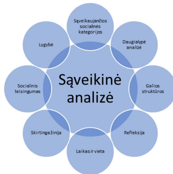
2 pav. SĄVEIKINĖS ANALIZĖS ASPEKTAI

Sąveikos analizė apima šiuos aspektus (žr. 2 pav.) 32 :