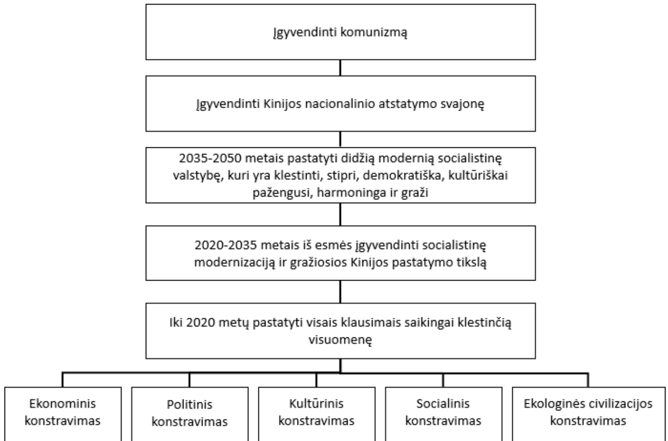
3 pav. Kinijos nacionaliniai prioritetai, įskaitant ir nuo 2012 metų įtrauktą ekologinės civilizacijos statymą. Sudaryta pagal Huang ir Westman, 2021

įrašyta į KKP konstituciją bei ekologinės civilizacijos statymas tapo oficialia Kinijos politinės filosofijos sudedamąja dalimi (žr. 3 pav.).