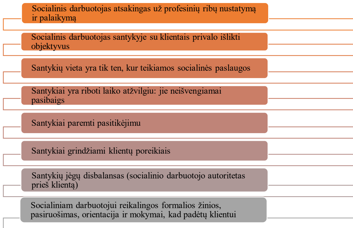
2 pav. Socialinio darbuotojo ir kliento santykiams būdingi bruožai

Calcaterra (2014) pabrėžia socialinių darbuotojų ir paslaugų vartotojų tarpusavio priklausomybę, kai abi šalys į susitikimą atsineša savo patirtį ir kontekstą, padėdamos pasitikėjimo ir dinamiškų santykių pagrindus. Socialinio darbuotojo ir kliento santykiams būdinga: