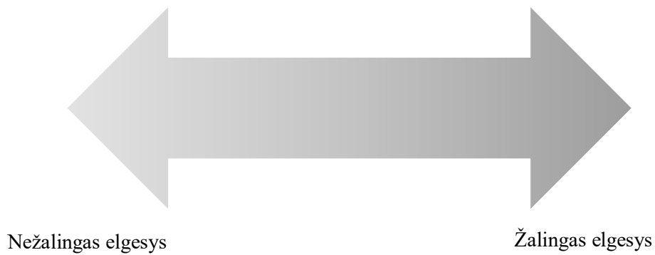
3 pav. „Pilkos zonos“ skalė. Šaltinis: sudaryta autorės remiantis Cooper 2012

Ramus ir pagarbus elgesys, kliento išklausymas, pagalbinio socialinio darbuotojo vaidmens priminimas klientui, užuojauta, ribų nustatymas ir išlaikymas yra itin svarbūs susidūrus probleminėse situacijose. Išryškėja jautri socialinio darbuotojo atvirumo su klientu riba. Būtina nustatyti ir palaikyti socialinio darbo ribas, siekiant apsaugoti socialinius darbuotojus, klientus ir organizaciją, kurioje jie dirba, ir išvengti emocinio streso (Rollins 2020). Todėl galima teigti, kad daugelis profesiniam elgesiui taikomų apribojimų kuria saugius, atvirus, stabilius, skaidrius santykius, aiškiai pagrįstus kliento poreikiais. Svarbu, kad socialinio darbuotojo santykiai su klientu būtų profesionalūs, paremti sąveika ir bendradarbiavimu ir būtų laikomasi abipusiai sutartų taisyklių Komandinis darbas, diskusijos su kolegomis ir viršininkais, refleksija, mokymai padeda socialiniam darbuotojui gerinti bendravimą ir plėsti santykių su klientais perspektyvas.