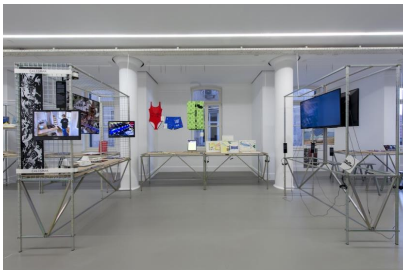
2 pav. „Išgyventi“, SulSolSal, 2016-2018, Stambulas.

Tarpdisciplininis ir episteminis projektas, pavadintas „Išgyventi“, išėities tašku pasirinko visuomenę užvaldančią nuolatinę nerimo būseną dėl klimato kaitos, politinio perversmo ir ekonominio nestabilumo, jaučiamą kaip apokalipsės artėjimas. Projekto autoriai teigė, kad vyriausybė yra susirūpinusi galios santykių išlaikymu, o verslas, jausdamas desperaciją, kaip tik aktyvina pelno ištraukimą. Taigi, pats laikas laisvalaikiu kurti „neo-išgyvenimo“ strategijas taip vadinamai „trūkumo ateičiai“, kuri neišvengiama, nes žemė baigtinė, taigi apokalipsė įvyks ir tai pasireikš įvairiausių išteklių trūkumu. „Išgyventi“ remiasi tęstiniu dizaino tyrimu apie tai, kaip visuomenė prisitaiko ir mokosi rengdamasi ateičiai. Kartu su tyrimu „neo-išgyventojų“ bendruomenėse ir keistais komerciniais produktais, kuriais aprūpinamos šios bendruomenės, instaliacija įtraukė eilę dizainerių ir menininkų, kurių provokacijos kėlė iššūkius fatalistinėms ateities trajektorijoms.