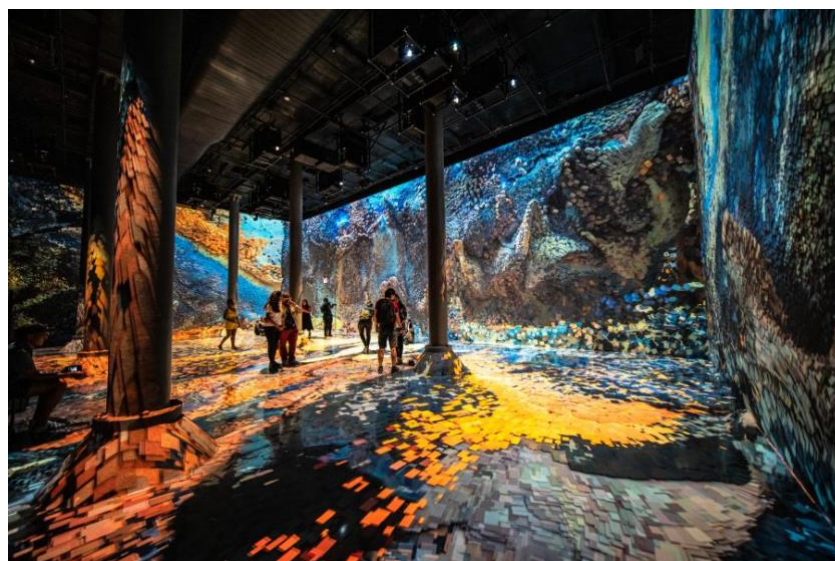
8 pav. „Mašinos haliucinacijos“, Refik Anadol, 2021, Stambulas.