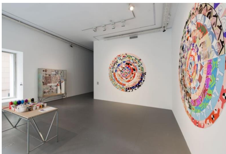
3 pav. „Žemės drebėjimo diplomatijos mokykla“, 2018, Stambulas, IKS V nuotr.

Ekspozicija, pristačiusi dar vieną tęstinį dalyvaujančio meno projektą, buvo pavadinta Žemės drebėjimo diplomatijos mokykla. Pristatyme teigta, kad projektas per analogišką patirtį, būtent 1999 m. drebėjimus Turkijoje ir Graikijoje, kaip labai ryškius geologinius ir politinius įvykius, sujungia šias valstybes (jutimų ir vaizduotės plotmėje). Projektas kėlė tikslą apjungti abiejų pusių (turinčių neišspręstą sienos klausimą) išteklių koordinavimą ir inicijuoti ilgalaikį tyrimą tikslu pasiruošti ateities įvykiams. Dirbtuvių Atėnuose ir Stambule metu buvo renkami žmonių prisiminimai iš drebėjimų laiko. Dirbtuvių dalyviai kartu kūrė paveikslus primenančius žemės drebėjimų epicentrus, sluoksniuodami su ornamentais ir simboliais, kurie būtų bendri priešiškų valstybių žmonėms ir megztų dialogą. Projekte buvo klausama, kaip atsiminimai tampa kasdienio gyvenimo audiniu, lemiančiu, kaip mes veikiame miestuose ir kaip susirišame su miestais, valstybėmis ir vienas kitu, taigi afektualiū asambliūžu, brėžiančiu naujų sąveikų kryptis, transversaliai kertančias nacionalinius, teritorinius asambliūzus.