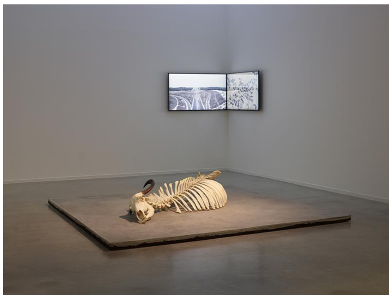
6 pav. „Monochromas“, Ozan Atalan, 2019, instaliacija (betonas, dirva, video, vandeninio buivolo skeletas), Stambulas.

Ozan Atalan darbai žvelgia į ekspansines žmogaus veiklas ir spekuliatyviai atsako nežabotam civilizaciniam augimui ir gamtos nykimui. Instaliacija „Monochromas“ skirta sunaikintai vandeninių buivolų buveinei. Naujojo Stambulo oro uosto, trečiojo tilto per Bosforą statybos ir urbanistinė intervencija į šiaurinius