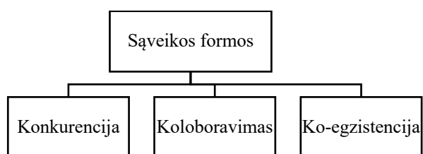
3 paveikslas. Nevalstybinių veikėjų ir valstybinių struktūrų atstovų sąveika.

Nevalstybinių veikėjų santykiai su valstybe nebūtinai tapatūs santykiams žemesniame lygmenyje, kada nevalstybiniai veikėjai ir valstybinių struktūrų atstovai tiesiogiai sąveikauja kovos lauke. Valstybinių struktūrų atstovai ir nevalstybiniai veikėjai gali konkuruoti, kolaboruoti ar koegzistuoti . Konkurencija gali atsirasti dėl resursų, ar kai kuriais atvejais dėl atsakomybių persidengimo. Konkurencija pabrėžia nesaugią partnerystę, o bendradarbiavimas tampa ribotas, ir priklauso nuo tarpasmeninių santykių tarp pareigas einančių asmenų ir jų politinių globėjų. Tai reiškia, kad konkurencija ir konfliktai riboja bendradarbiavimą, o tinklų kūrimasis pasireiškia pasirinktinio bendradarbiavimo ir periodiškų bendrų intervencijų forma. 36 Vis dėlto, valstybinių struktūrų atstovai gali matyti galimybes bendradarbiauti su nevalstybiniais veikėjais, įvertindami nevalstybinių veikėjų patirtį, žinias ir pasirengimą. 37 Šiuo atveju santykis gali būti nestructūrizuotas, nereguliarus ir dažnai paskatintas tarpasmeninių, o ne tarpinstitucinių interesų. 38 Taip pat tarp šių veikėjų gali atsirasti trintis. Pavyzdžiui, dažnai iškyla įtampų tarp privačių karinių kompanijų darbuotojų ir valstybinės kariuomenės pajėgų. Valstybės saugumo ir gynybos sistemos pareigūnai gali matyti privačias grupes, kaip turinčias žemesnę kvalifikaciją ir patirtį, o privačios grupuotės gali manyti, kad priežastys, dėl kurių jų paslaugos yra reikalingos, tai valstybinių struktūrų nekompetencija ir nepakankamumas. 39