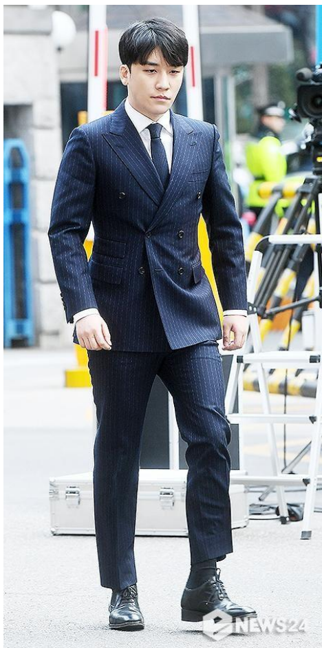
Priedas 4. Nuotrauka iš analizuojamo straipsnio, kaip papildoma vaizdinė medžiaga. Seungri, “Burning sun” klubo vienas iš buvusių savininkų.

열심히 일해야 승리대표랑사진 찍징 🤗🤗🤗👍👍👍 이번주 개취했 다가 열일.