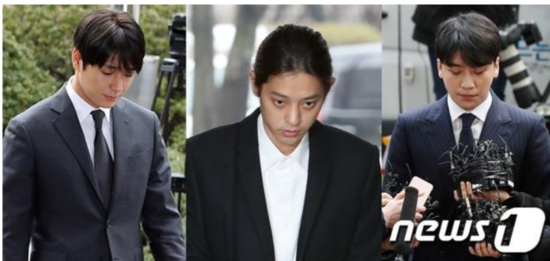
Priedas 8. Nuotrauka iš analizuojamo straipsnio, kaip papildoma vaizdinė medžiaga. KakaoTalk poklabio kambario nariai.