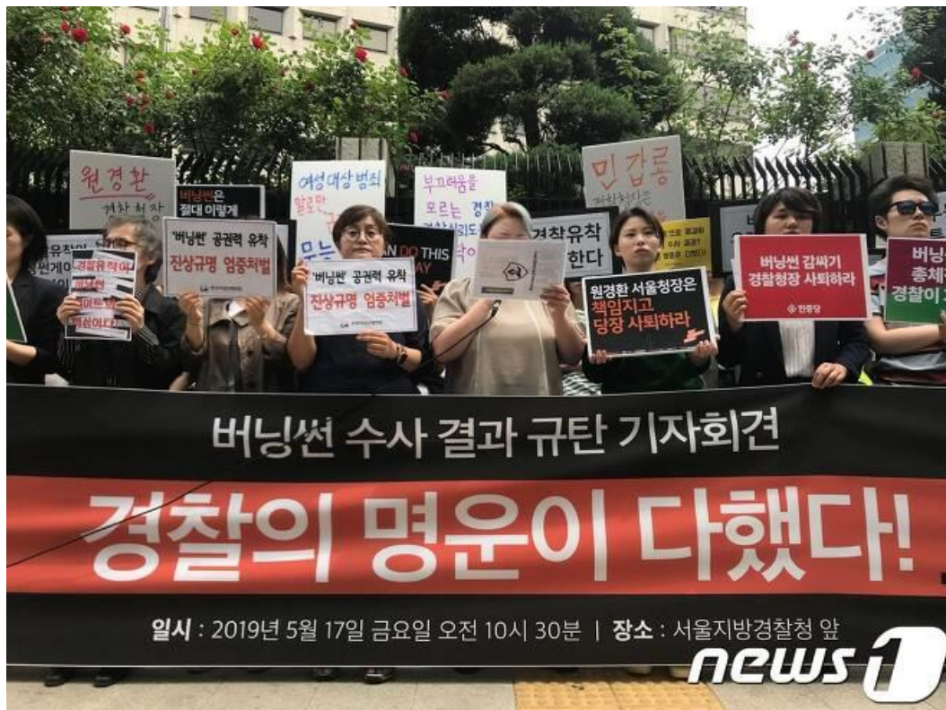
Priedas 10. Nuotrauka iš analizuojamo straipsnio, kaip papildoma vaizdinė medžiaga. Moterų asociacijų streikas po "Burning sun" incidento.