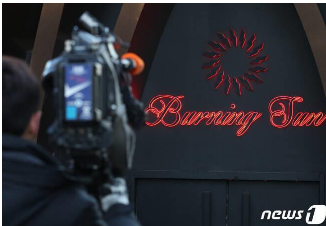
Priedas 11. Nuotrauka iš analizuojamo straipsnio, kaip papildoma vaizdinė medžiaga. "Burning Sun" klubo ženklas.