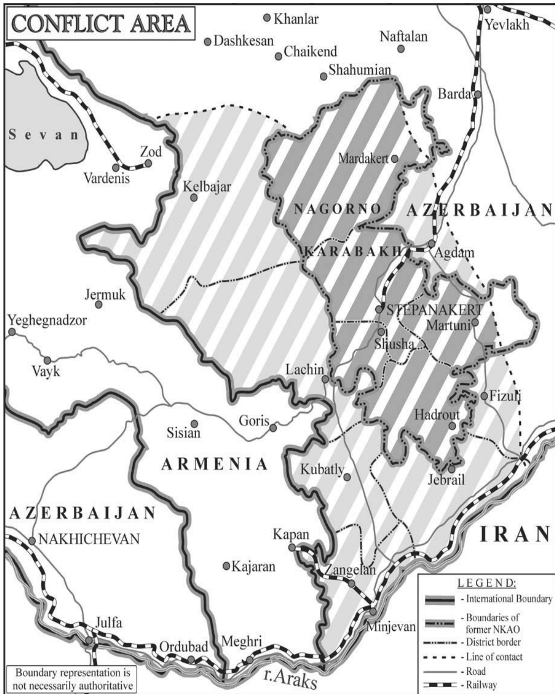
Priedas Nr.2. Kalnų Karabacho konflikto zonos žemėlapis 200 .