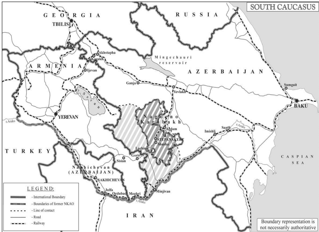
Priedas Nr.1. Azerbaidžano, Armēnijos ir armēnų okupuotų Azerbaidžano teritorijų žemėlapis 199 .