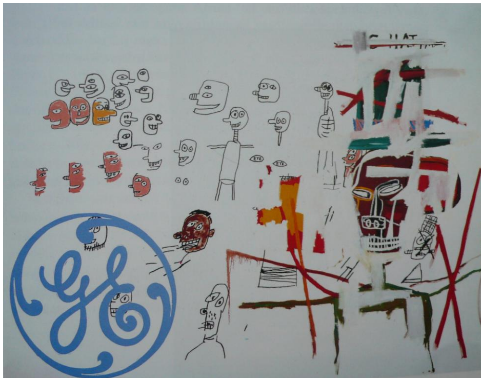
Jean-Michel basquiat, Andy Warhol. Bendradarbiavimas (1984)

Meno istorijoje minima keletą faktų, kai skirtingų stilių dailininkai tapo bendrus paveikslus. Štai Edward Lucie-Smith savo knygoje „Meno kryptys nuo 1945-ųjų“ rašo: „Dviejų menininkų (Jean-Michel Basquiat, Andy Warhol) sukurti paveiksliukai, pavyzdžiui, „Bendradarbiavimas“ (1984), dažnai atrodo kaip mūšio laukas, kur kaunamasi dėl paveiklo erdvės; čia rungtinasi iš esmės nesuderinami pavidalai, bandydami kiekvienas kuo stipriau paveikti žiūrovą. Paprastai, kaip ir šiame paveiksle, Basquiatas savo fanatiška energija užgožia vyresnįjį partnerį, kuris imasi teptuko daug labiau atsipalaidavęs, tad tai, ką mato žiūrovas, yra daugiau Basquiatas nei Warholas“ (Smith 1996).