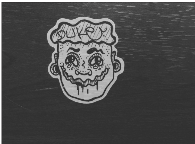
7 pav. Mokinių sukurtas ir priklijuotas lipdukas ant futbolo stalo oficialiai įrengtoje mokinių erdvėje

nai. Ant abiejų lipdukų yra užrašas Duke (angl. – kunigaikštis, hercogas ). Sunku pasakyti, ką iš tiesų galėtų reikšti šis užrašas ant lipdukų, nes tyrimo metu nepavyko pabendrauti su lipdukus kūrusiais mokiniais. Lipdukų klijavimą būtų galima sieti su dažniausiai vaikinų noru parodyti savo svarbą ir galią, o galbūt ir „pažymėti“ savo teritoriją mokykloje. O jei šių lipdukų kūrimas ir klijavimas siejamas su gatvės meno išraiška, tada akivaizdu, kad mokykloje jie buvo klijuojami be leidimo t. y. siekiant sulaužyti egzistuojančias taisykles. Vienas iš mokinių interviu metu aiškino, kad klijuoti lipdukai: