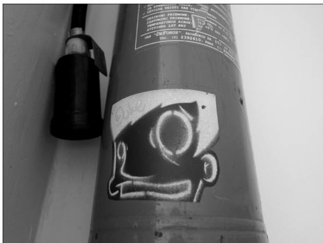
6 pav. Mokinių sukurtas ir priklijuotas lipdukas ant gesintuvo

Mokinių kurti ir klijuoti lipdukai turi užuomazgų su vienos iš gatvės meno (angl. – street art ) formų – lipdukų meno (angl. – sticker art ) judėjimu. Gatvės menas apibrėžiamas kaip vizualinis menas, kuris kuriamas viešose erdvėse dažniausiai be oficialaus leidimo (Oxford Dictionaries, 2016). Kaip matyti abiejose nuotraukose (6 pav., 7 pav.), lipdukuose yra pavaizduoti vaiki-