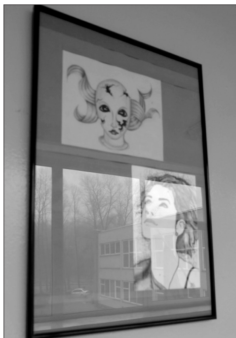
5 pav. Darbas iš mokinės grafikos darbų parodos, kurią organizavo dailės mokytoja

administracijos, mokytojų ar asmenų, ateinančių iš išorės, todėl mokiniams gali būti suteikiama daugiau laisvės kurti erdvę, kuri išreikštų ne tik mokyklos, bet pačių mokinių pasaulėžiūrą ir vertybes.