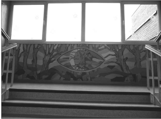
2 pav. Mokinių kurtas dailės darbas matomas iš koridoriaus prie įėjimo

gamtos, medžio / augalo vaizdavimo motyvai, naudojamos „prigesintos“ spalvos. Šie mokinių darbai iškart pastebimi tik įėjus į mokyklą pro pagrindines duris. Atrodytų, tai skirtingos mokyklos, tačiau panašu, kad galioja tam tikri bendri požūriai į kuriamus mokinių artefaktus. Siekiant suprasti šių dviejose mokyklose rastų artefaktų panašumą, verta pažvelgti į M. Foucault idėjas apie norminimą ir disciplinavimą, kuris riboja kūrybiškumą. Autorius (1998) teigė, kad disciplinavimo sėkmę įvairiose institucijose, tarp jų ir mokyklose, paaiškina naudojamų priemonių paprastumas: hierarchinė priežiūra ir normalizuojanti sankcija. Kalbėdamas apie normalizavimą, M. Foucault pabrėžė, kad: