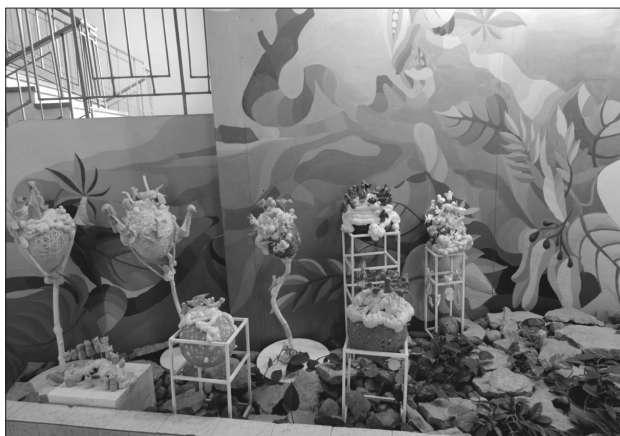
1 pav. Mokinių dailės darbai koridoriuje prie įėjimo

Žvelgiant į šiuos mokyklose ant sienų nutapytus mokinių piešinius, galima pastebėti tam tikrų panašumų: juose matyti