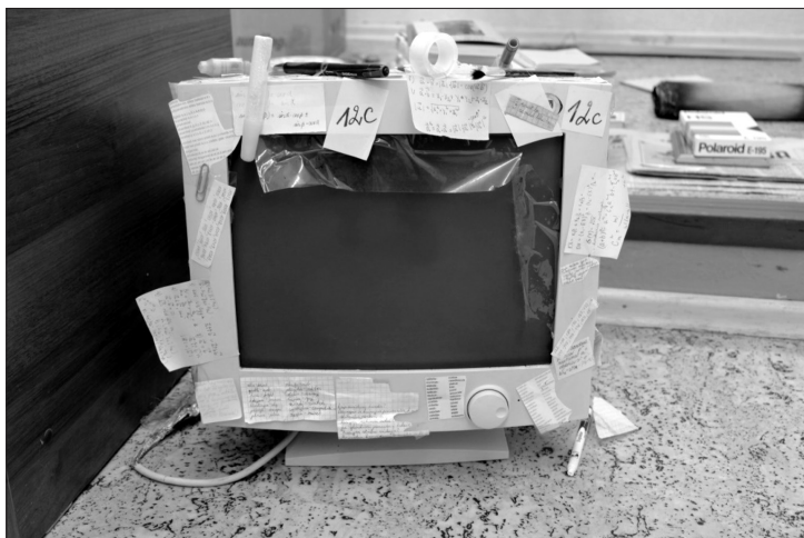
8 pav. Mokyklos archyve stovinti abiturientų atminimo dovana – kompiuteris, apklijuotas įvairių dalykų (biologijos, matematikos, anglų kalbos ir kt.) „paruoštukais“