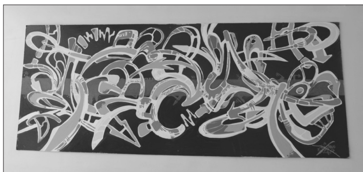
3 pav. Paveikslas, kabantis oficialioje mokiniams skirtoje erdvėje

Viena vertus, abu meno darbai kabo tose mokyklos vietose, kuriose dažniausiai renkasi tik mokiniai. Taigi galima manyti, kad šie mokinių darbai padeda sustiprinti šių mokyklos erdvių (sukurtosios mokinių erdvės ir drabužinės) priklausymą būtent mokinių bendruomenei. Kita vertus, kadangi mokykloje įkurta mokinių erdvė ir drabužinė yra mažiau lankomos mokyklos