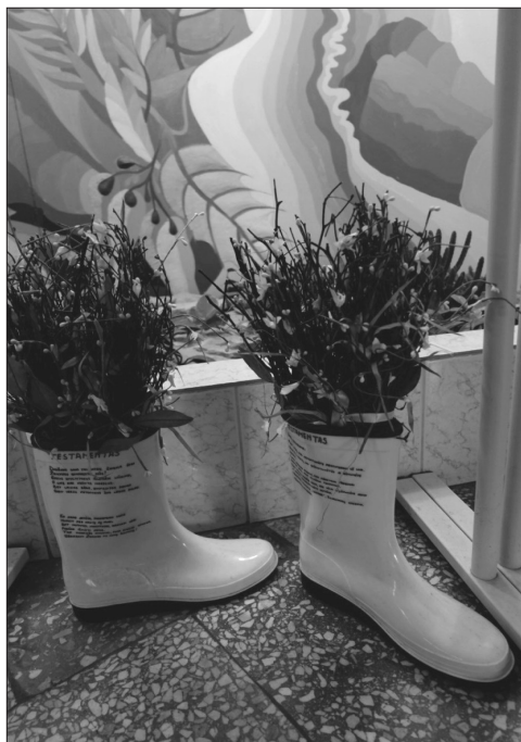
9 pav. 2012–2013 metų laidos abiturientų testamentas I

būsimiems abiturientams (su nurodytais vardais) buvo pridėti rašikliai, jie būsimos kartos abiturientų nebuvo paimti. Ryškėja, kad mokyklose abiturientų simbolinės atminimo dovanos ne visada vertinamos ir eksponuojamos bendruomenei, primenant apie buvusių abiturientų išmonę ir palinkėjimus. Kartais daug kūrybinių pastangų ir išmonės reikalaujantys testamentai tampa mokyklų muziejų, bibliotekų „puošmena“ ir iškeliauja į užmarštį, retai juos vėlesnėms kartoms prisimenant. O abiturientų pirkto materialinės dovanos tampa svarbesne dovana nei simbolinės, pačių sukurtos dovanos. Kaip keliose mokyklose apie abiturientų materialinių dovanų įteikimą pasakojo mokiniai: