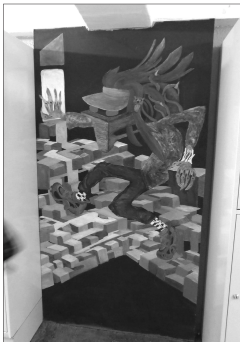
4 pav. Paveikslas, kabantis mokyklos drabužinėje