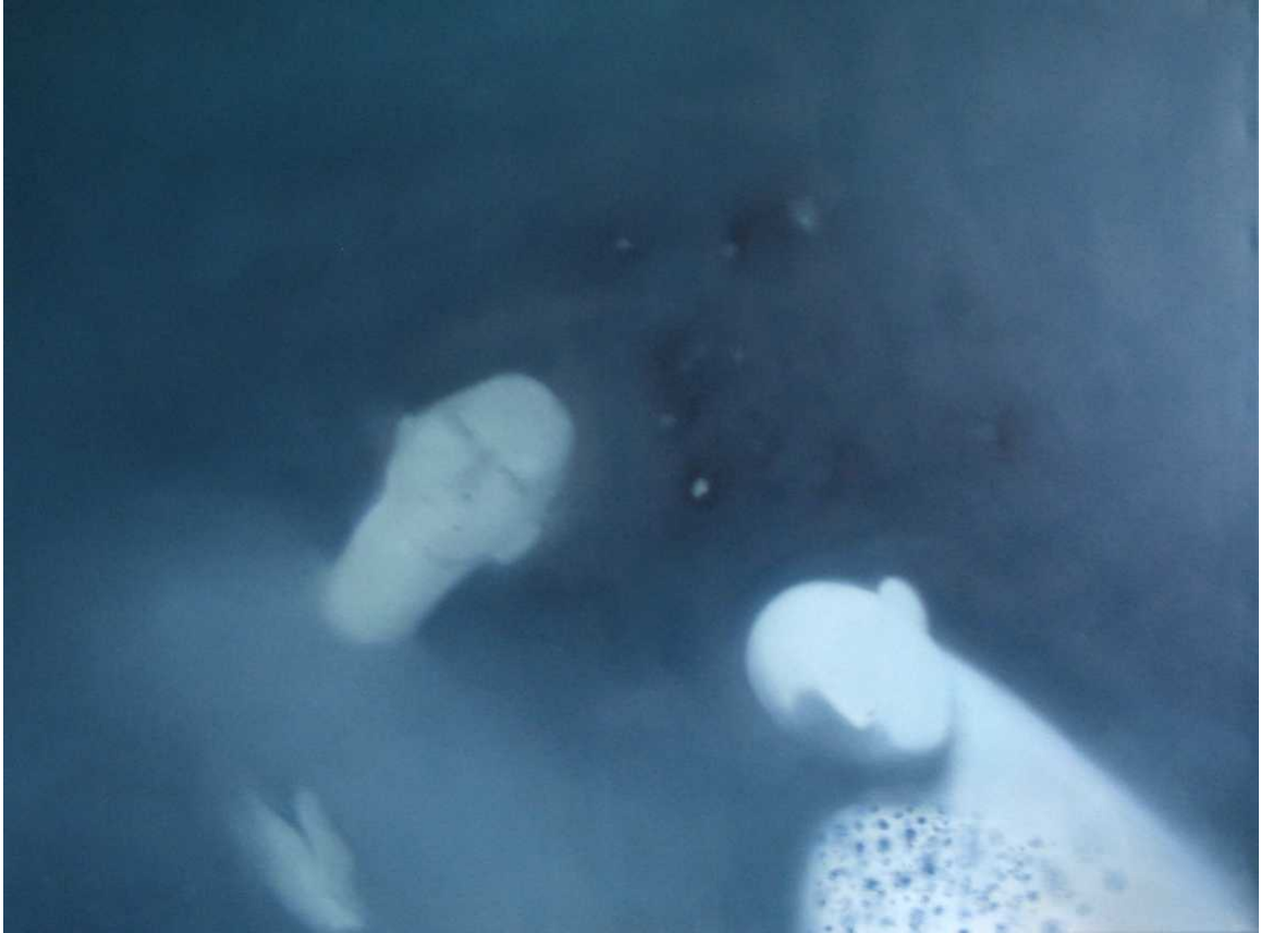
3 paveikslas 90x120 drobė, aliejus