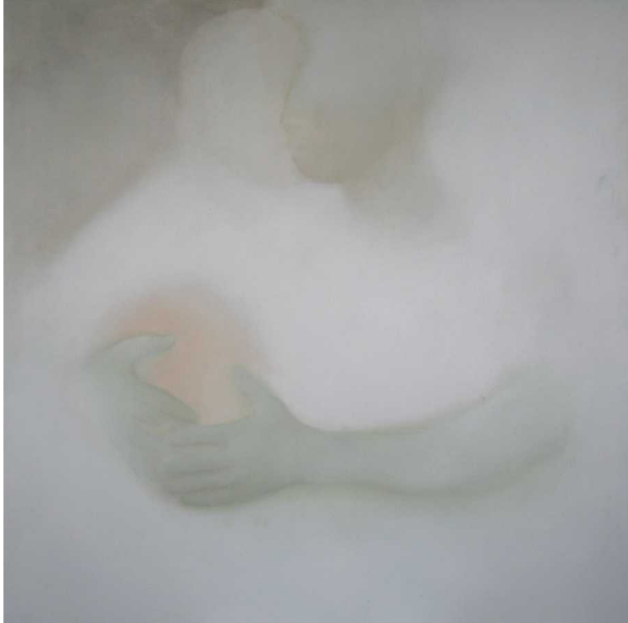
8 paveikslas 100x100 drobė, aliejus