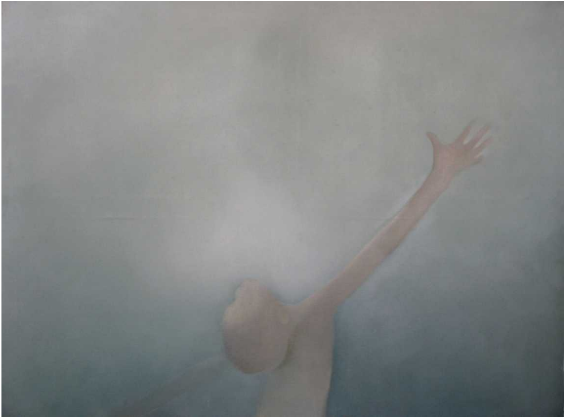
2 paveikslas 90x120 drobė, aliejus