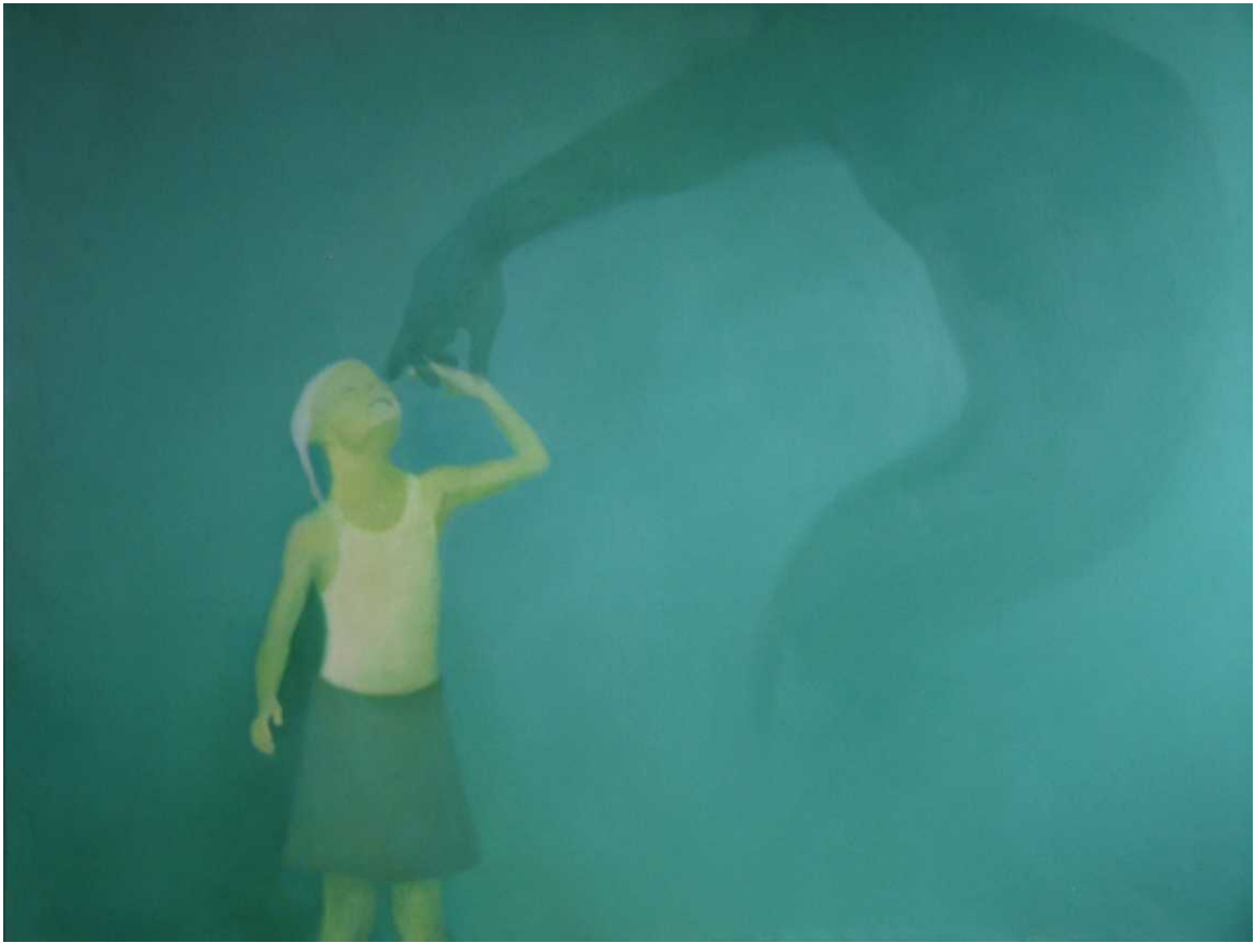
1 paveikslas 90x120 drobė, aliejus