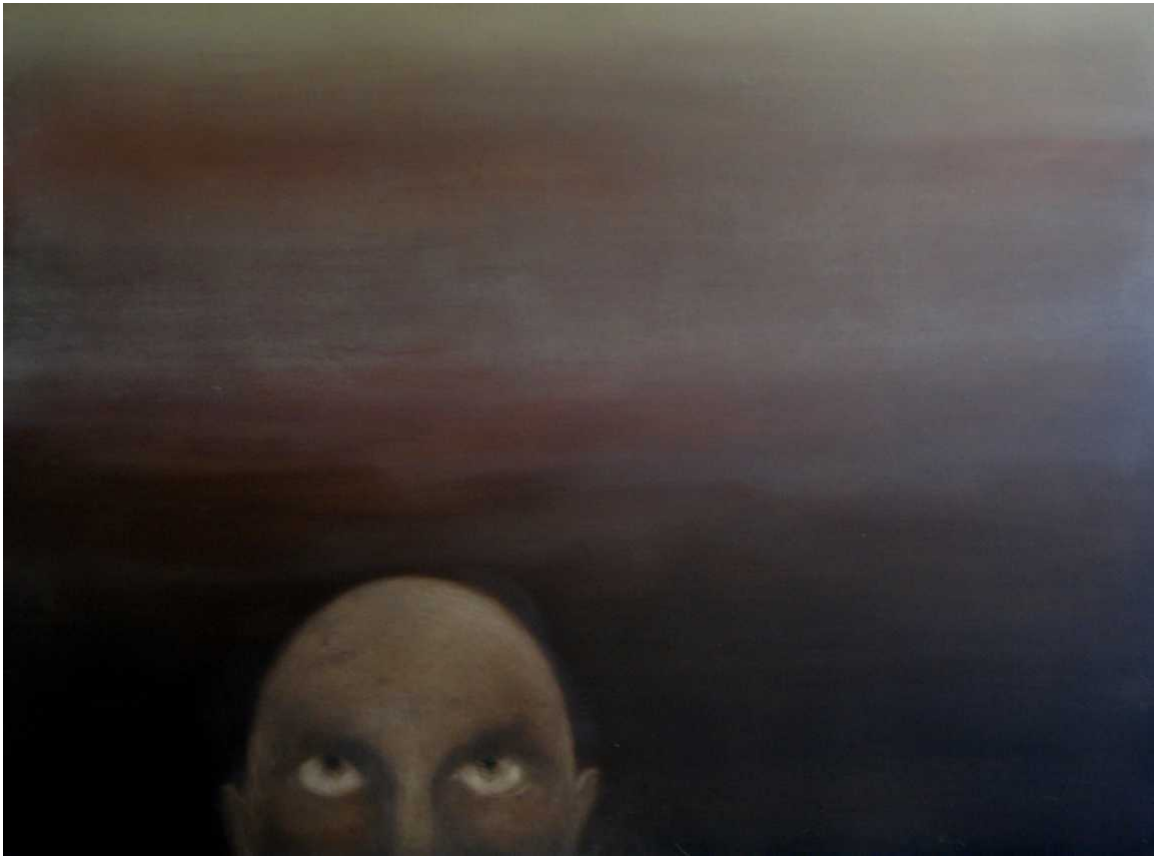
6 paveikslas 90x120 kartonas, aliejus