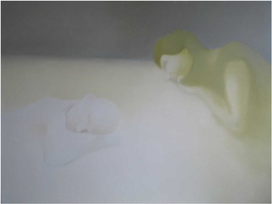
7 paveikslas 90x120 drobė, aliejus