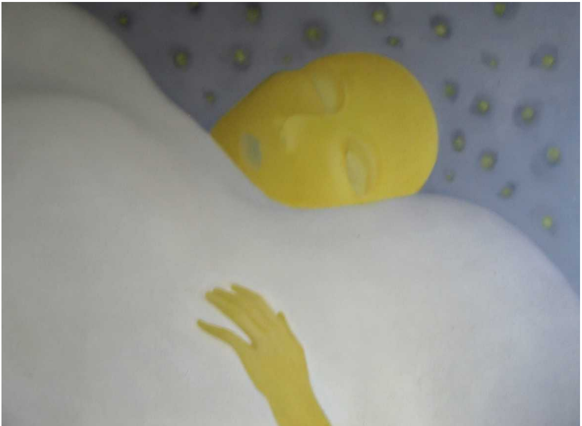
4 paveikslas 90x120 kartonas, aliejus