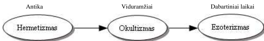
1 pav. Ezoterikos istorinė raida

Ezoterikos istorinė raida atsispindi žemiau pateiktame pirmajame paveiksle: