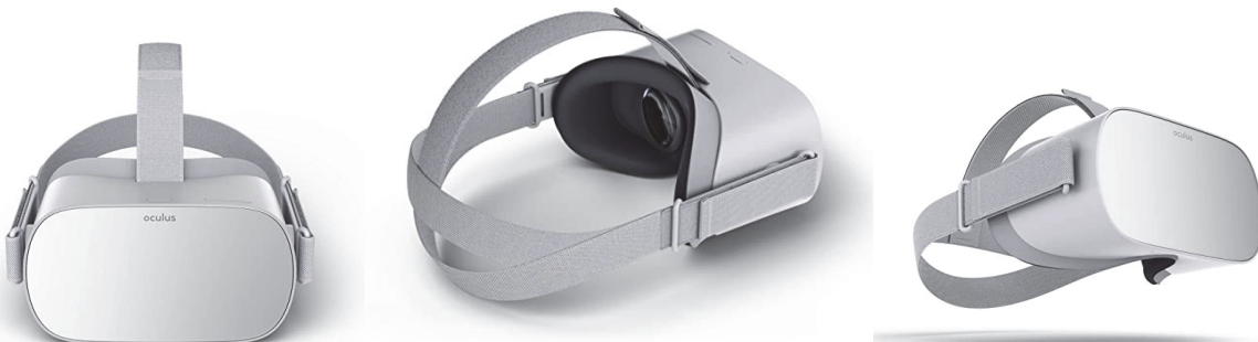
1 pav. 3D-VR akiniai ( Oculus Go 3D akiniai)

Atliekant statistinę analizę, kategoriniai kintamieji analizuoti naudojant \chi^2 testą arba Fišerio tikslumo testą, o nuolatiniai kintamieji išreikšti vidutinėmis (SD) reikšmėmis ir analizuoti taikant t testą. Rezultatai pateikti kaip dviejų proporcijų skirtumas. Analizei atlikti naudota SPSS programinė įranga, 26 versija ( IBM Corp ). Dviejų skaitmenų po kablelio p < 0,05 reikšmė laikyta statistiškai reikšminga. Visi duomenys analizuoti taikant ketinimo informuoti metodą. Statistiškai buvo lyginami kontrolinės ir tiriamosios grupių rezultatai.