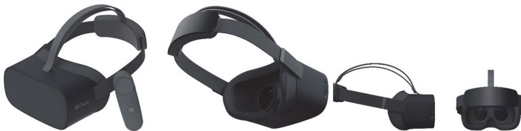
2 pav. 3D-VR akiniai ( Pico 3D akiniai)