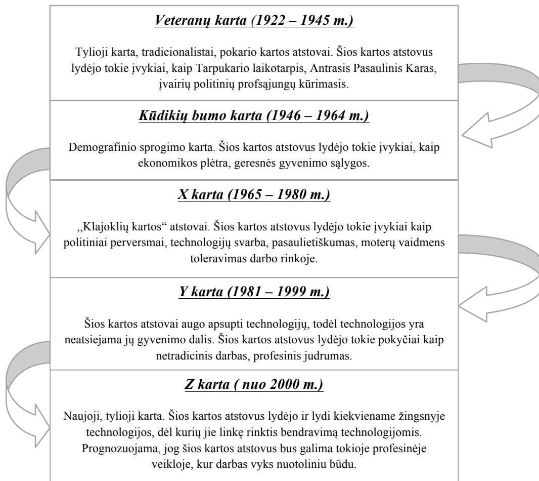
1 pav. Skirtingų kartų klasifikacija visuomenėje (parengta darbo autorės)

1 pav. pavaizduotos penkios kartos, kurių atstovai gali būti sutinkami šiandieninėje visuomenėje. Kiekvienos kartos era trunka maždaug 20 metų, todėl pateiktos kartos sudaro 100 metų ciklą. Kiekvienos kartos erą pažymi tam tikri įvykiai: Veteranų karta siejama su karų agresija, Kūdikių bumo karta siejama su demografiniu sprogimu, X karta siejama su technologijų bei moterų vaidmens darbo rinkoje išgalėjimu, Y karta neatsiejama nuo technologijų, tačiau ne taip, kaip neatsiejama Z karta, kuri pasiruošusi iškeisti tarpasmeninį bendravimą į bendravimą nuotoliniu/virtualiu būdu.