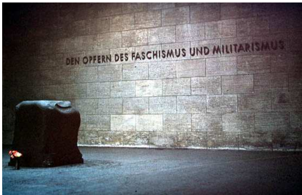
Nr.1 Neue Wache (Berlynas)

Šalia kolektyvinės aukos įvaizdžio, šių dienų paminklas turi atlikti ir visiškai naują, neįsivaizduojamą iki XX a. antros pusės vaidmenį – kolektyvinės atsakomybės jausmą. Vienas iš pavyzdžių, charakterizuojančių slinkti nuo herojinio iki „antiherojinio“ paminklo yra Neue Wache memorialas Berlyne. Friedrich'as Schinkel'is 1816-1818 m. suprojektavo pastatą-paminklą prūsų karinių dalinių pergalei prieš Napoleoną atminti. 1993 m. tuometinio Vokietijos kanclerio H. Kohl'io sprendimu buvo nutarta šiame pastate įkurti memorialą, skirtą fašizmo ir militarizmo aukoms. 44 (žr. nuotraukas nr. 1, 2, 3) Tokiu būdu, Vokietija tampa viena iš pavyzdžių kaip tautos paminklais turi reprezentuoti ne tik savo šlovės bet ir „gėdinguosius“ istorijos laikotarpius.