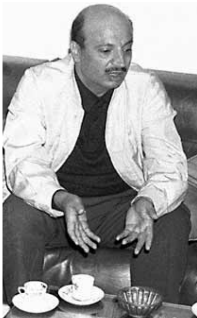
11. fotografija. Y. Arafatas be tautinių drabužių