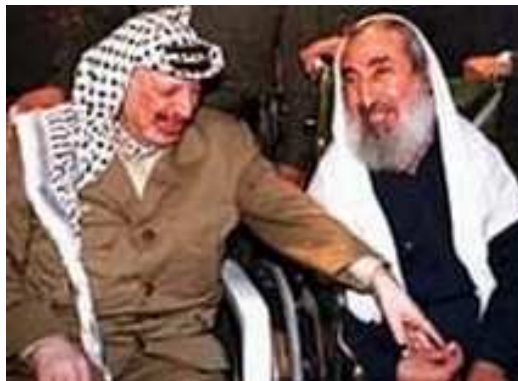
18. fotografija. Y. Arafatas ir A. Yasinas