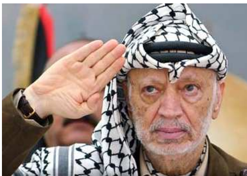
16. fotografija Y. Arafato portretas