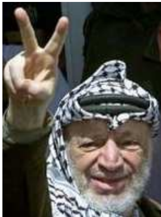
15. fotografija. Y. Arafatas rodo taikos ženklą