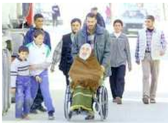
10. fotografija. A. Yasinas žmonių apsuptyje