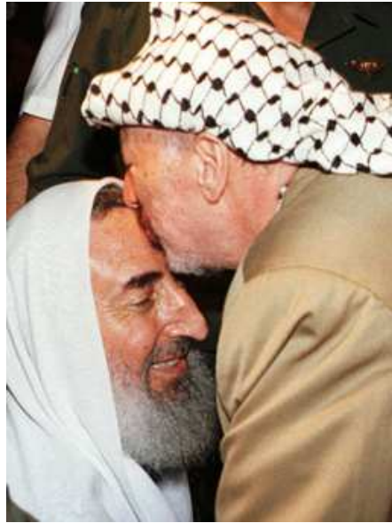
17. fotografija. Y. Arafatas bučiuoja A. Yasiną