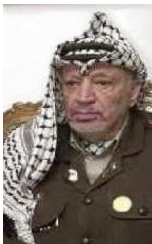
12. Y. Arafatas tradicine apranga