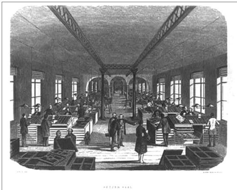
Rinkykla (zecerių salė), 1859.