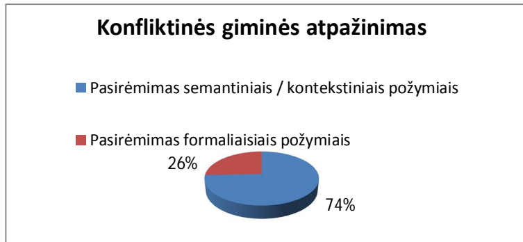
6 pav. Konfliktinės giminės atpažinimas

Bružaitė-Liseckienė, J. 2017. Lietuvių kalbos kaip svetimosios semantiškai motyvuotos daiktavardžių giminės atpažinimo klausimai. Taikomoji kalbotyra 9: 1–30. www.taikomojikalbotyra.lt