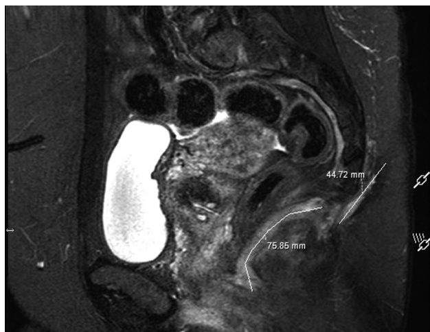
1 pav. Dubens organų MRT

Praėjus trims mėnesiams nuo apsilankymo VUL SK KP, pacientė hospitalizuota planine tvarka operaciniam absceso ir fistulių gydymui. Operacijos pradžioje į epitelinės landos išėjimo angą suleista metileno mėlynojo dažų.