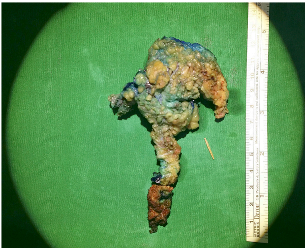
3 pav. Svetimkūnis ir kryžkaulio pleišto formos odos-poodžio lopas su pūliniu ir fistulėmis

Jie į tiesiąją žarną ar išangės kanalą nepateko. Fistulės ir abscesas pašalintas su odos lopu sveikų audinių ribose iki kryžkaulio ir išorinio išangės rauko, tiesiosios žarnos ir makšties, šių struktūrų nepažeidžiant (2 pav.). Pūlinyje šalia rauko rastas 1,5 cm ilgio adatos formos svetimkūnis (3 pav.). Po operacijos svetimkūnis buvo identifikuotas odontologės kaip odontologinis gražtas. Pacientė teigia prisimenanti, kad prieš keletą metų tokį gražtą prarado ją gydanti odontologė atlikdama procedūrą. Manoma, kad rastas svetimkūnis ir yra pagrindinis liekamosios infekcijos etiologinis veiksnys. Žaizda išplauta betadino tirpalu, drenuota dviem drenais, susiūta pavienėmis adaptacinėmis siūlėmis, jų nekabinant prie antkaulio.