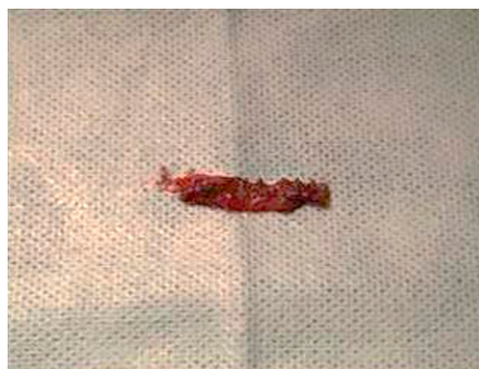
1 pav. Operacijos metu pašalintas buvęs raištis

Nutarta pacientę operuoti taikant spinalinę nejautrą ir atlikti pošlaplinio raiščio implantavimą užgaktiniu būdu (TVT būdu). Per makšties priekinėje sienoje atliktą 2 cm pjūvį, išdalinus iš randų šalia šlaplės esančius audinius, pašalinus buvusį raištį (1 pav.), abipus užgaktiniu būdu įkištos abi rinkinio adatos ir ištrauktos per odos pjūvius virš gaktos (2 pav.). Atlikta cistoskopija.