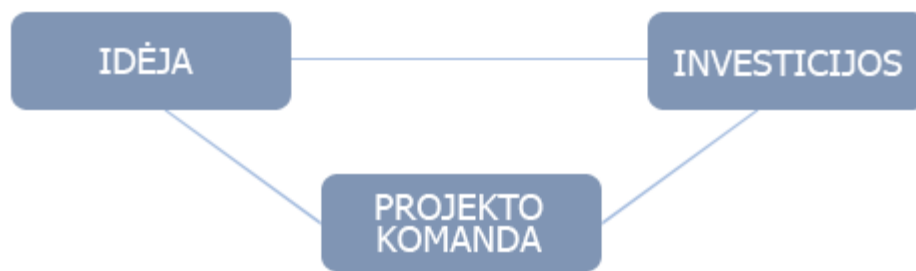
1 pav. Projekto įgyvendinimo veikslių grandinė