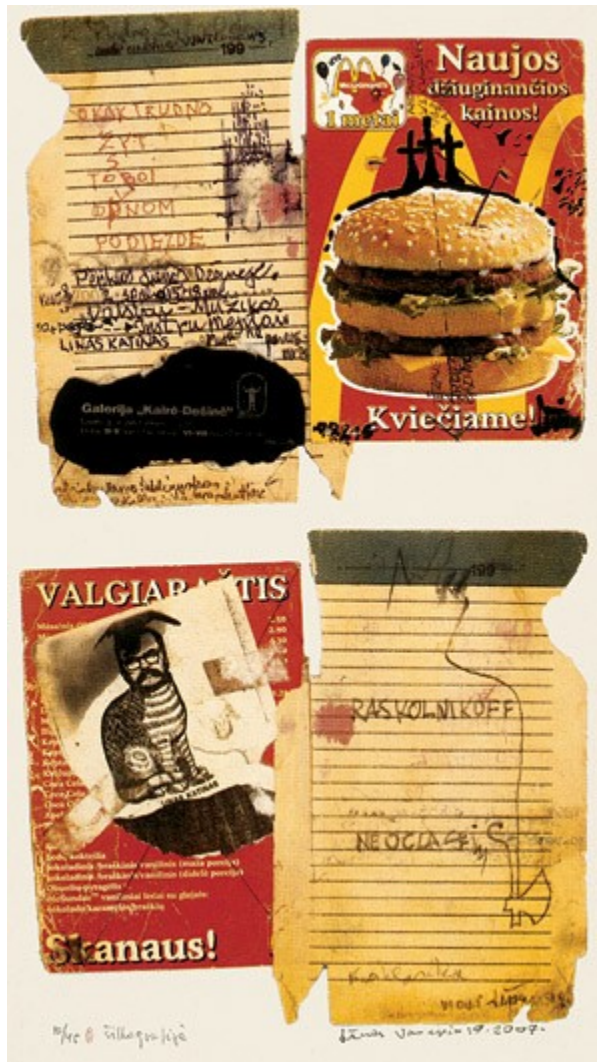
Linas Leonas Katinas. Vilniaus albumas. Sąsiuvinis Nr. 1. 2007, šilkografija, 60x45,2