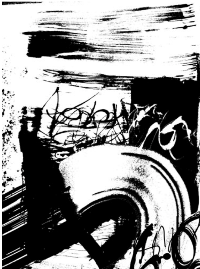
бpав., „Muzikos kaligrafija“

Delnuose įrašytas visas žmogaus gyvenimas, likimas. Uždėtas delnas tarsi įsiamžinimas, būties įprasminimas.