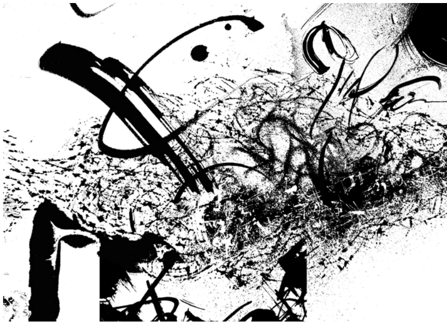
4 pav. „ Minčių veltinis “

Ne vienas yra patyręs tą keistai sunkų jausmą, kai galvoje susikaupusios įvairios, prieštaringos mintys spaudžia smegenis – „Minčių veltinis“, tai kompozicija, parodanti tokią situaciją. Faktūrų jungimas kuria erdvinę abstrakciją. Nemiga, besipinantys jausmai, sapnai, miesto triukšmas, greitas gyvenimo tempas – chaosas aplinkui sukelia chaosą galvoje. Chaotiškas sapnų ir fantazijų pasaulis nepavaldus realybei, slypintis giliai ir tik praradus budrumą kažkur netikėtai išsprūstantis į paviršių. Ryškus staigus potėpis tarsi spjūvis iš pasąmonės. Gali vaikščioti ant to debesies tarp išsibarsčiusių minčių ir bandyti sugrįžti į tašką, nuo kurio išsikerojo visos mintys. Taškas centre veikia raminančiai. Kompozicijoje išvelgiamas tvirtas ir stabilus pagrindas, tarsi žemė, du žmonės, kaminai, o virš visko sklando lengvi, plonų linijų ir storesnių linijų chaoso debesys – prieštaringos mintys. Ko žmogus veržiasi į kosmosą? Ogi tam, kad surastų save.