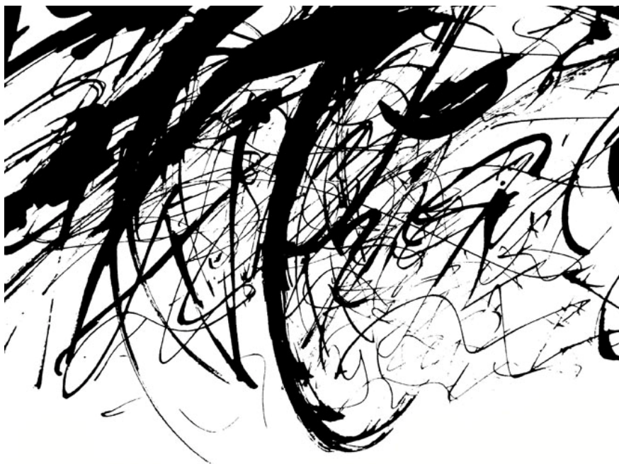
7 pav. „ Minčių, jausmų jūra “

Mūsų išgyvenimai, mintys, žodžiai, garsai neišvengiamai keliauja į kūrinį. Smulkūs dinamiški kaligrafiniai elementai kuria einančio garso išpūdį. Garsas, žodžiai, natos tarsi susilieja į storą, juodą liniją, kuri asocijuojasi su patefono juoda plokštele, sklinda iš jos ar į ją. Vyksta klausymosi, o gal įrašymo procesas. Analizuojant smulkius kaligrafinius elementus galime įžiūrėti net žmogeliukų figūrėles. Griežtas trikampis potėpis tarsi šonu pasisukęs žmogus su skrybėle, stebėtojas iš šalies. Kompozicijos dešiniajame kampe įžiūrimi du žmonės, jie tarsi bendrauja komunikuoja tarpusavyje. Per kaligrafines linijas kuriamas kalbėjimo procesas.