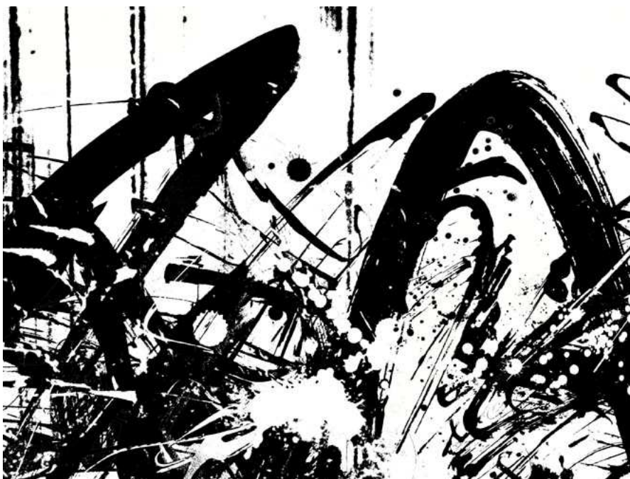
1 pav. „Prisilietus prie 220“

Šios kompozicijos pavadinimas „Prisilietus prie 220“. Ne tik kompozicija, bet ir jos pavadinimas palieka erdvės kiekvieno žmogaus fantazijai, interpretavimo erdvei. Galbūt kažkam skaičius 220 asocijuojasi su automobilio pasiektu nesaugiu greičiu, o kompozicijoje esančios linijos primins sudužimą, išsiskaidymą. Man šis skaičius labiausiai siejasi su srove, tačiau ne elektros, o įvairių jausmų. Tai tarsi netikėtai ir smarkiai prasiveržusi įvairių išgyvenimų, emocijų audra: nesuvaldomo liūdesio, įtūžio, juoko, isterijos, pykčio... Labai pasistengus visa tai galima suvaldyti, pavyzdžiui pyktį. Nuo pat vaikystės ši emocija tramdoma tėvų, aplinkinių, visai kitaip nei džiaugsmas ar liūdesys. Laikui bėgant tą jausmą išmokstame paslėpti, užgniaužti, nors tai gali sukelti ligą, kartėlį širdyje. Tačiau būna akimirku, kai jis išsiveržia iš vidinio žmogaus narvo, tai kodėl gi jo neišliejus ant balto popieriaus lapo?... Juk išmetus neigiamus jausmus iš sąmonės suteikiame daugiau erdvės ir vietos kerotis pozityviems jausmams.