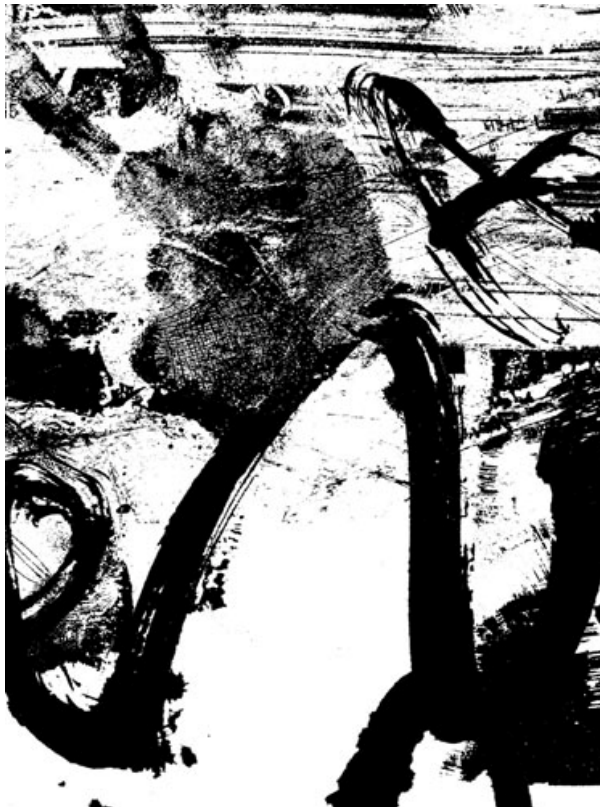
5pav. „Už kalno“

nuo suveltų, tarsi veltinis, bičių spiečius minčių ir pabėgti nuo kasdienybės, renku šilumą ir šviesą iš mažiausių kertelių, kad pasijusčiau rami, kad mintys imtų skaidrėti ir nebeapsunkintų dar labiau galvos bei širdies.