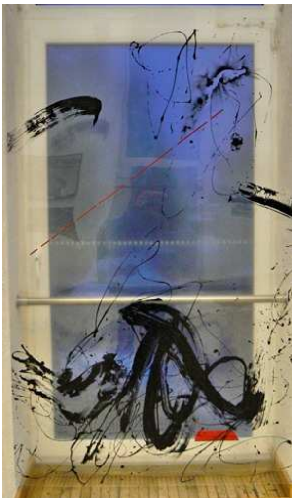
11 pav. „Šokis su teptuku“

Kompozicija pilna gyvenimo ir energijos. Persipynę stori ir ploni kaligrafiniai elementai sukuria žaismingą nuotaiką. Smulkių linijų tinklas tarsi jausmų maišatis. Linijos veda jausmų labirintais. Centre dinamiškas stambus kaligrafinis elementas primenantis a raidę. Tarsi viso ko pradžia. Kompozicijos kairiajame krašte išlenda netikėtas potėpis. O dešiniajame krašte kūrėjo rankos prisilietimo žymė. Vienu metu veikia trys dalykai: protas, širdis, ranka. Kompoziciją papildo ir pagyvina raudoni akcentai. Spalva įvedama todėl, kad miesto fone taip pat daug spalvų. Raudona įstriža punktyrinė linija suvirpina erdvę. Iš pirmo žvilgsnio minimalus sprendimas sukuria emocijų pripildytą vaizdą. Viską nulemia dinamiškų elementų ir miesto fono sintezė.