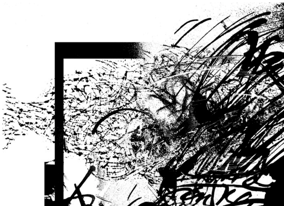
9 pav. „Permainingas gūsis“

Aš kaip ir tas karalius – pavargstu nuo kambario sienų ir siekiu išsilaisvinti. Kūryba padeda, ji pajudina tą kubo sieną ir aš atrandu mažą, nesandarų plyšelį – tada galiu ištrūkti.