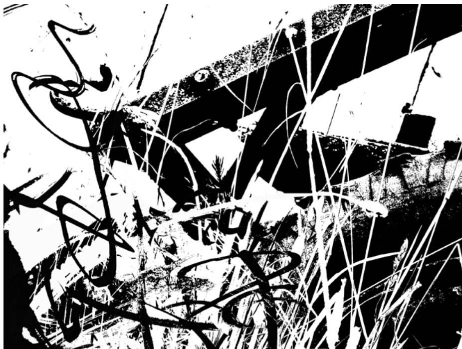
10 pav. „Poilsis“

Viesulas – oro sukuryms po audros debesimi. Esu atvira gyvenimui. Priimu ir viesulus, kurie įsisuka jame, ir ramybę, ir visa visa, kas yra išorėje. Tai, kas vėliau galbūt patenka į mane tampa sava. Su tuo susigyvenu ir mokausi iš visko, ką matau, patiriu, suprantu. Po audros ateina ramybė.