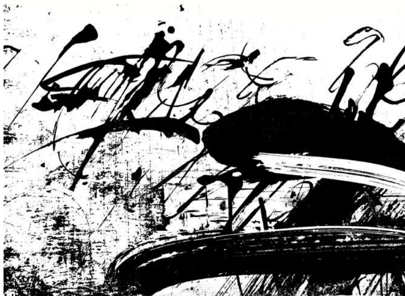
1pav. „ Dienos raštas “

Naudojama linijų storių gausa kuria erdvės išpūdį. Paveikslas pulsuoja energija – neprognozuota, tranki, stipri. Su trenksmu išsiveržusi energija gali sukelti pojūtį, kad kažką pražiopsojau, nespėjau pažiūrėti, dėl ko įvyko tas sprogimas.