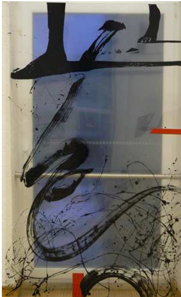
12 pav. „ Gaivalas “

Kas slypi už sodraus gaivališko potėpio?