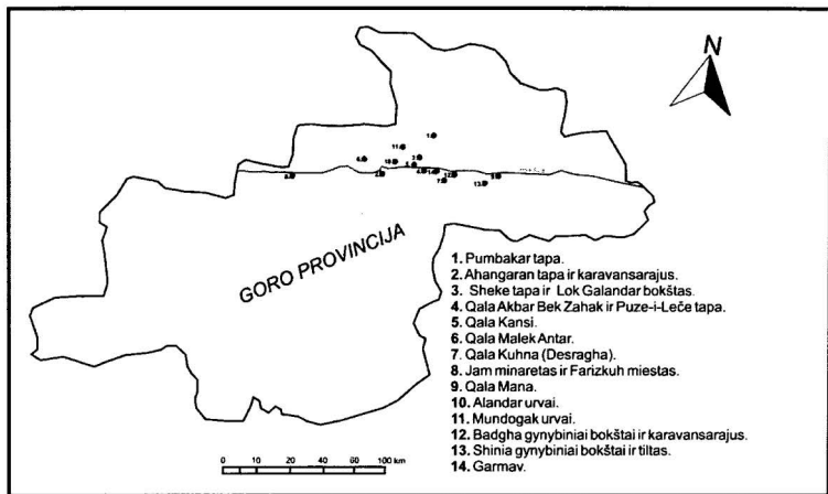
2 pav. Afganistano Goro provincijoje žvalgyti objektai (2007 10 07–2007 10 21)

mažos tapa , t. y. buvusios pastatų vietos, paviršiuje išsiskiriančios šviesesne grunto spalva. Ahangarano gyvenvietės tapa Nr. 3 lobių ieškotojų iškastoje duobėje buvo matyti pastato siena, mūryta iš nedegtų molio plytų. Įvairiais laikais naudotos skirtingų dydžių ir formos plytos, taip pat statyta iš pachsos ar čimo 11 . Pastatų vietas taip pat žymėjo gausiai aptinkama plačios chronologijos keramika, kuri įrodo šiose teritorijose egzistavus ilgalaikes gyvenvietes. Ankstyviausi keramikos radiniai, žvalgymų metu aptikti Pumbakaro ir Ahangarano gyvenvietėse, priskiriami IV–III tūkstm. pr. m. e. ankstyvųjų žemdirbių kultūrai. Tai – raudonu angobu padengta keramika su įvairiais to laikotarpio menui būdingais juodais piešiniais ornamentais (stilizuoti gyvūnai, geometriniai motyvai). Analogų Pumba-