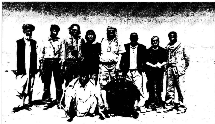
1 pav. Ekspedicijos dalyviai iš Lietuvos ir Afganistano Pumbakaro gyvenvietėje 2007 10 15