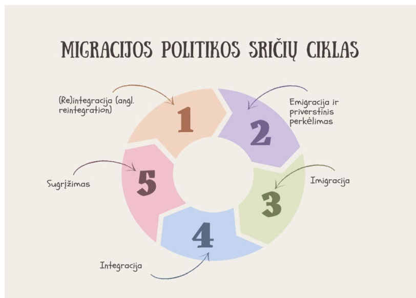
Pav. 1 Pagrindinių migracijos politikos sričių ciklas (sudaryta darbo autorės)