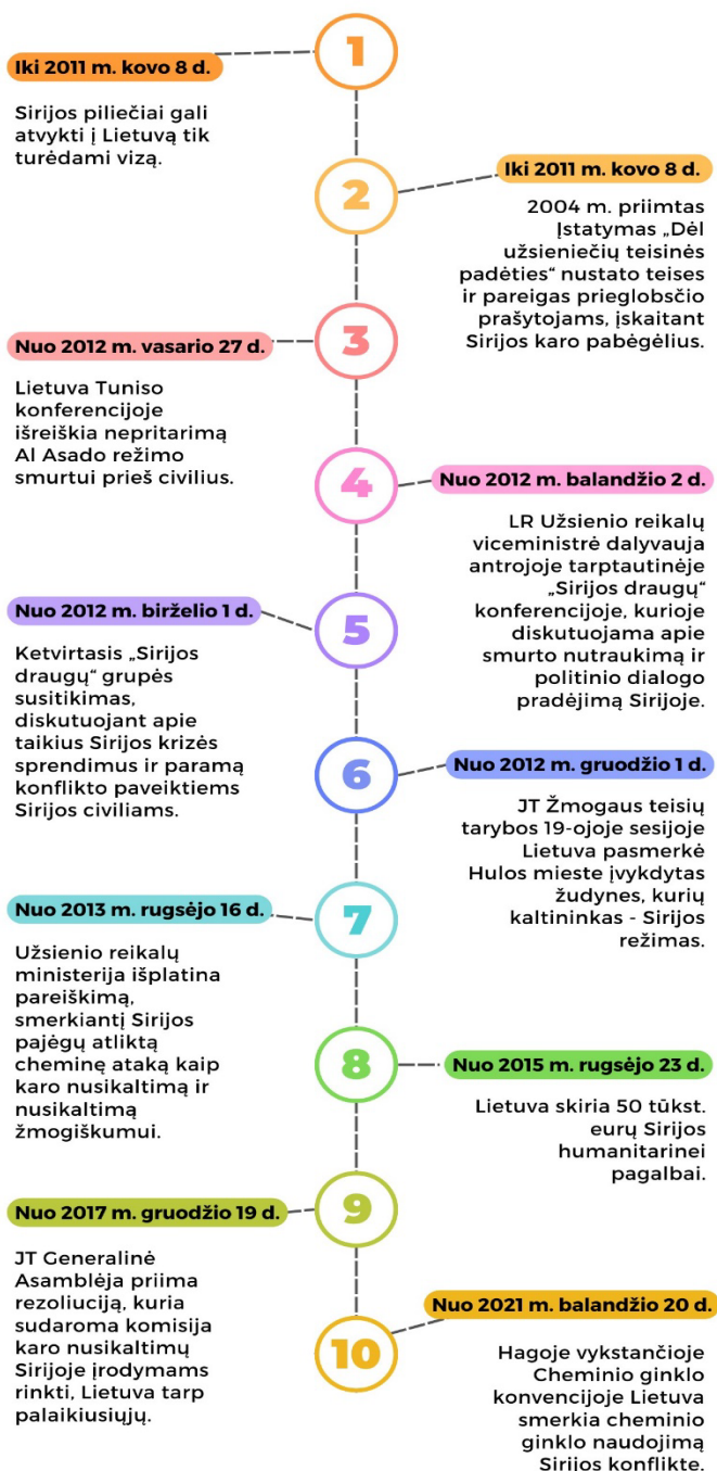
Pav. 4 Migracijos politikos priemonės priimtos karo pabėgėlių iš Sirijos atveju laiko juostoje (sudaryta darbo autorės) 8