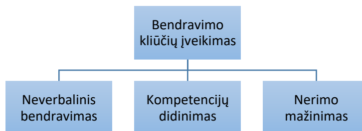
3 pav. Priemonių rinkinio YVYC veiksmingumas (Kellett, 2011)

Kitas kalbos ir kalbėjimo vertinimo metodas yra YVYC (ang. Your Voice, Your Choice), liet. „Tavo balsas, tavo pasirinkimas“ pagal Kellet, 2011.