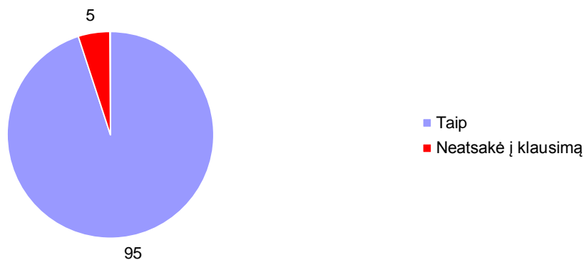
2 pav. Respondentų pritarimas mokytojo padėjėjo reikalingumui, %

Tyrimu buvo siekta išsiaiškinti, kokių kompetencijų reikia mokytojo padėjėjui, nes tai liečia ne tik mokinių socialinių gebėjimų ugdymą, bet ir ugdymąsi paminėje veikloje.